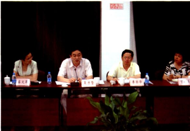
2008年8月14日，南汇区少儿基金管委会（扩大）会议召开。