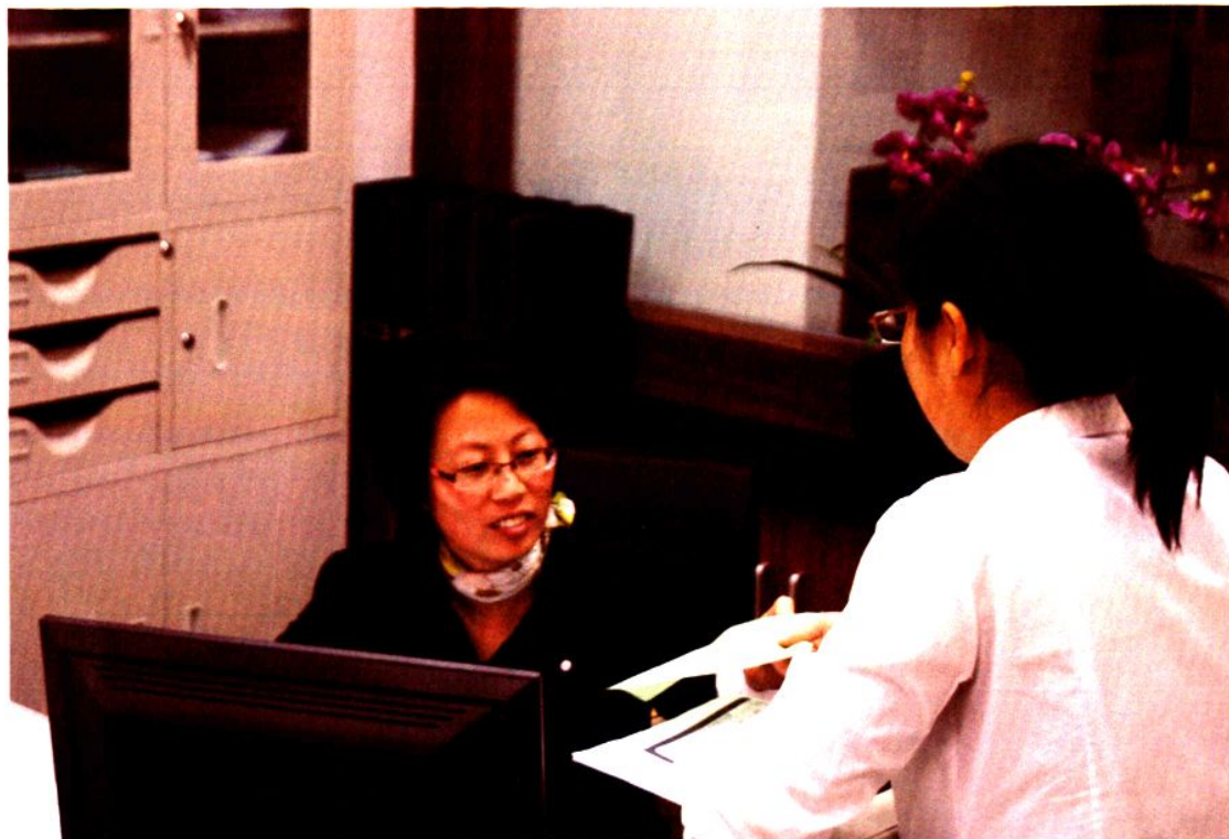
区少儿基金工作在服务窗口接待到访者。