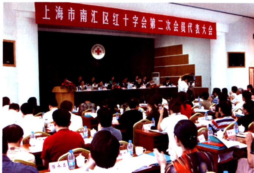
2007年5月30日，南汇区红十字会第二次会员代表大会召开。