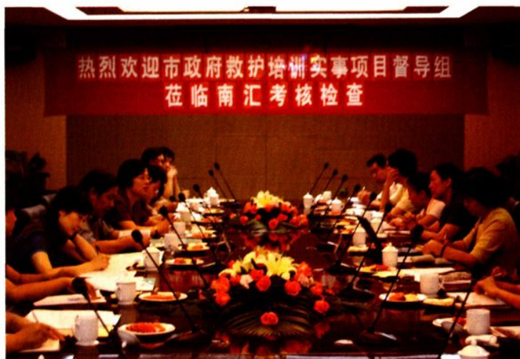
2008年9月9日，上海市救护培训实项目督导组到南汇检查。