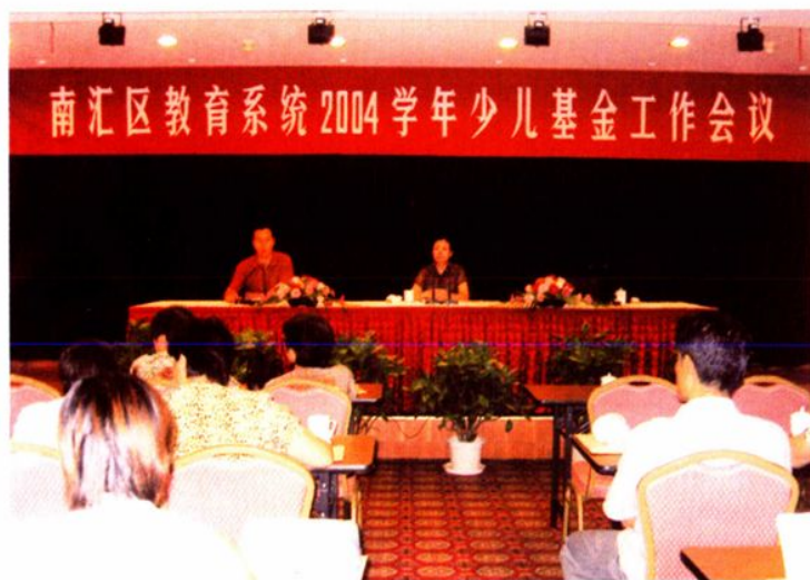
2004年8月27日，南汇区教育系统2004学年少儿住院基金工作会议召开。