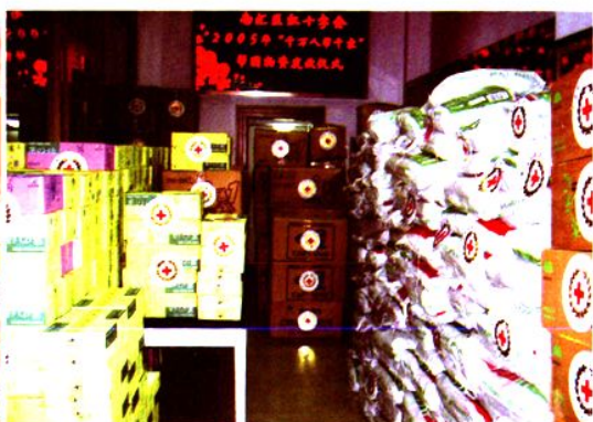
2005年1月15日，区红十字会进行“千万人帮千家”迎春帮困活动，向社区发放爱心物资。