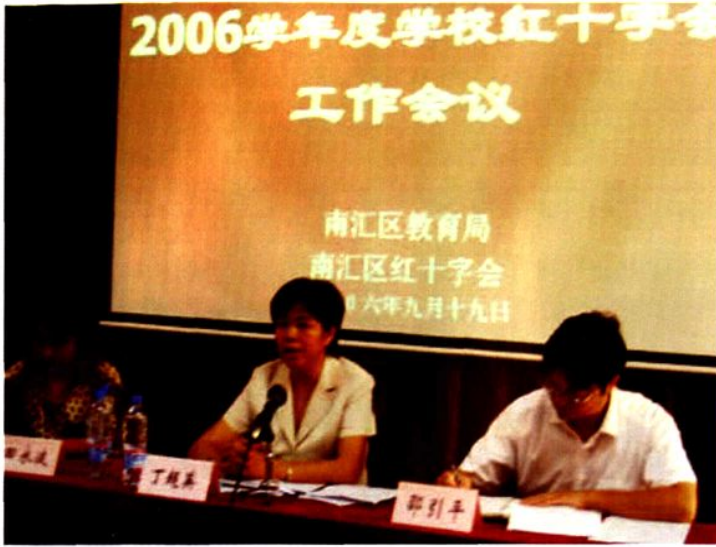
2006年9月19日，区红十字会与区教育局联合召开学校红十字会工作会议。