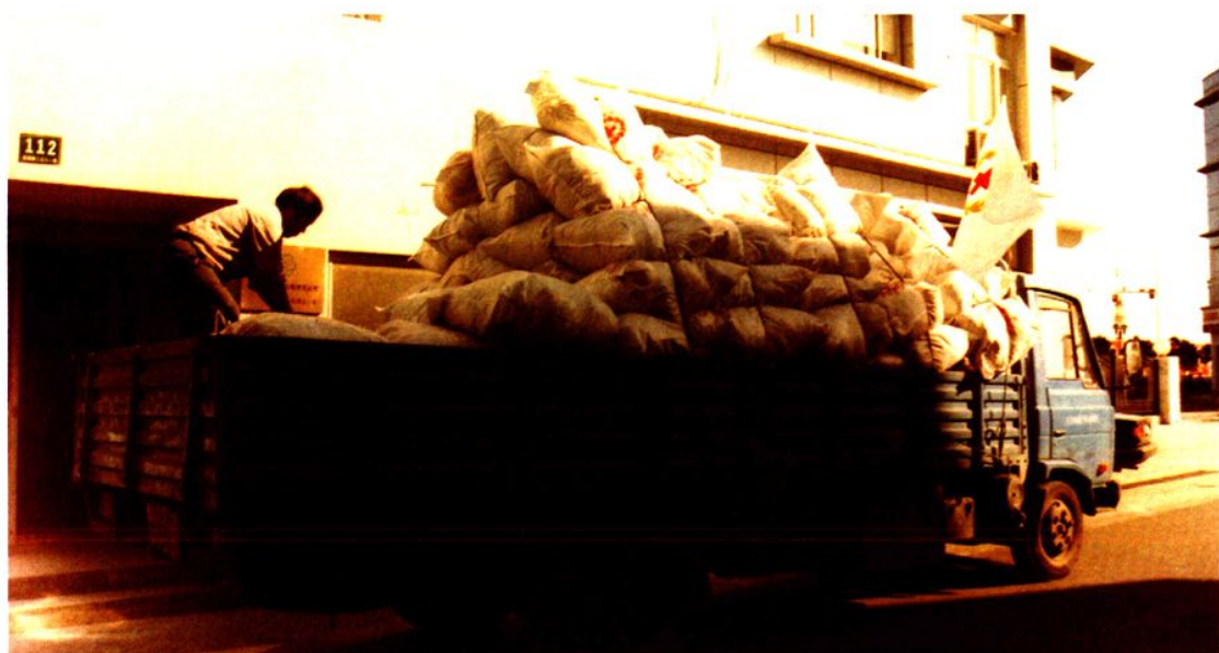
2008年6月12日，向四川汶川运送救援物资，物品价值275.53万元。