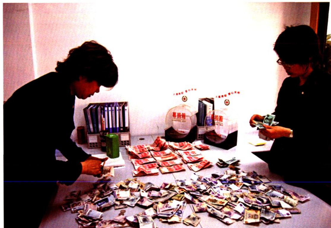
区红十字会工作人员清点募捐款。