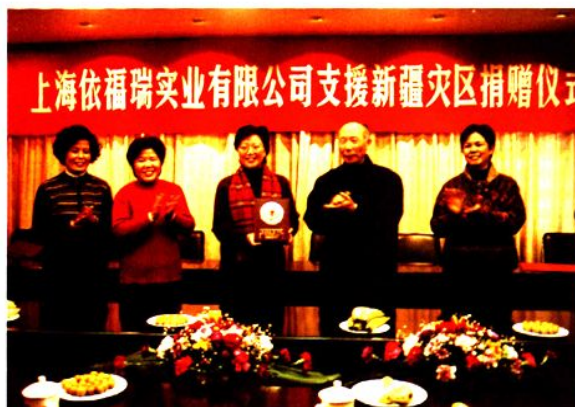
2003年3月1日，接受依福瑞公司捐赠。