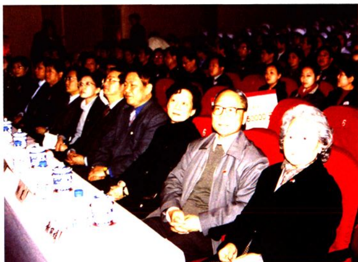
2004年3月31日，南汇区四套班子领导出席“庆百年、博爱行”庆祝中国红十字会100周年纪念大会。