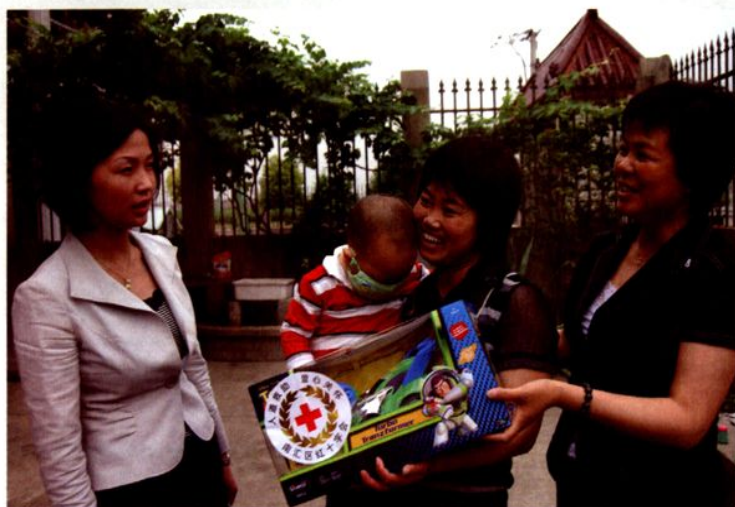
区、镇红十字会领导慰问白血病患儿。