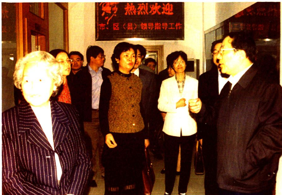
2003年10月13日，上海市副市长杨晓渡（右一）到南汇区红十字会视察工作。