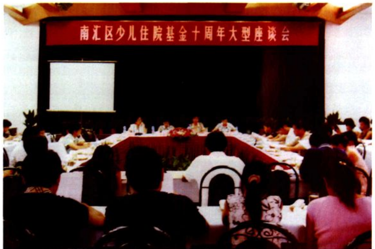
2006年8月，南汇区少儿住院基金10周年座谈会在南园宾馆召开。