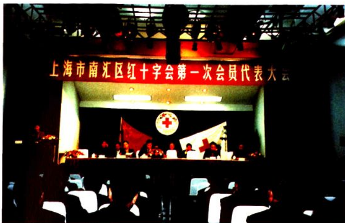
2002年3月13日，南汇区红十字会第一次会员代表大会召开。