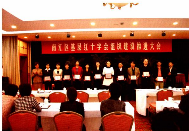
2008年4月23日，南汇区基层红十字会组织建设推进大会召开。