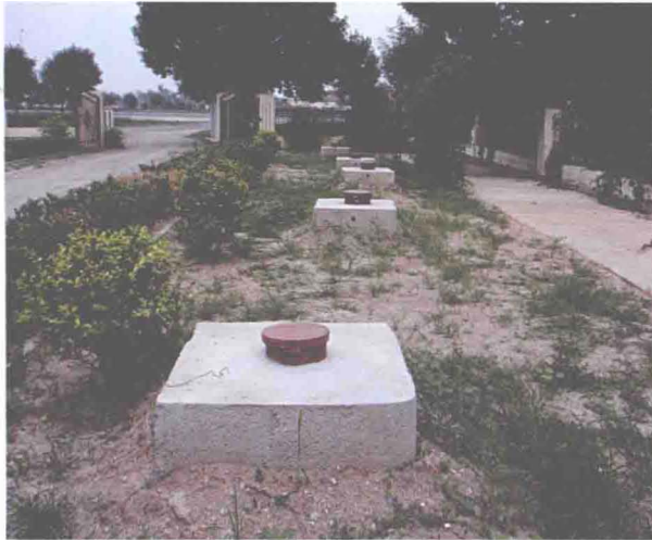
▲ 外环海河泵站新打的国家级观测井 (摄于 2008 年 4 月)