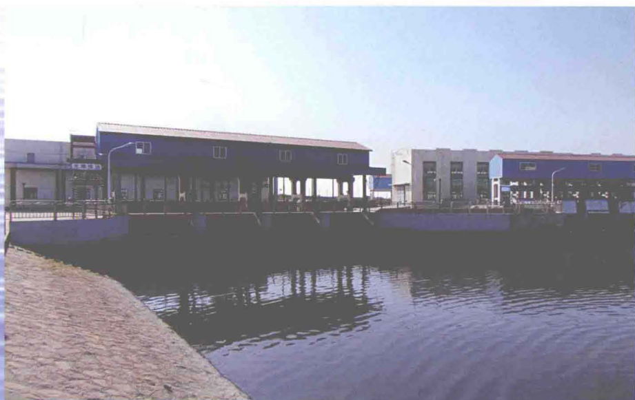
◀坐落在东减河河口的袁家河泵站、袁家河第二泵站枢纽工程（摄于2013年5月）