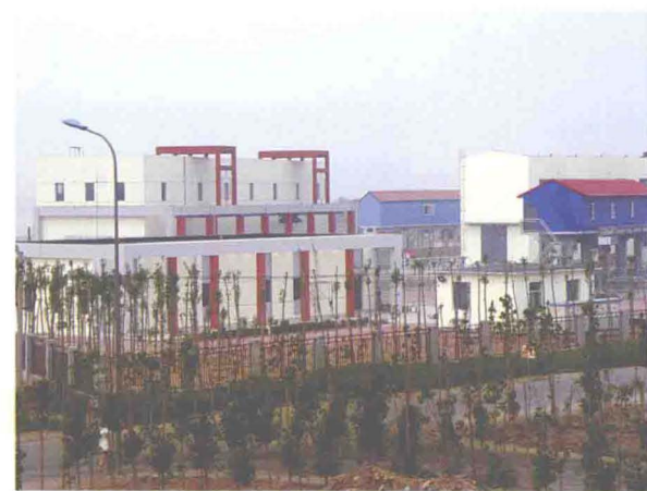
▲坐落在东减河河口的袁家河第二泵站（摄于2010年10月）