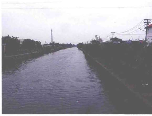
▲路河结点改造后的西减河津塘公路北段（摄于2008年10月）