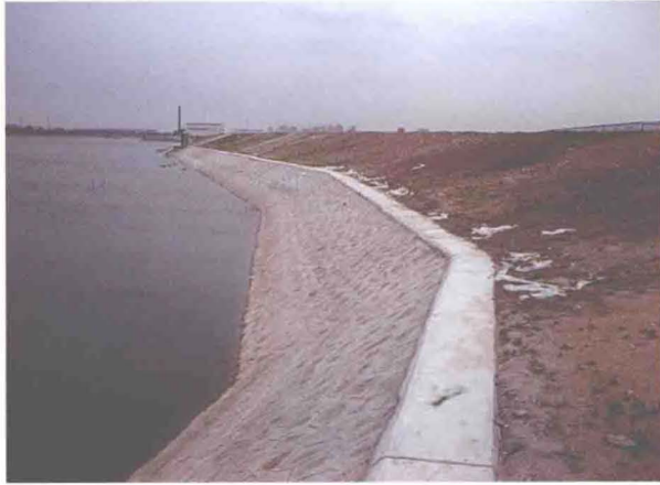
▲东丽区实施海河左堤苏庄段浆砌石护坡 (摄于2010年5月)