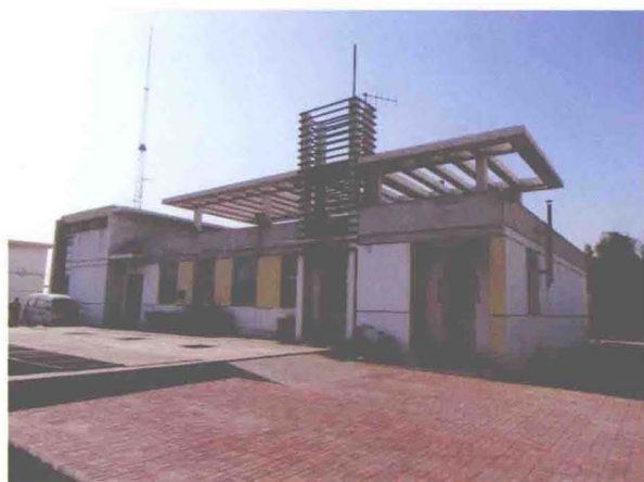
▲坐落在赵家河口的天钢泵站（摄于2013年5月）