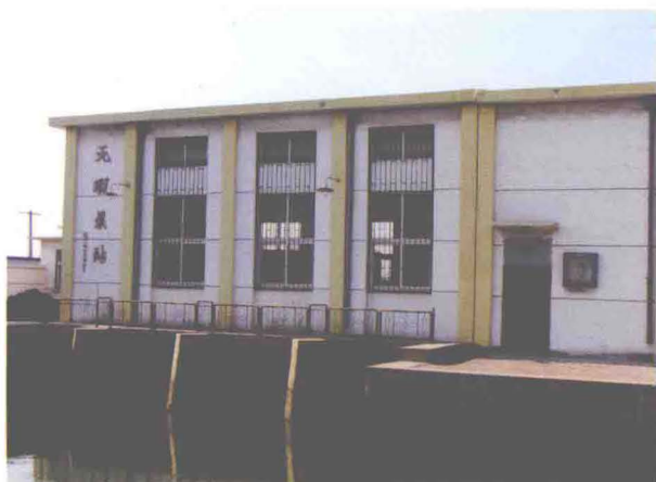
▲坐落在赵家河口的无暇泵站（摄于2013年5月）