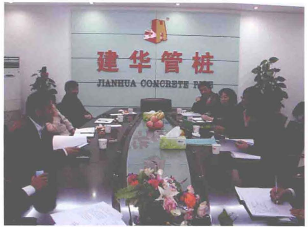
▲ 天津市节约用水办公室对东丽区机关事务管理局、天津建华管桩有限公司进行节水型单位、企业验收 (摄于 2010 年 11 月 3 日)