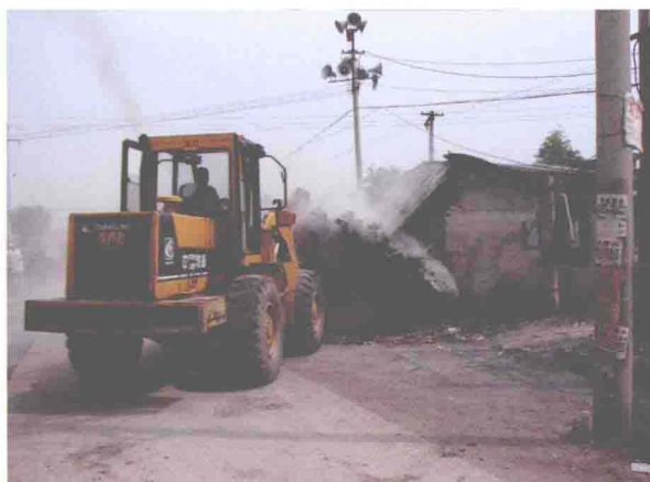
▲东丽区联合执法对西减河沿岸违章建筑物强制拆除（摄于2007年6月22日）