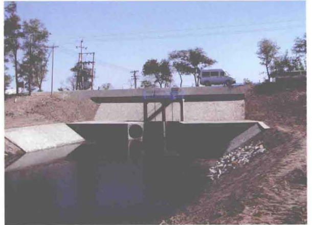
▲东丽区实施金钟河右堤欢坨二线泵站排灌闸 维修加固 (摄于2005年5月)