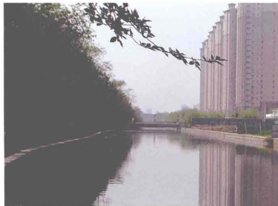
▲治理后的外环线以内月西河段（摄于2013年5月）