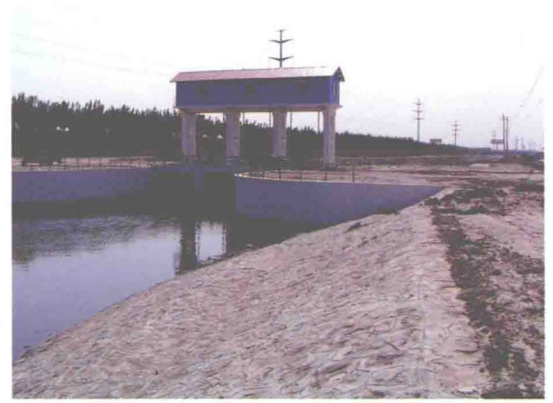
▲坐落在京津塘高速公路北侧东减河临时河道津汕公路段上的节制闸 (摄于2010年7月)