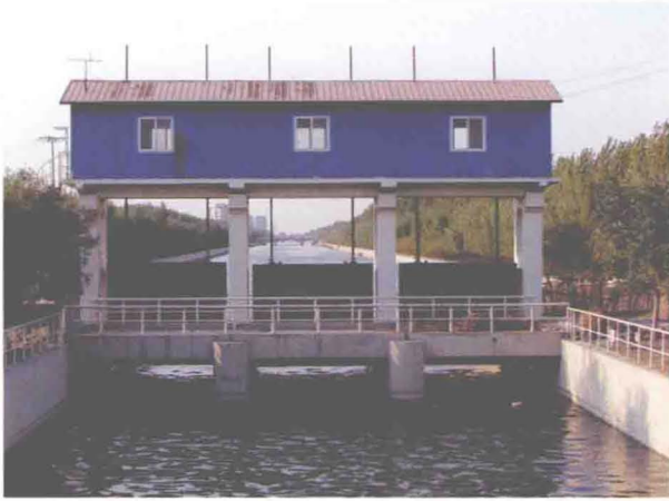
▲坐落在津汉公路北侧东减河上的袁家河1号闸 (摄于2011年10月)