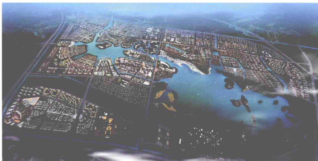
▲东丽湖鸟瞰图（摄于2010年）