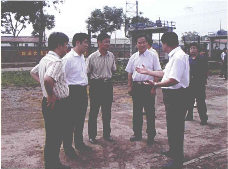
▲2006年7月9日，天津市副市长孙海麟（右二）视察东丽区外环河改造工程