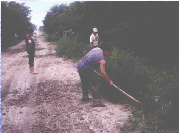
▲东丽区进行金钟河右堤 18+000~34+800 段堤顶堤坡维修养护 (摄于2009年6月)