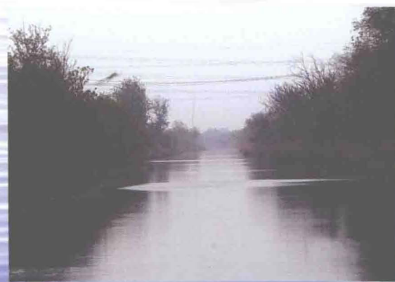
▲西减河津汉公路北段河道（摄于2013年5月）