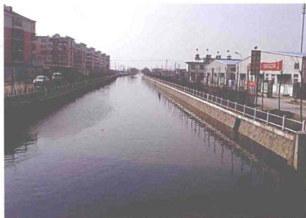
▲路河结点改造后的东河津塘公路南段（摄于2008年3月）