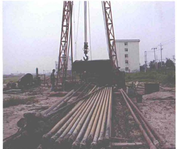
▲ 东丽区教绿科技园区凿井施工现场 (摄于 2010 年 4 月)