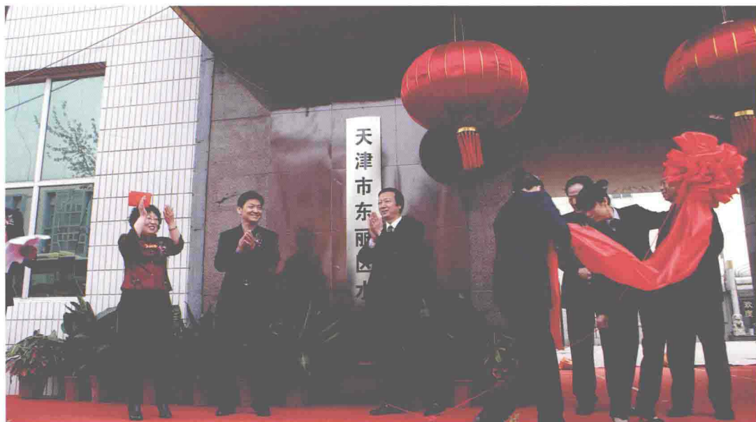
▲2010年4月26日，天津市东丽区水务局揭牌