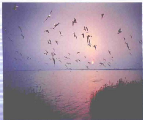
▲东丽湖改造前风光（摄于2005年）