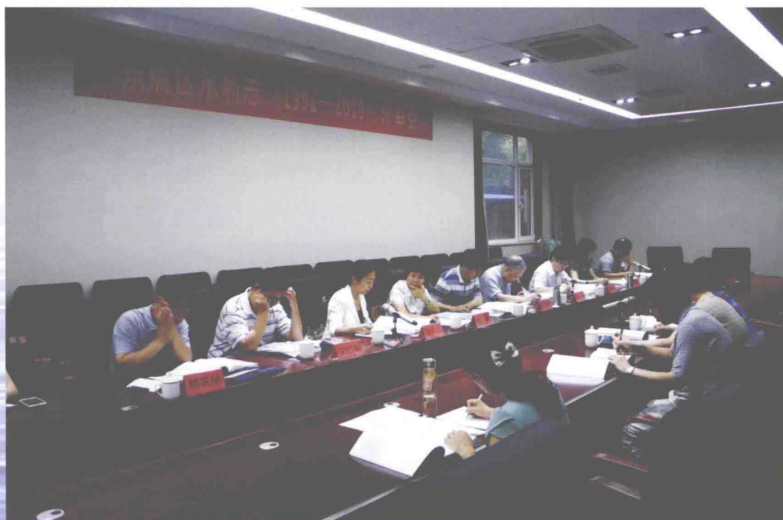
▲《东丽区水利志（1991—2010）》评审会现场（摄于2013年7月9日）