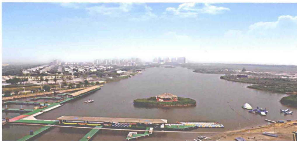
▲第二十九届世界滑水锦标赛东丽湖万科滑水赛道（摄于2005年4月）