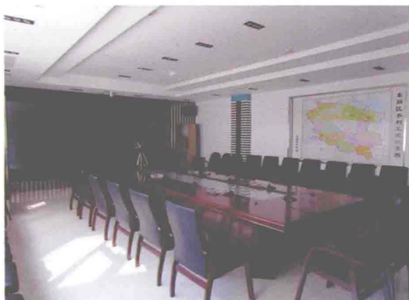
▲坐落在东丽开发区一径路6号东丽区水务局内的东丽区防汛指挥中心（摄于2009年8月）