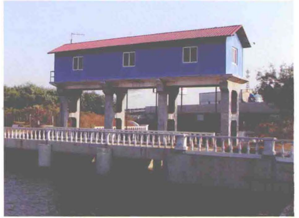
▲坐落在京津塘高速公路北侧东减河上的袁家河2号闸 (摄于2013年5月)