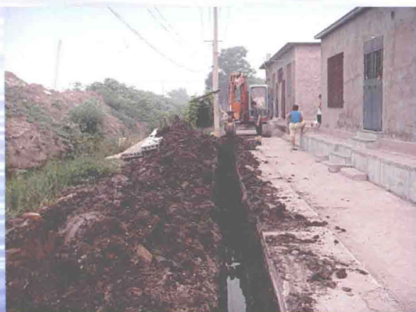
▲ 东丽区新立街新兴村管网入户和饮水安全施工现场 (摄于 2010 年 7 月 31 日)