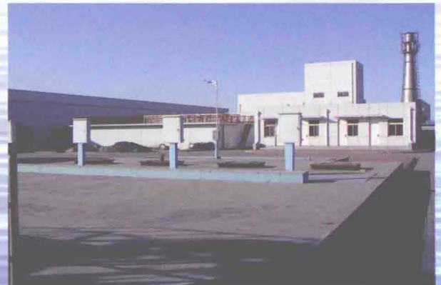
▲东丽区华明工业园污水处理厂 (摄于2010年10月)