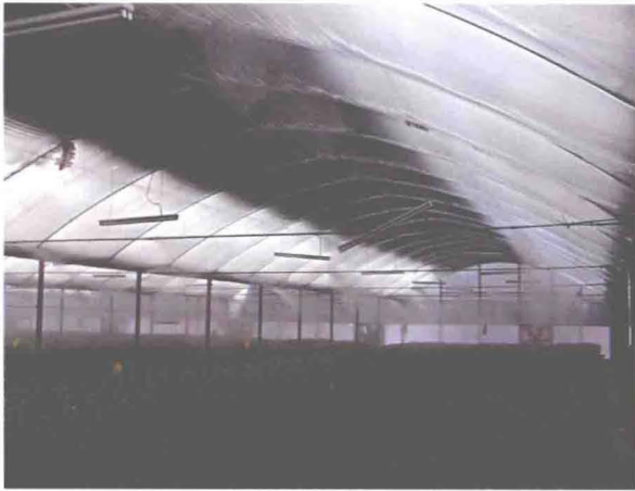
▲ 丽水园区花卉棚微喷设备 (摄于 2005 年 4 月)