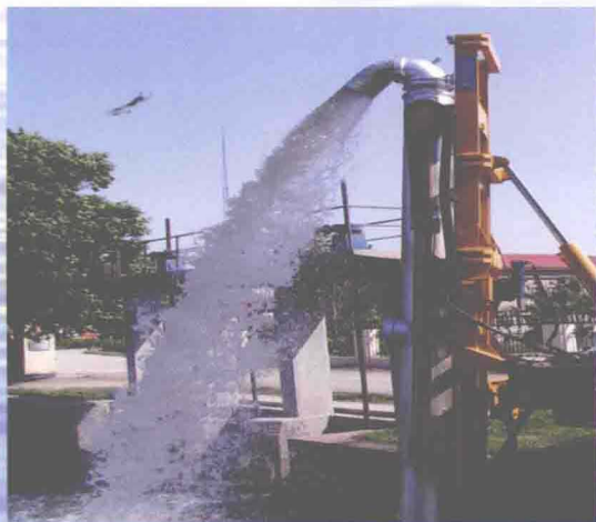
▲东丽区防汛物资储备的移动排水泵车（摄于2011年10月）