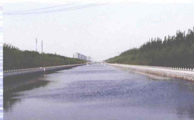
▲治理后的东减河华明家园段（摄于2010年10月）