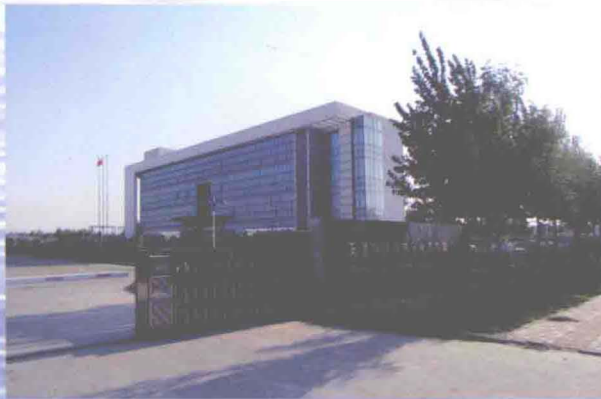
▲坐落在空港经济区内中环东路与东八道交口处的空港经济区污水处理厂 (摄于2013年10月)