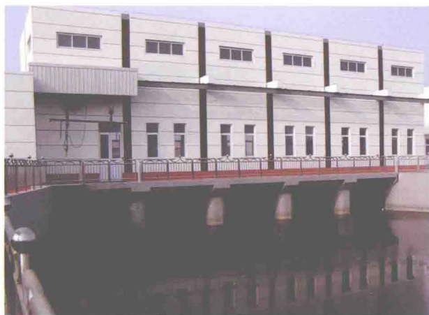
▲坐落在西河河口的西河泵站（摄于2009年10月）