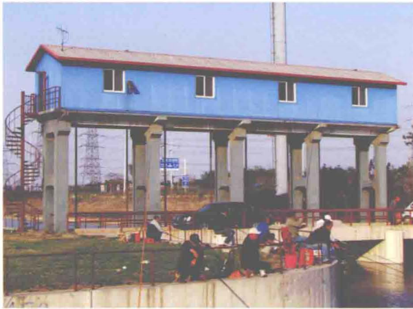
▲坐落在津汉公路南侧新地河上的新地河闸 (摄于2013年5月)