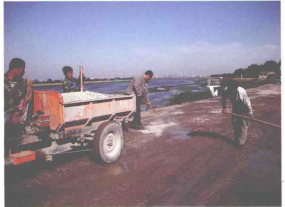
▲东丽区进行海河左堤泥窝段泥石路面养护 维修 (摄于2009年4月)