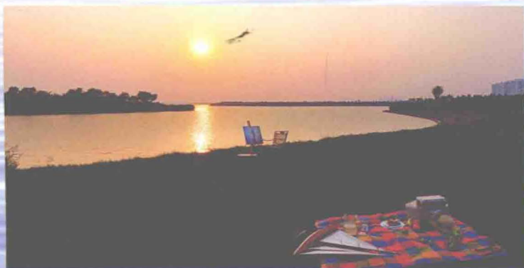
▲东丽湖改造后风光（摄于2012年）