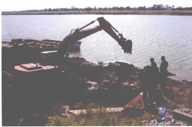
▲东丽区实施海河左堤老袁村船闸治理工程现场 (摄于2006年9月)