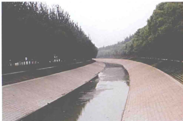
▲治理后的外环河顾庄段（摄于2010年5月）