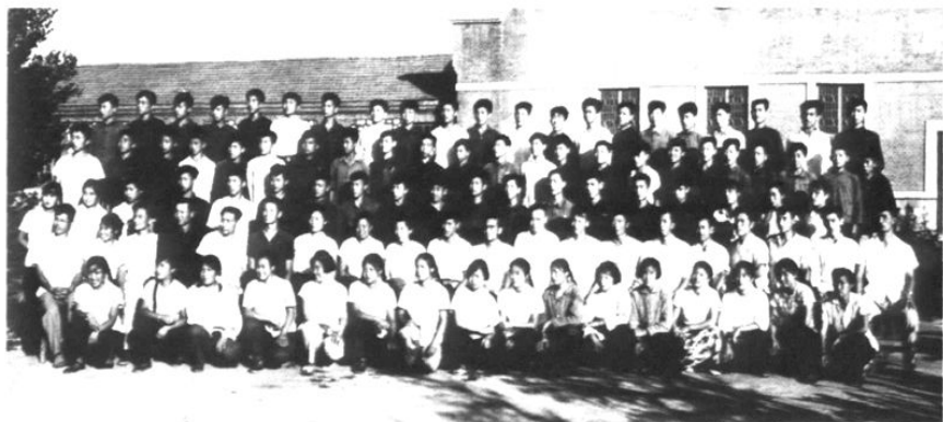
1965年7月16 日,辽宁省农村实验 中学全体初中毕业生 合影。