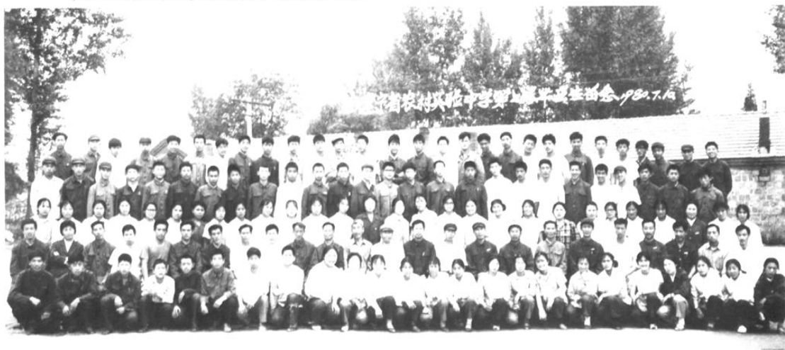
1980年7月10日,辽宁省农村实验中学1980届全体高中毕业生合影。