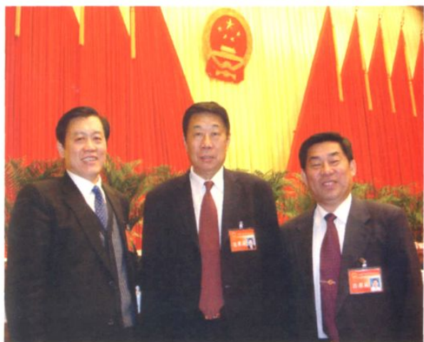
↑ 2008年1月,在辽宁省第十一届人大第一次会议上,原中共辽宁省委书记、全国人大财经委副主任委员闻世震(中),丹东市人大常委会主任曲仁田(左)与辽宁省第十一届人大代表、省农村实验中学校长冯振飞(右)合影。