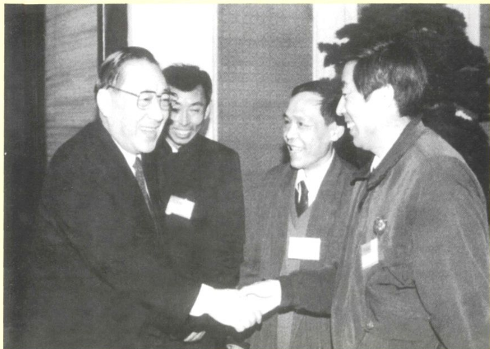
1994年12月27日,国务院副总理李岚清(左一)在北京中南海紫光阁接见荣获“全国十杰教师”称号的冯振飞校长(右一)。