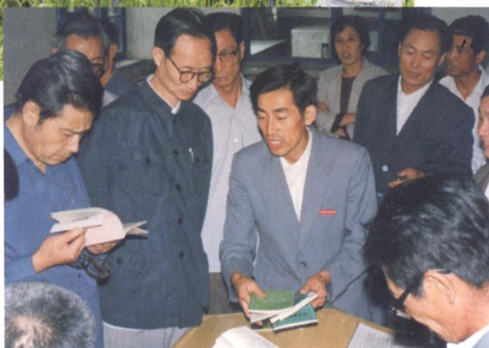
国家教委副主任王明达（左二）等领导视察我校教育改革、教材编写情况。