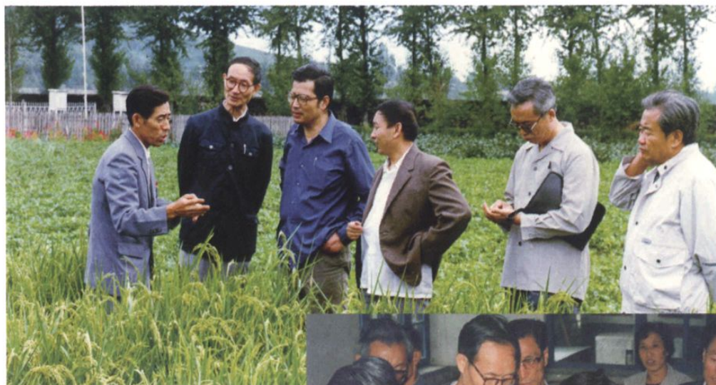
↑ 国家教委副主任王明达（左二）等领导同志视察学校试验田。