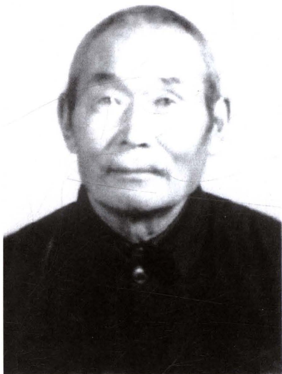
已故民间蒙医格尔提