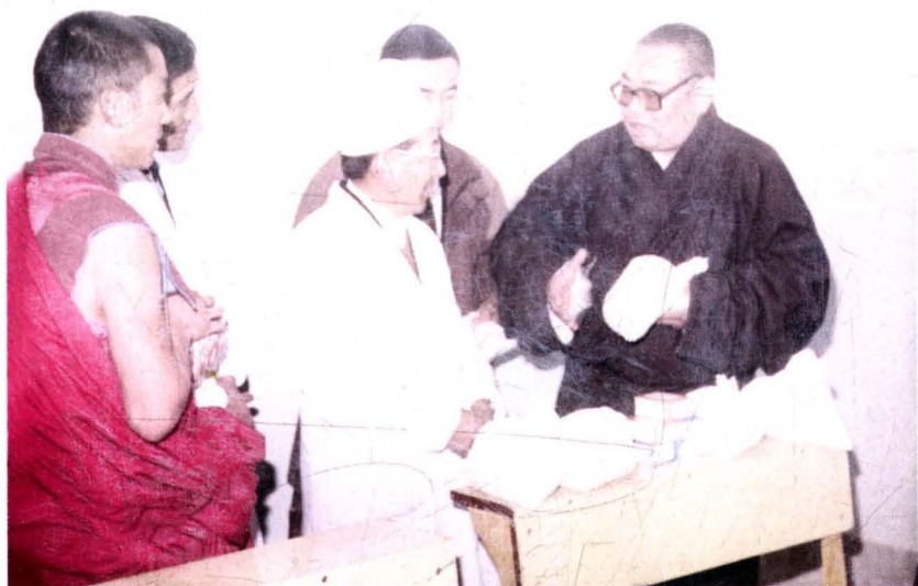
1994年10月,全国政协常委、甘肃省人大常委会副主任嘉木样·洛桑久美·图丹却吉尼玛视察肃北蒙古族自治县人民医院蒙医科,并赠送藏药