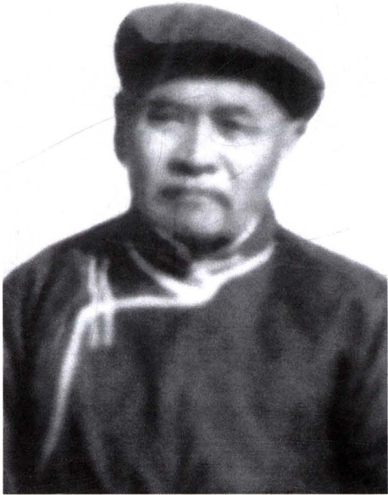
已故民间著名蒙医中傲斯尔