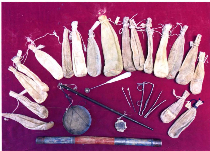
肃北民间蒙医过去用过的鹿皮蒙药袋和蒙药勺等