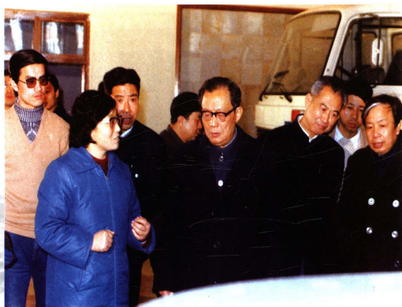
1987年1月11日，主任李荫寰、副主任楼叙真陪同国务委员张劲夫参观技术中心