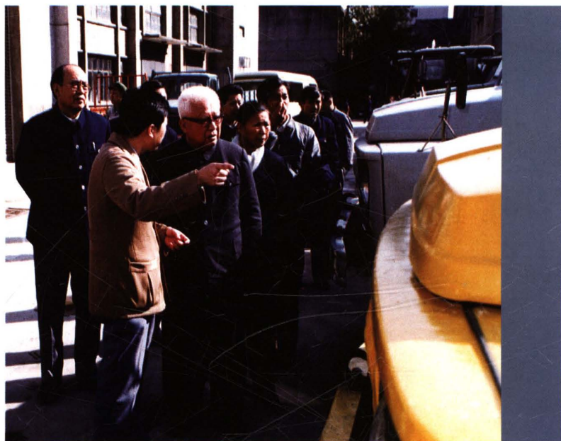
1985年11月7日，厂党委书记马跃陪同全国政协副主席刘澜涛参观新产品样车