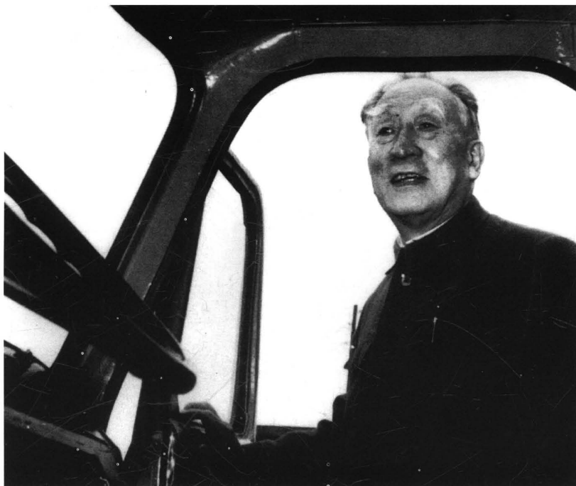
1981年10月20日，国务院副总理薄一波参观二汽，体验东风新车