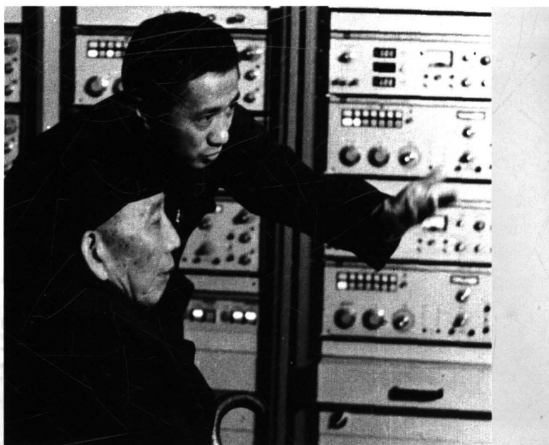
1982年11月9日，厂长陈清泰陪同中共中央政治局委员王震参观产品试验室