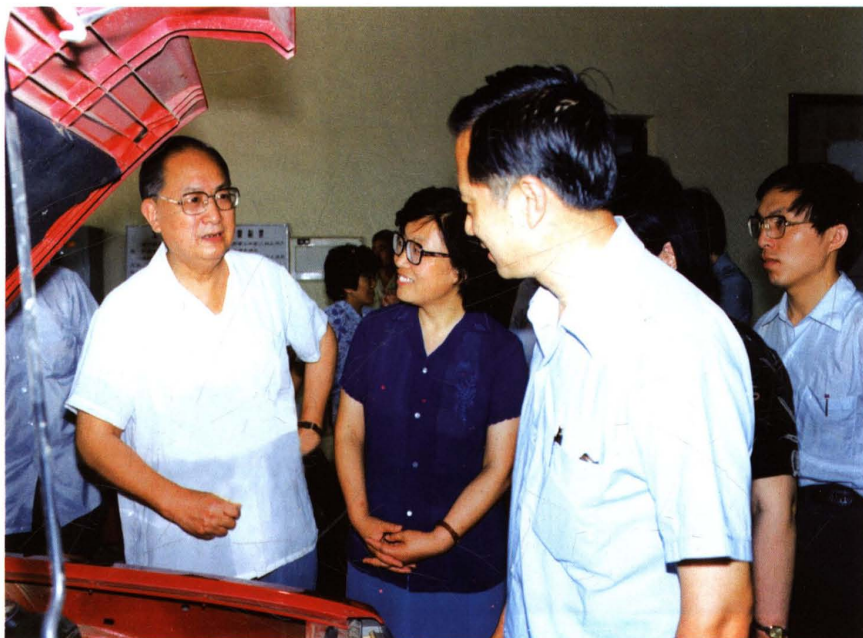
1988年6月15日，厂长陈清泰、主任楼叙真陪同机械工业部部长周健南参观新试制的样车