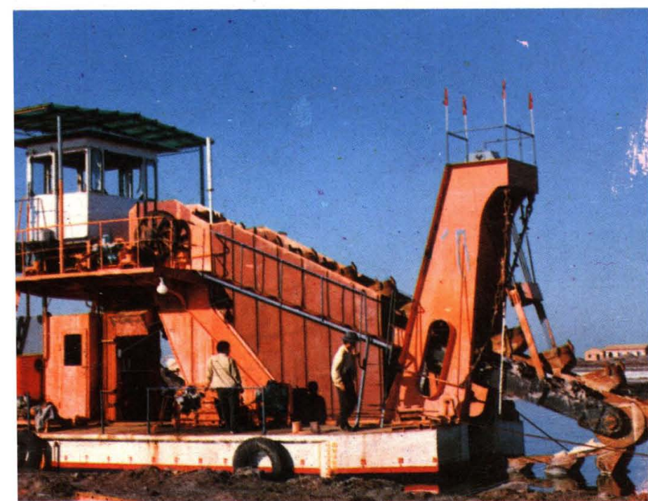
吉兰泰盐场使用的 链斗式采盐船