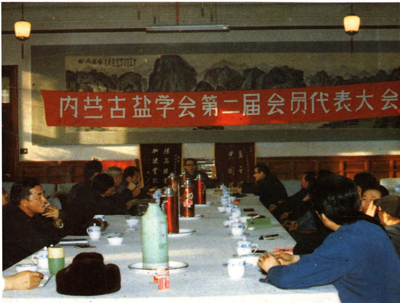
1985年内蒙古盐学会召开第二届会员代表会，产生了新的理 事会。图为代表们正在发言讨论。