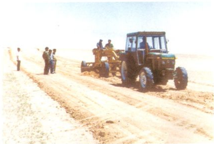
苏木(乡)公路施工现场