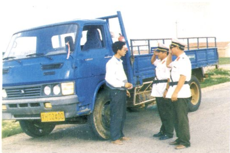
赛汉汽车总站运输秩序井然