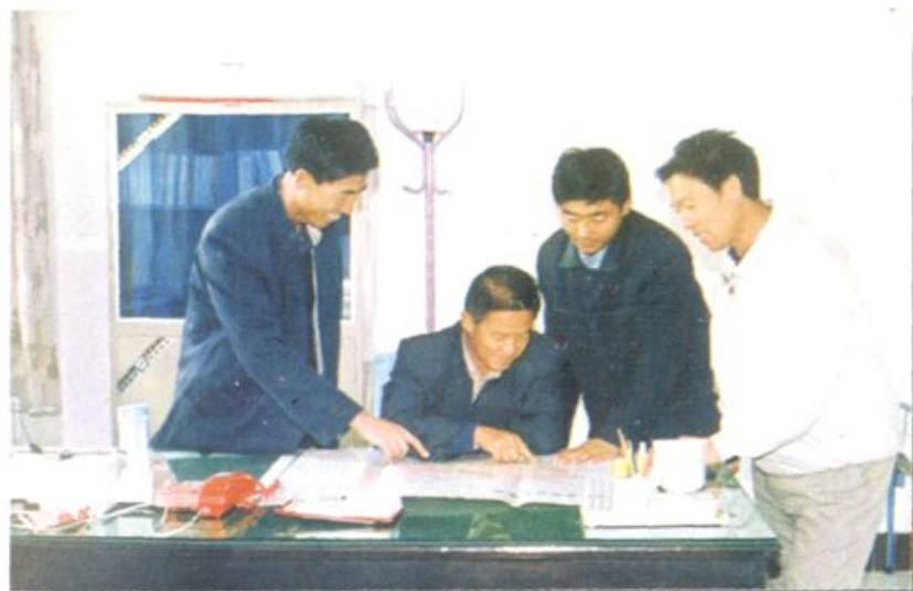
西苏旗交通局领导班子