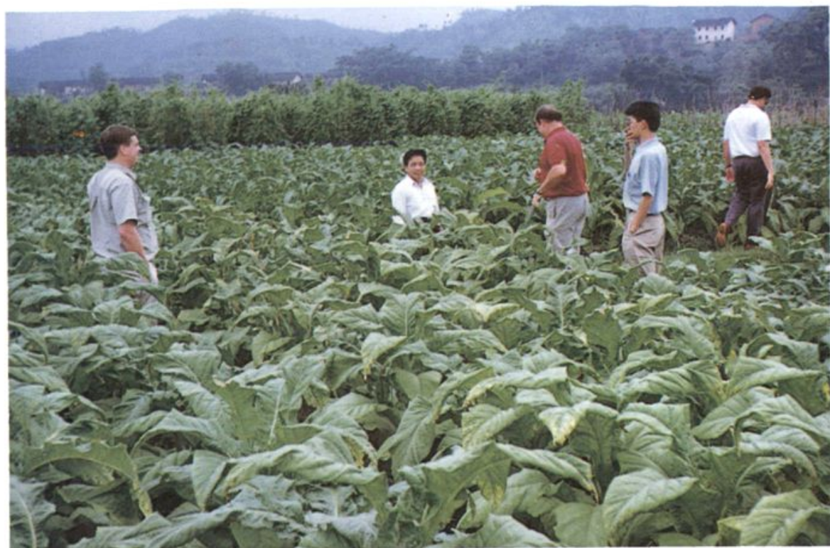
上杭县庐丰畬族乡万亩烤烟基地