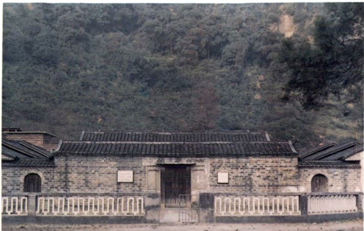
1929年毛主席在苏家坡畲村创办的“平民学校”