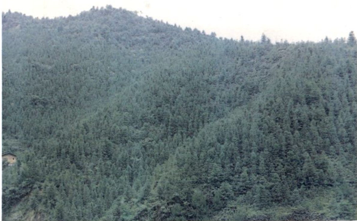
官庄树人畬族村万亩竹、果、林基地(杉木林)