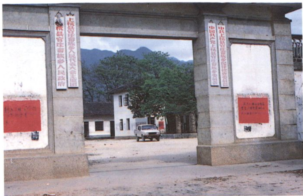
官庄畲族乡人民政府