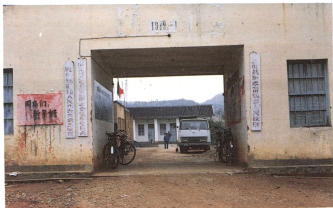
卢丰畲族乡人民政府