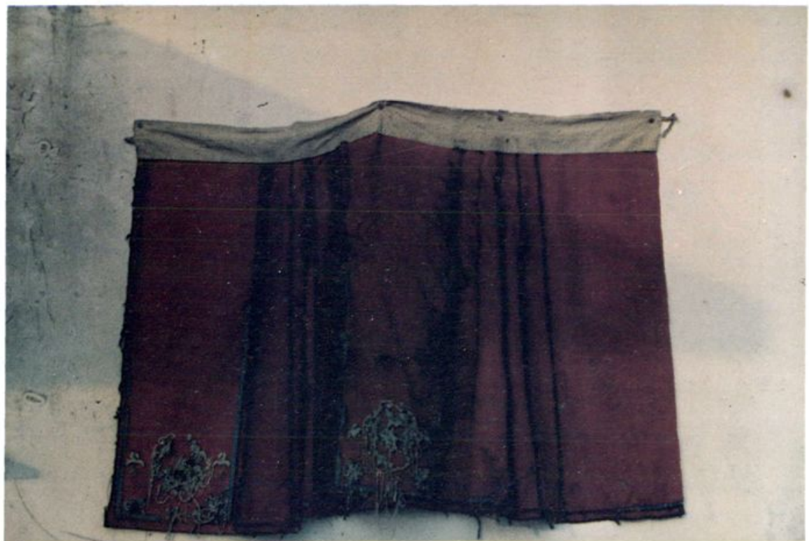
上杭蓝姓畚族保存的明代青年畚族妇女出嫁衣裙