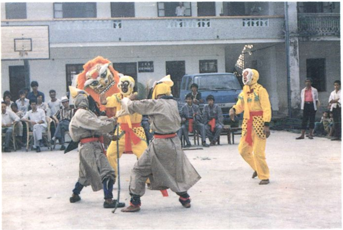
上杭畬族“狮子舞”获福建省第二届少数民族传统体育运动会二等奖