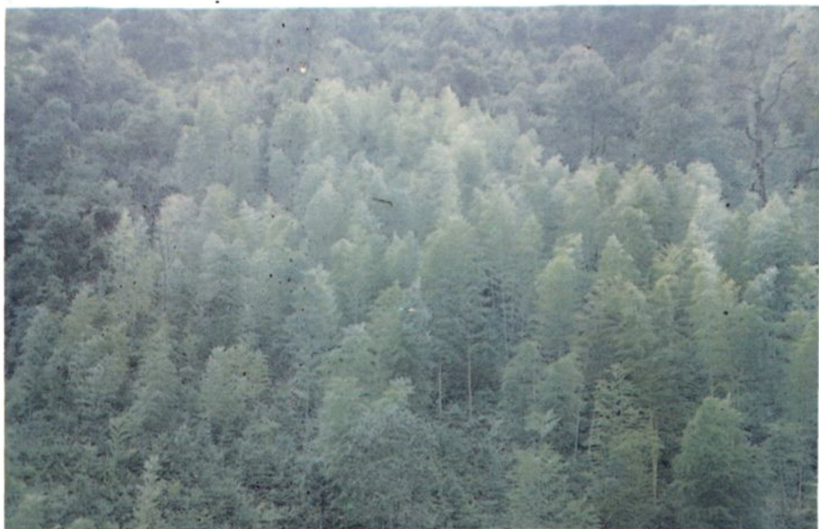
上杭官庄新民畬族村千亩毛竹基地一角