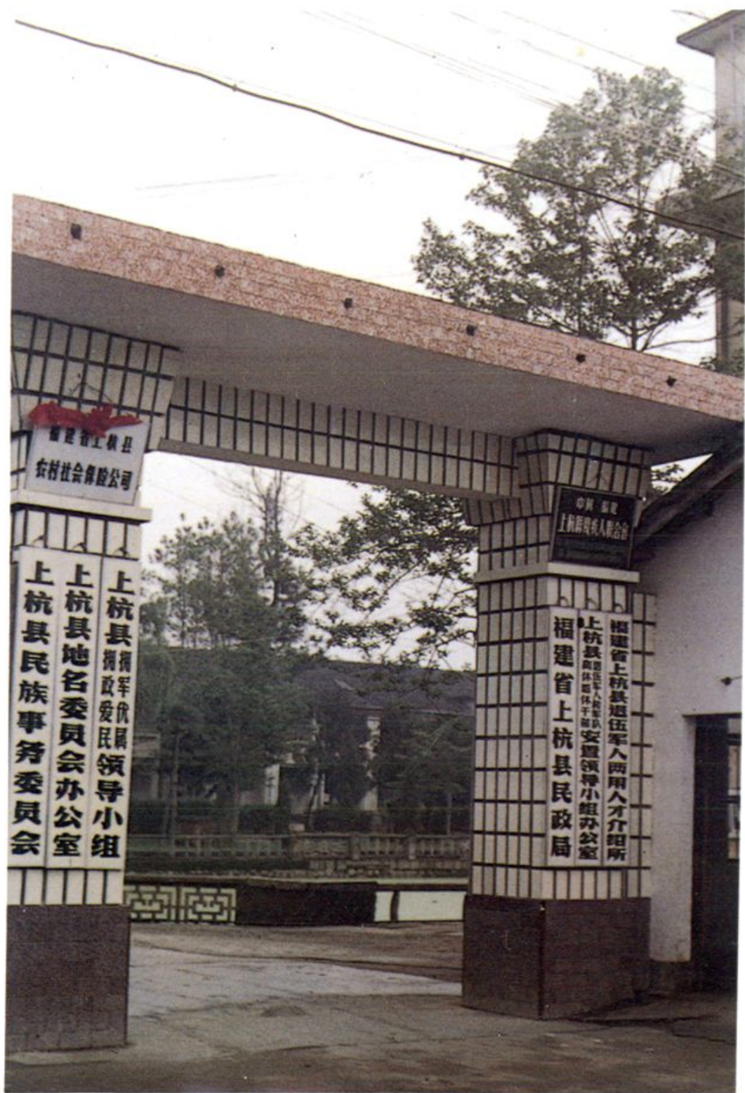
上杭县民族事务委员会