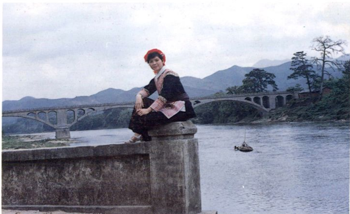
汀江“官庄畲乡大桥”一角