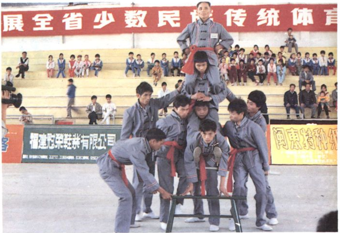
上杭畬族“叠罗汉”获福建省第二届少数民族传统体育运动会一等奖