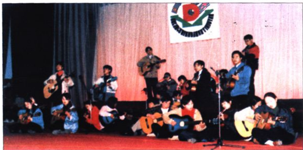
● 学生吉它艺苑社在演出