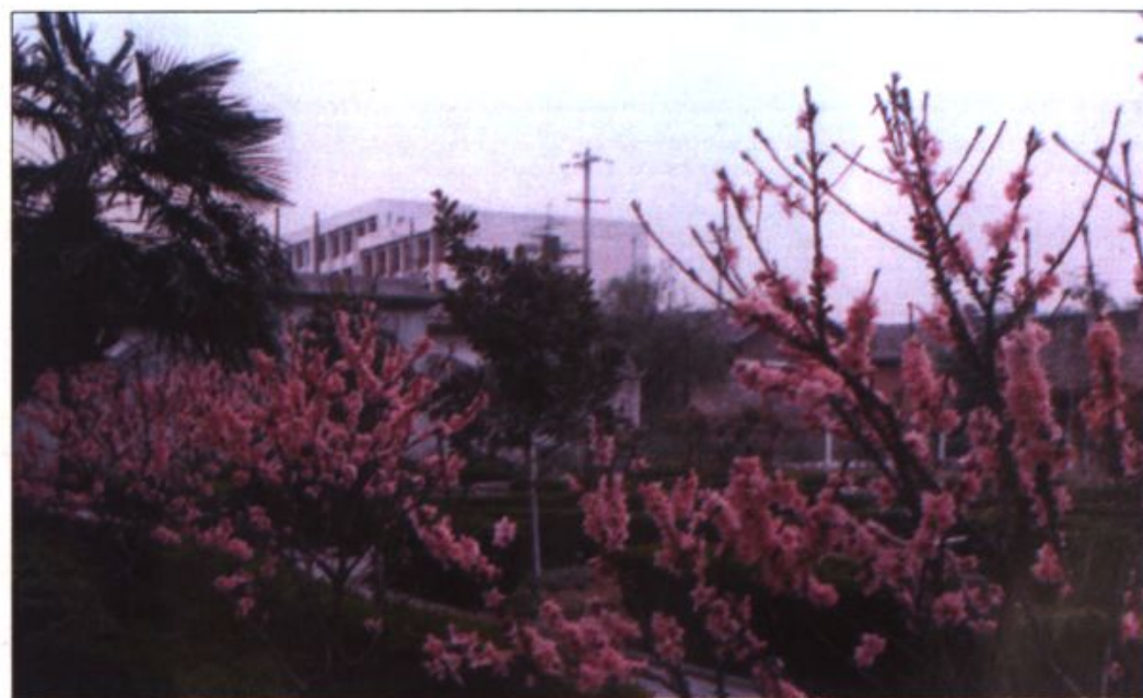
● 校园新貌之二——花园一隅