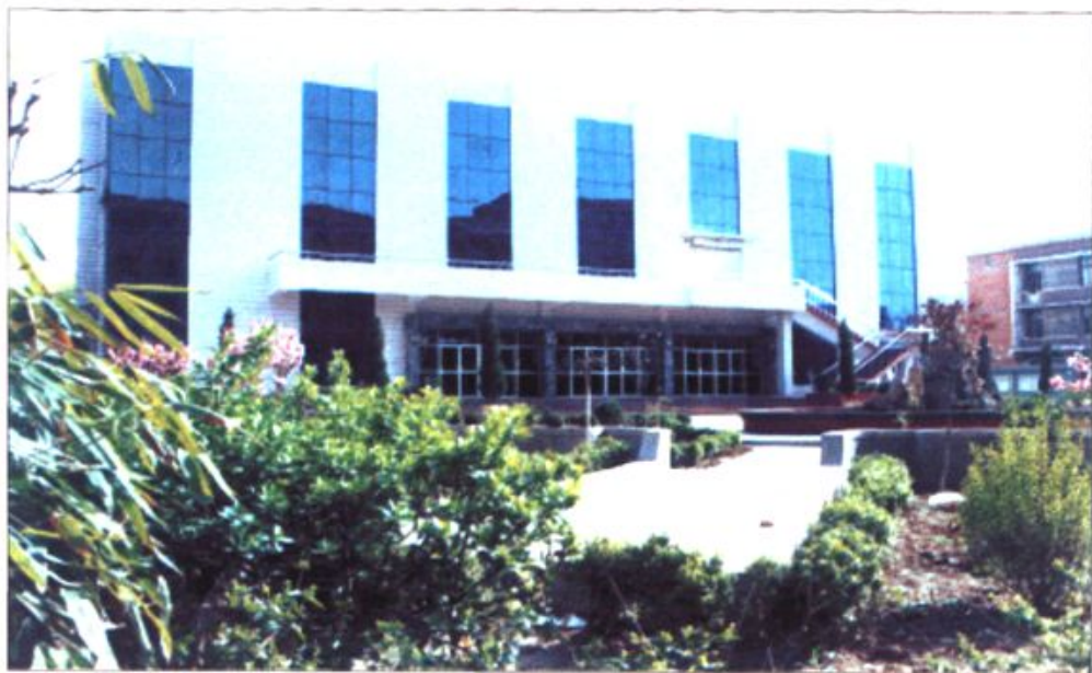
● 校园新貌之三——多功能礼堂餐厅