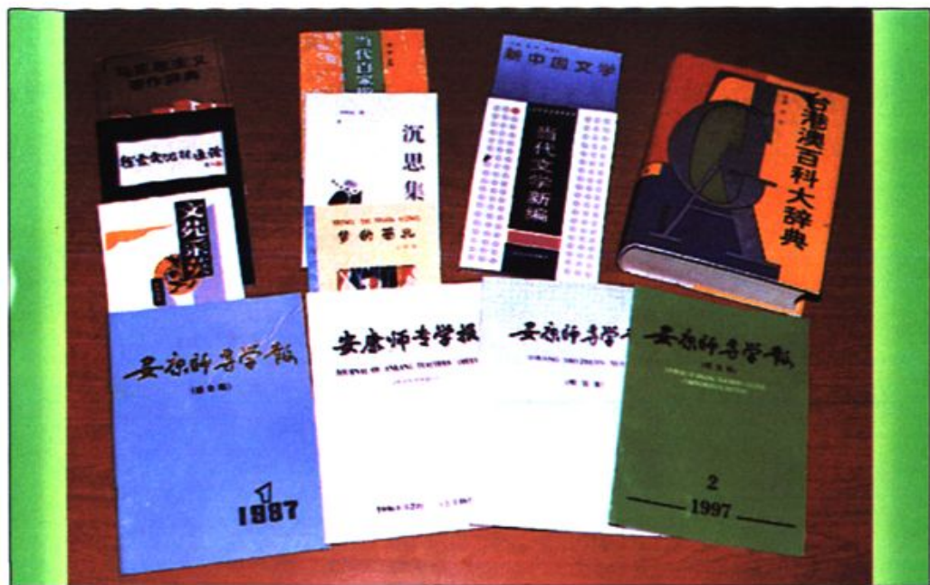
● 学校编辑的《安康师专学报》和本校教师出版的部分专著