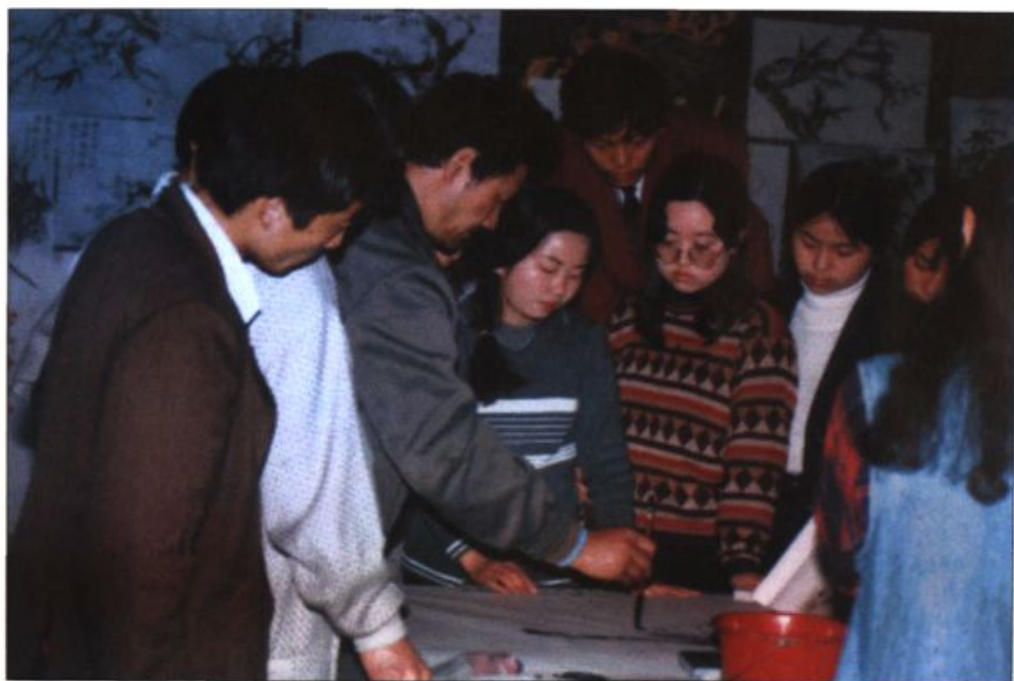
● 美术专业学生在上国画课