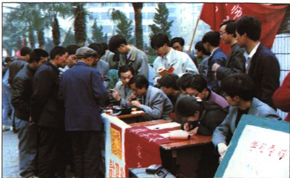
● 师生志愿者服务队为群众服务