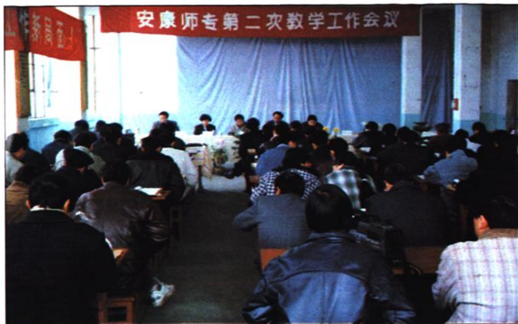
● 第二次教学工作会议 1997年12月