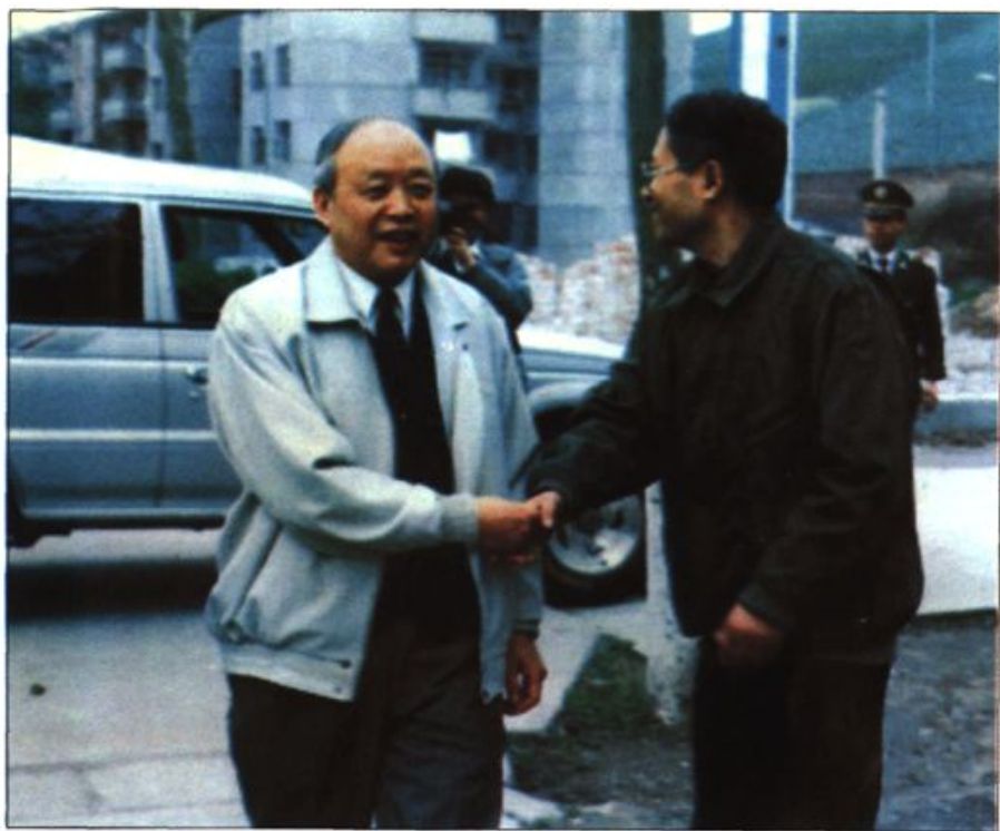
● 省人大常委会副主任徐山林视察我校