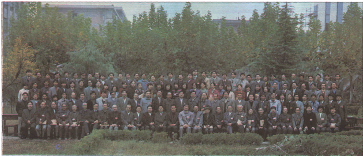
● 安康师专第一次党员大会合影 1995年11月