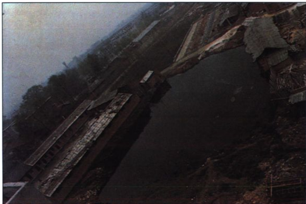
● 建校初期的场景（1985年）