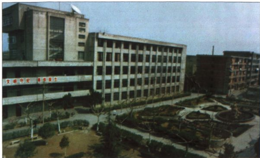
● 校园新貌之一——教学楼