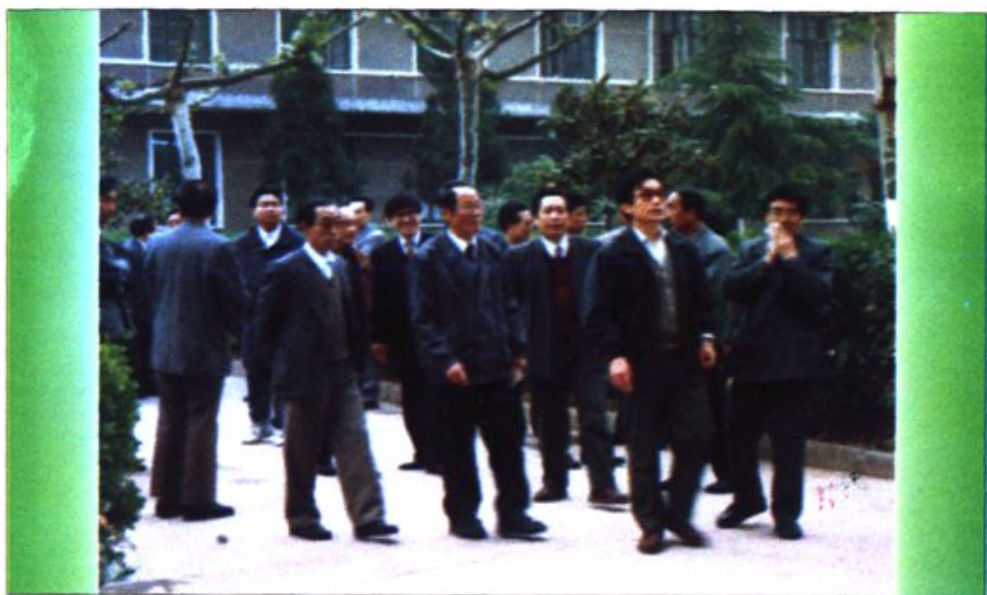
●副省长姜信真（右三）、省委教育工委书记、 省教委主任刘炳琦（右五）来我校视察工作