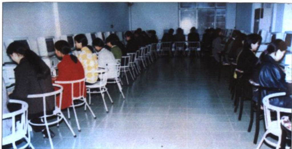
● 学生在上计算机操作课