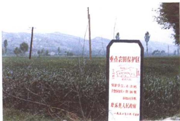
图为重点农田保护区