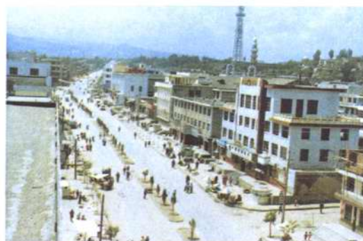
图为旧城改造后的和政县城