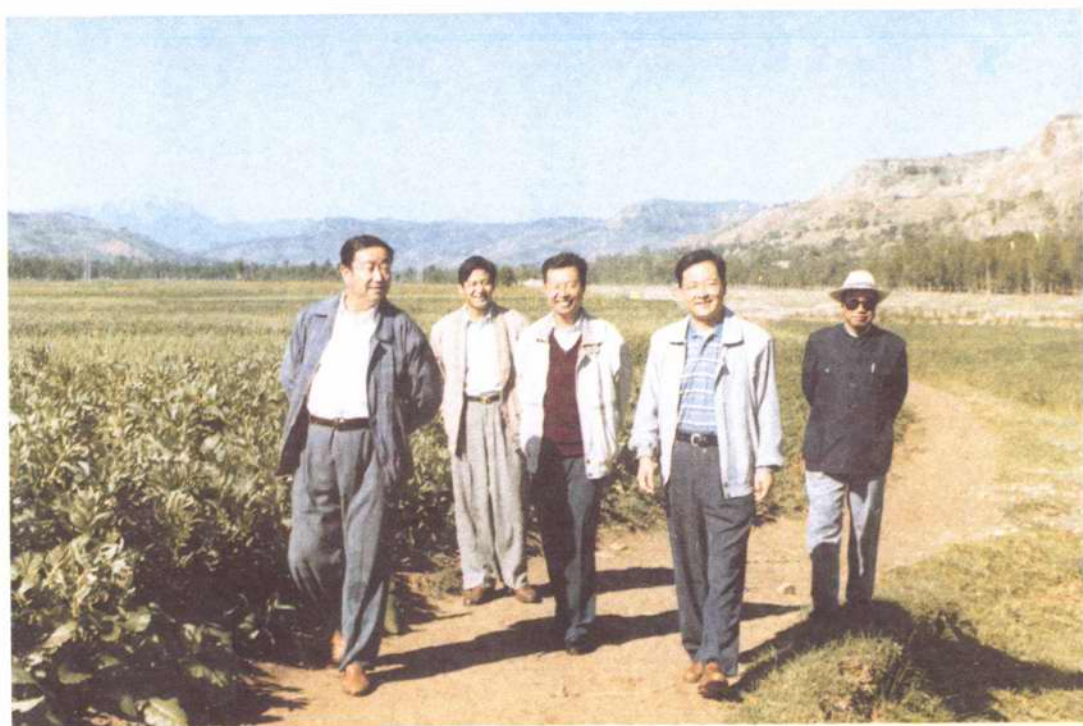
图为州政府马世德副州长实地检查指导工作