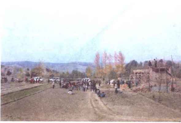
图为执法人员依法拆除重点农田的违建建筑