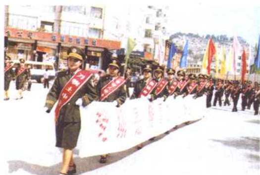
图为6·25“土地日”土地管理法宣传队伍