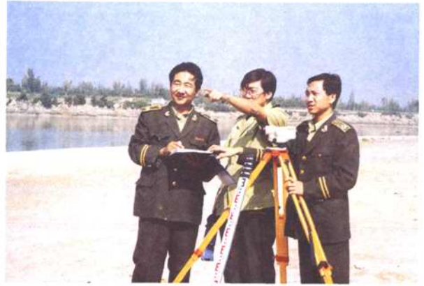
图为土管人员正在开展土地总体规划调查测量