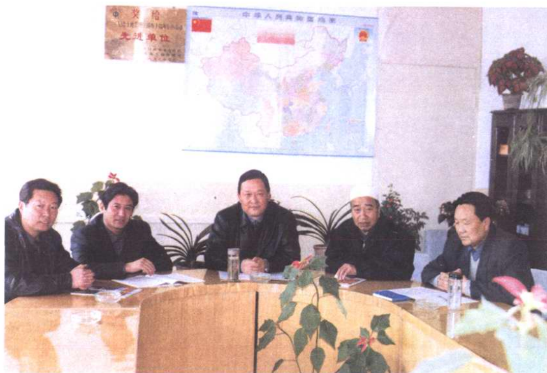
图为州土地管理局领导班子研究土地管理工作