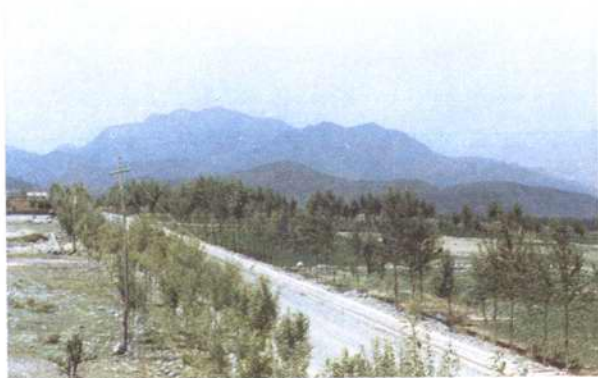
图为开发利用后的积石山干河滩