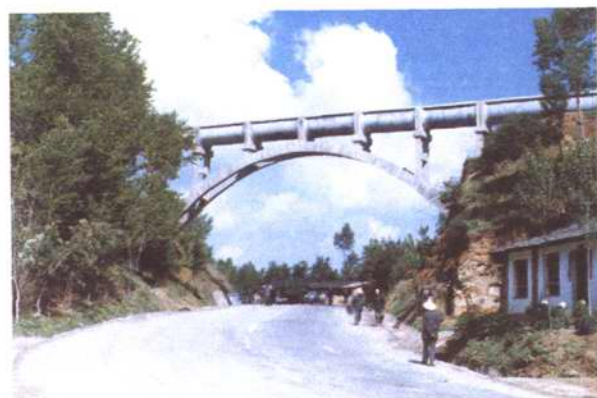
图为国家重点工程南阳山渡槽