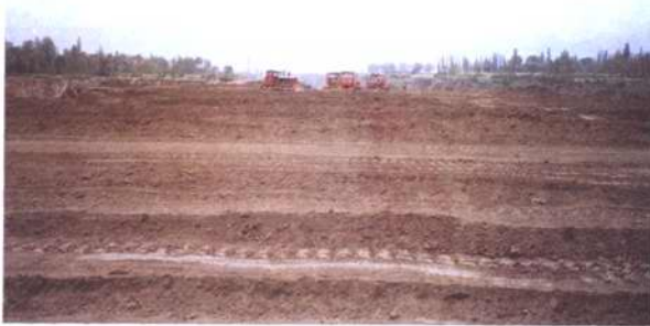
图为大搞土地开发现场