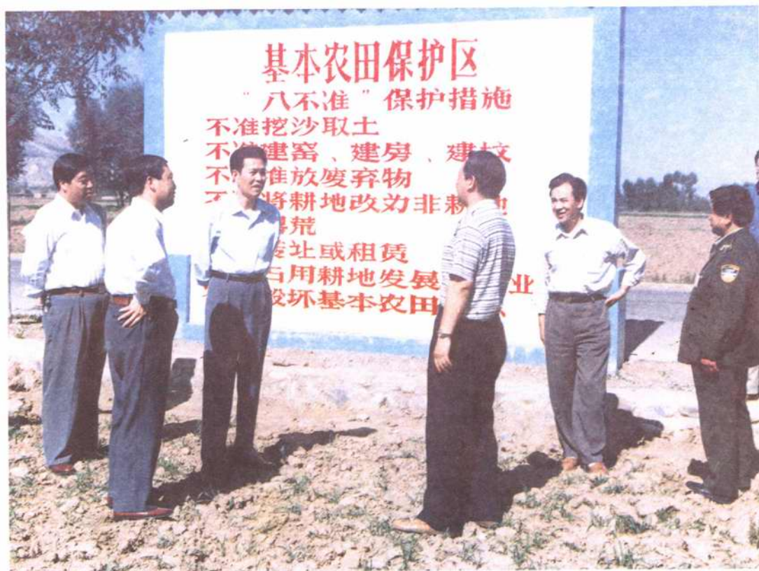
图为省国土资源厅党组书记来临现场检查指导工作（左三）