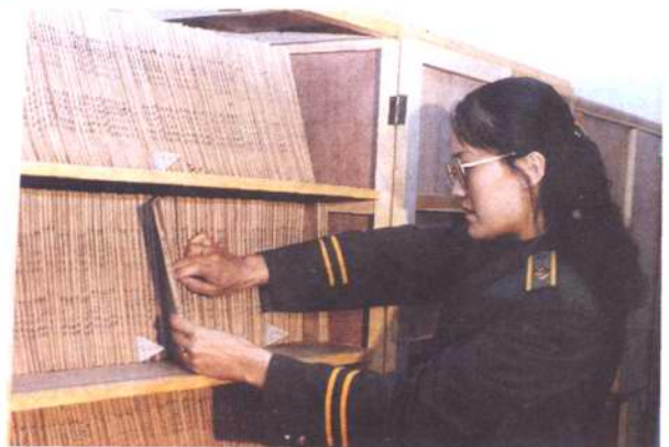
图为土地管理局地籍档案室一角