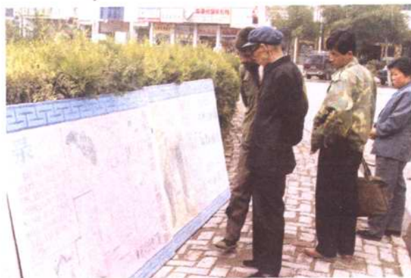
图为土地管理宣传咨询栏