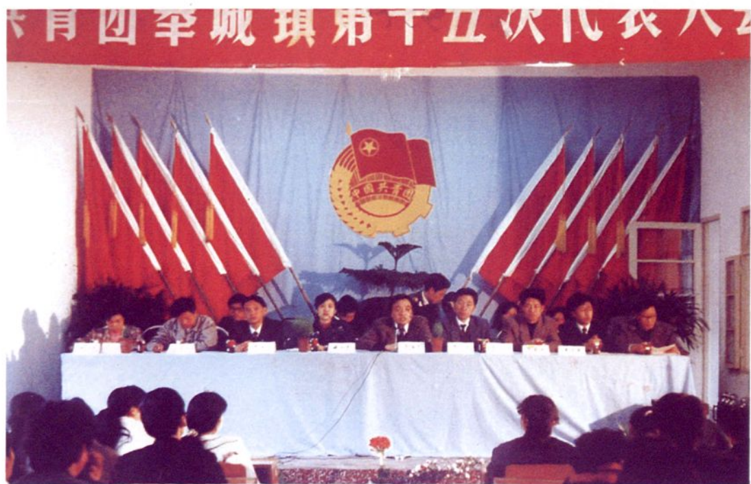
1992年4月8日，共青团奉城镇第十五次代表大会召开。