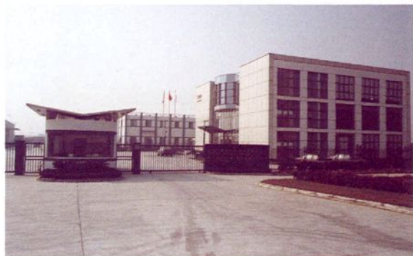
上海欣世箱包皮件制品有限公司