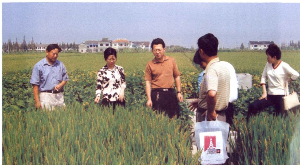
农技人员深入田头指导植保工作