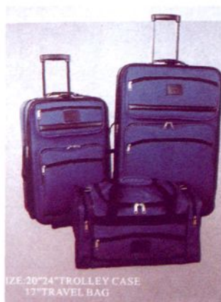
上海特吉丽皮具有限公司生产的产品