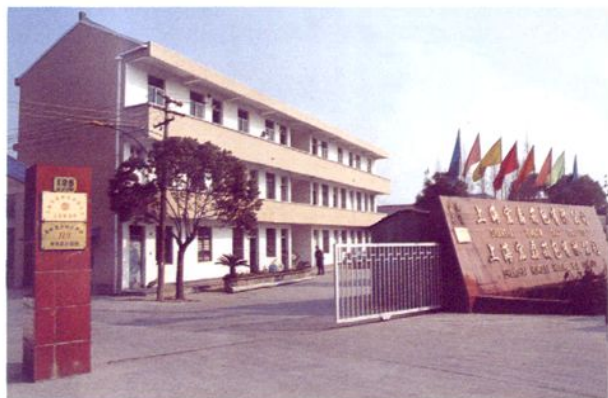
上海宏磊箱包有限公司