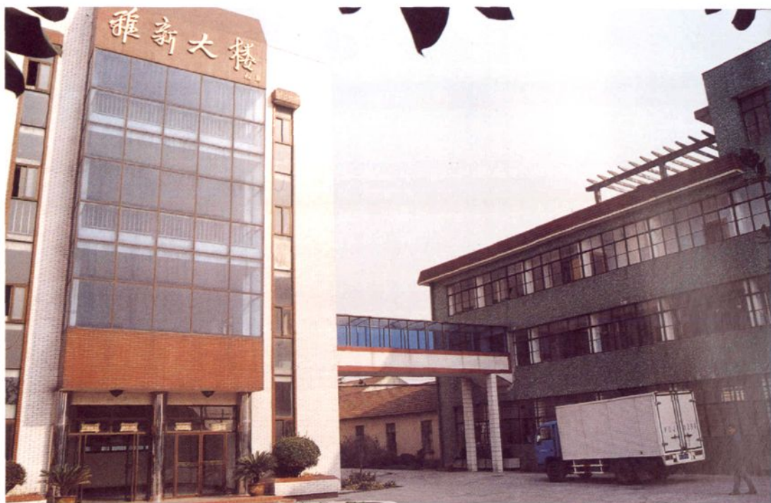
上海稚新制衣有限公司