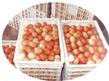
养鸡场一角和鸡蛋