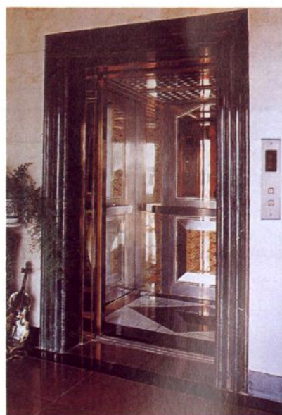
上海德圣米高电梯有限公司装饰的轿箱