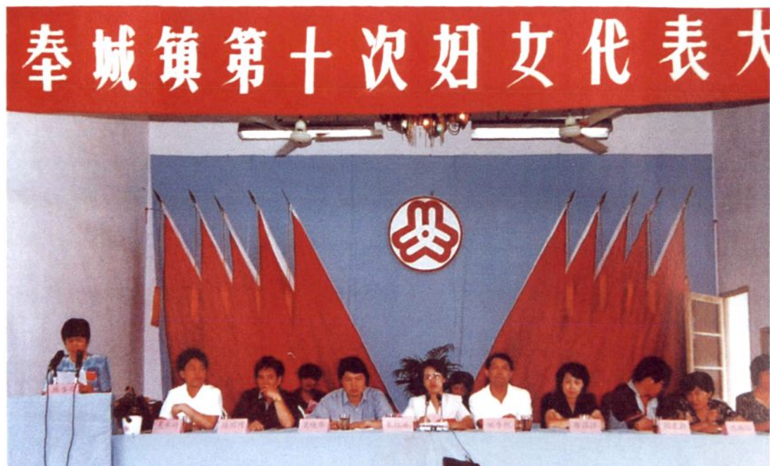
1999年8月12日，奉城镇第十次妇女代表大会召开。