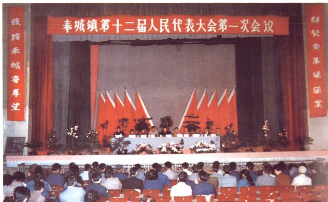
1990年3月27日，奉城镇第十二届人民代表大会第一次会议召开。