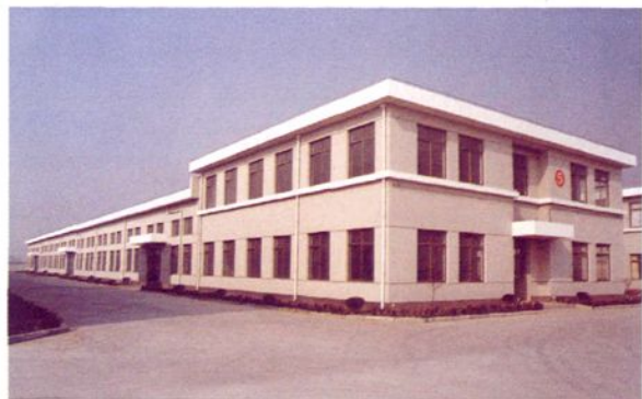
奉城镇高桥村的标准化厂房