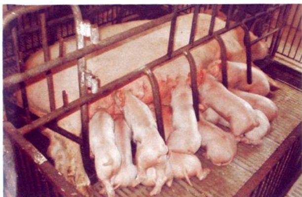
培育母猪，发展养猪