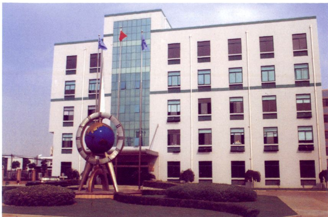
上海贤达压力容器制造有限公司