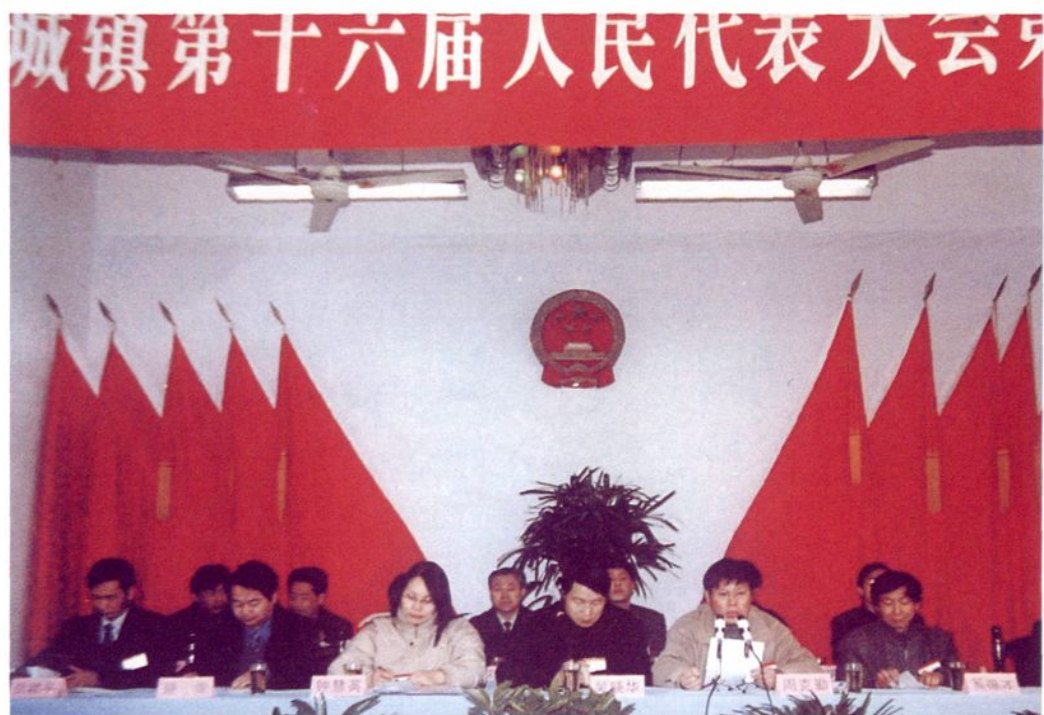
2002年1月31日，奉城镇第十六届人民代表大会第一次会议召开。