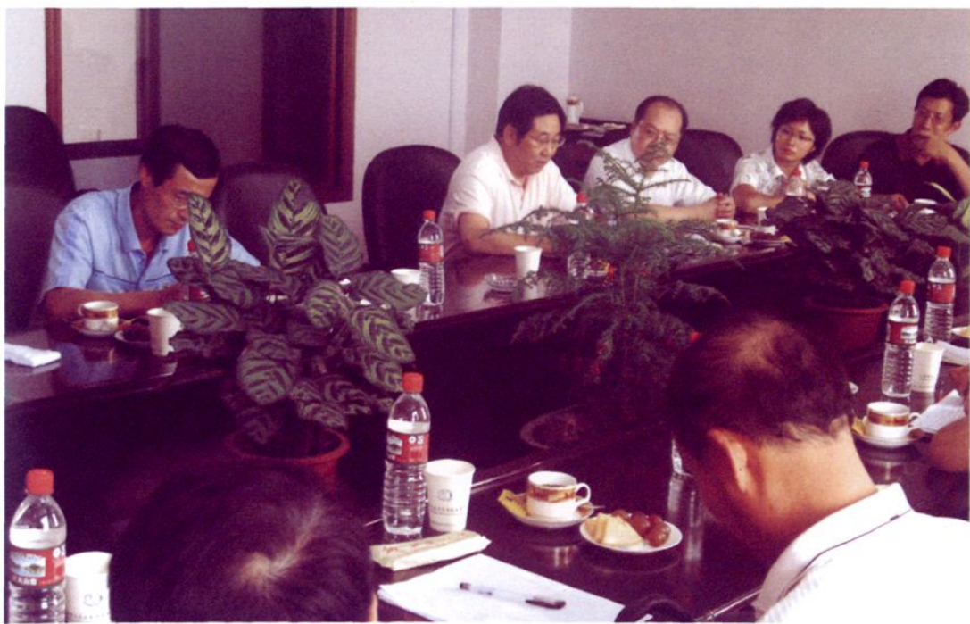
上海贤达压力容器制造有限公司召开党建工作会议