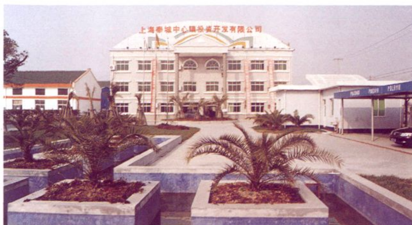
上海奉城中心镇投资开发有限公司