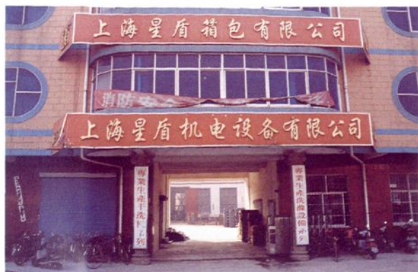
上海星盾箱包有限公司