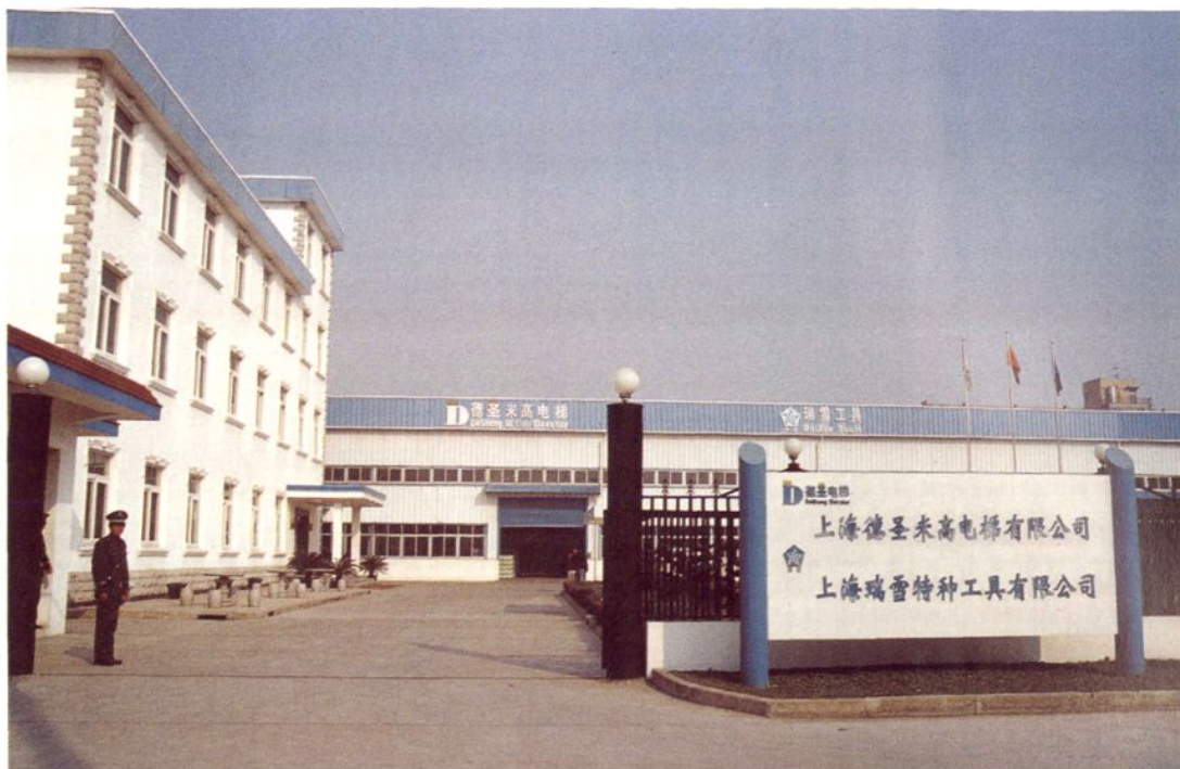
上海德圣米高电梯有限公司