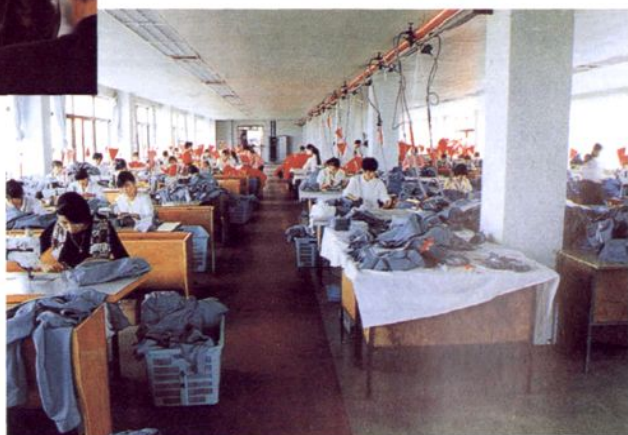
上海稚新制衣有限公司装有中央空 调的缝纫车间