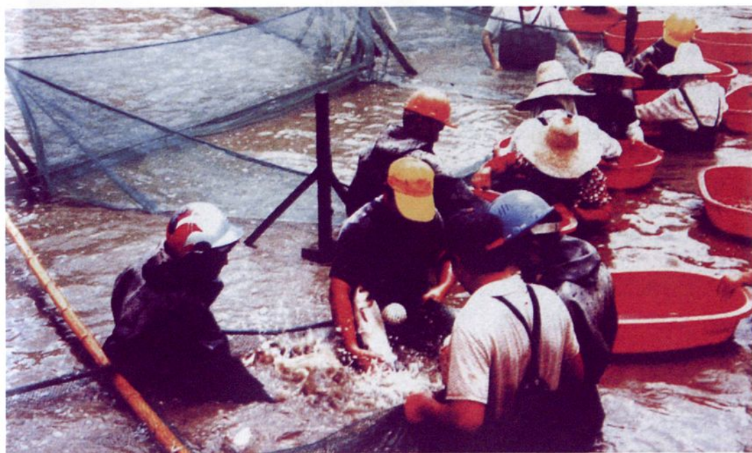
水产养殖户迎来丰收硕果