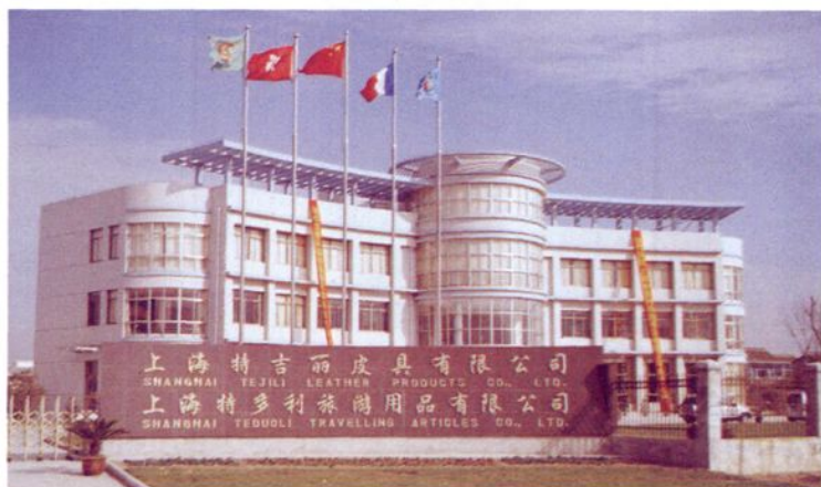
上海特吉丽（特斯曼）皮具有限公司