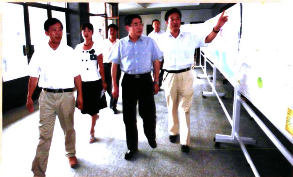
2007年7月，陕西省省长袁纯青（左四）来合考察沿黄旅游公路建设，中共合阳县委书记王民庆（右一），合阳县县长樊存弟（左一），县交通局局长张建平（左三）等作陪