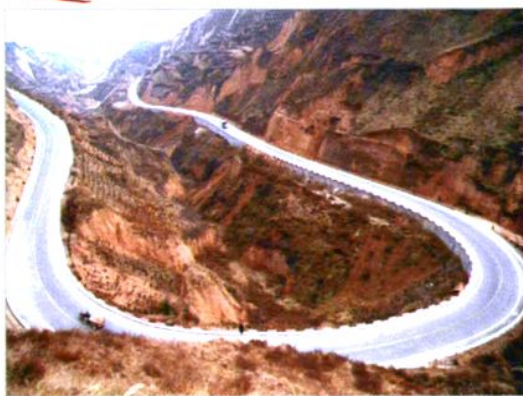
合洽公路洽川坡道