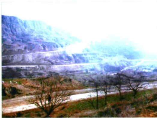
新华公路李家河段（徐水沟）