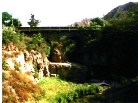
百坂沟古桥（建造年月无考）