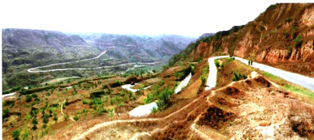
黑澄公路朴鲁沟（金水沟）坡道