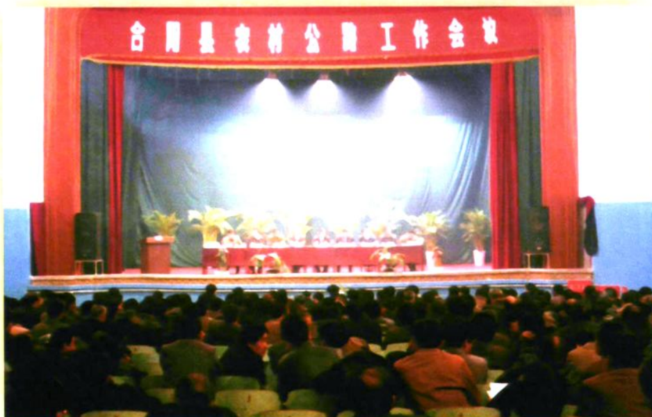
2006年2月召开的“合阳县农村公路工作会议”全景