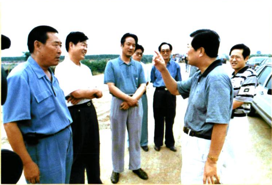
原中共渭南市委书记马中平（右二）在108国道合阳段二级公路改建现场指导工作。左一为原渭南公路总段段长王宏儒，左二为原中共合阳县委书记岳万民，左三为原合阳县县长件西居