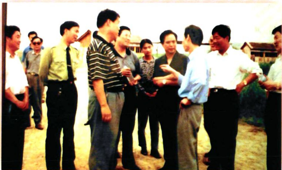
1998年6月3日，中共陕西省委书记李建国（右四），陕西省副省长王寿森（右三）在中共渭南市委书记王志伟（左四），渭南市市长马中平（左五），中共合阳县委书记岳万民（右二），洽川镇镇长张建平（左一）陪同下，视察洽川风景名胜区建设情况