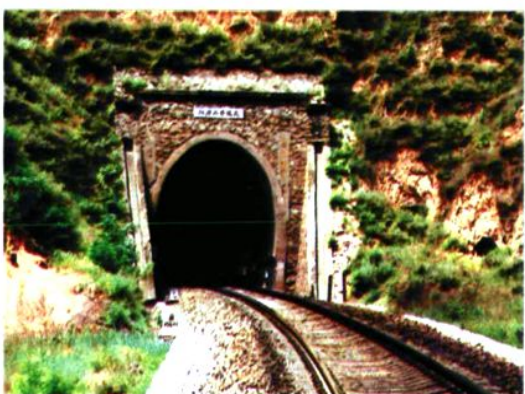
西韩铁路柏庙二号隧道