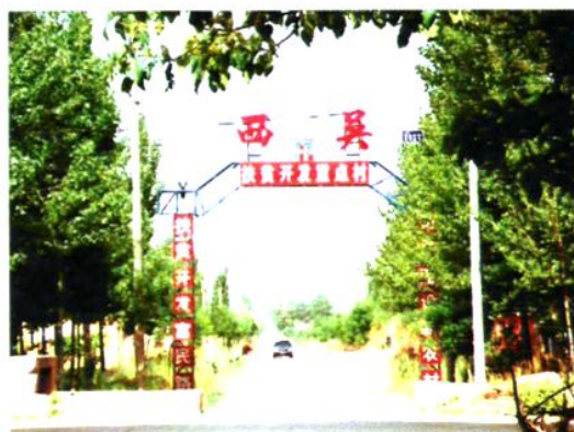
路井镇西吴村通村路