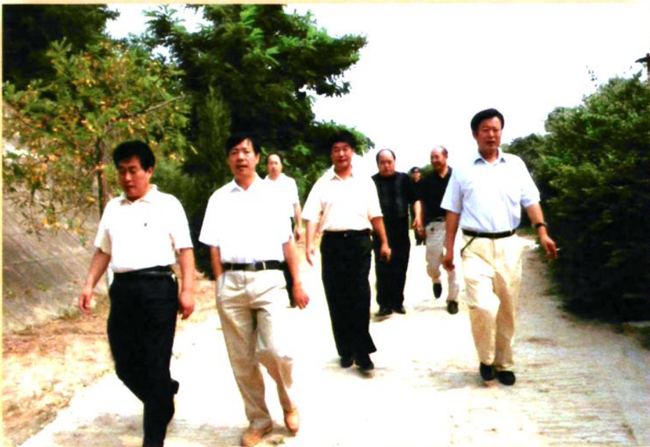
中共合阳县委书记王民庆（右一），合阳县县长樊存弟（左二）视察农村公路建设