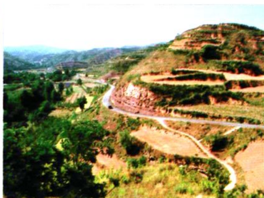
黄龙—王村公路皇甫庄北段