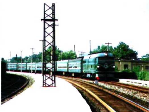
合阳站驶往省城的客运列车