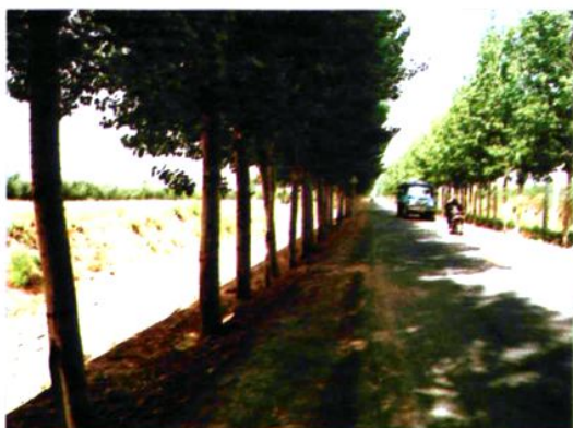
新池镇西王庄通村路