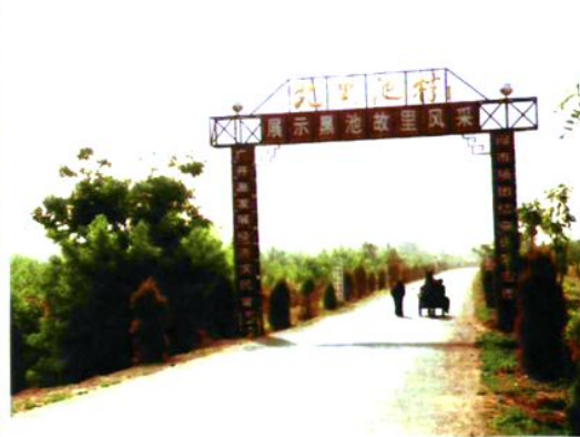
黑池镇北黑池村通村路