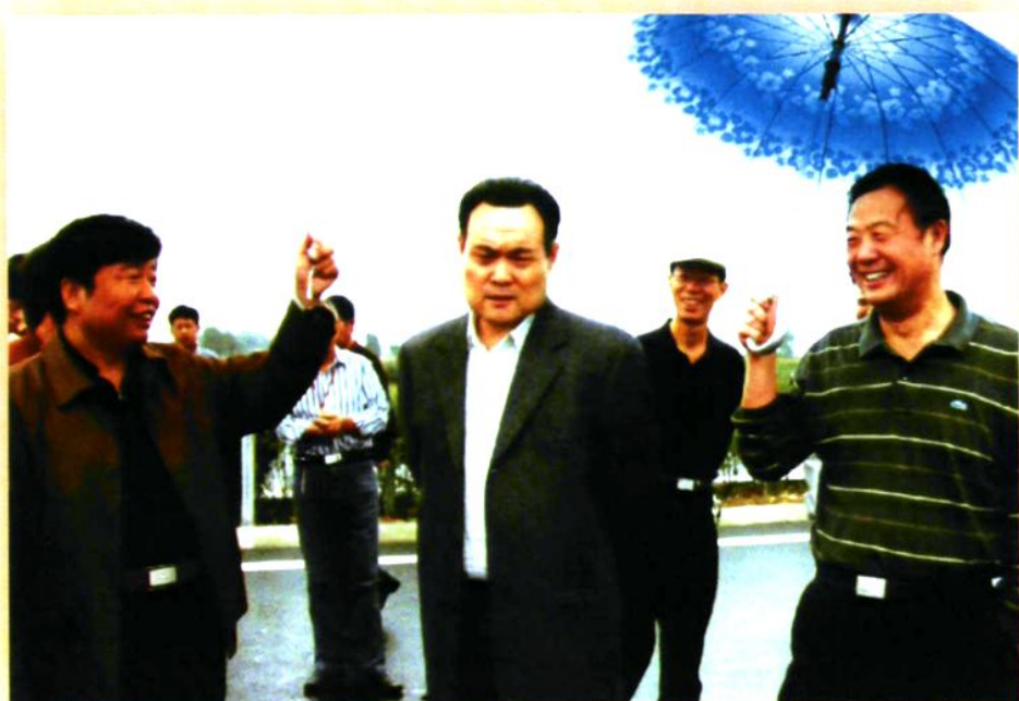
陕西省省交通厅厅长曹森（前中）冒雨视察禹阎高速公路建设合阳段工程