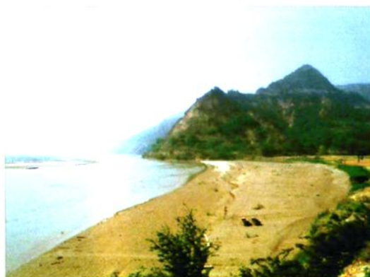
废弃的岔峪古渡（仁义渡）