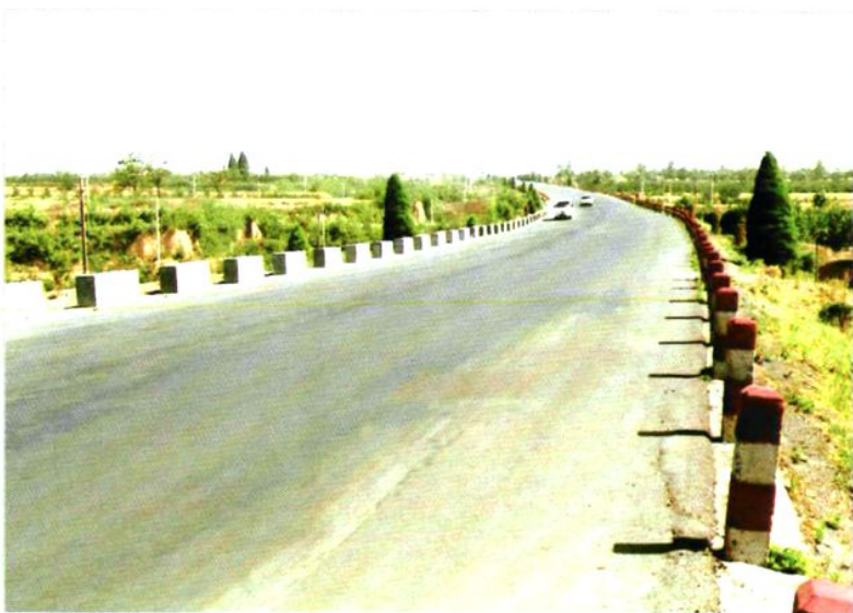
108国道合阳「十八坎」坡道