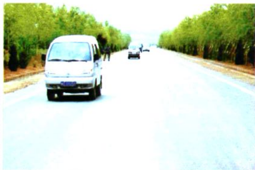
合阳—洽川二级公路