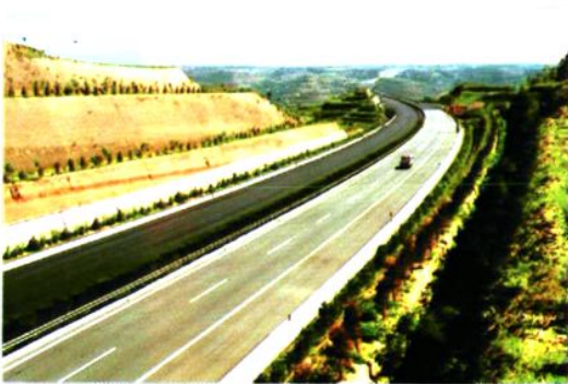
禹阎高速公路 (G40) 合阳北段