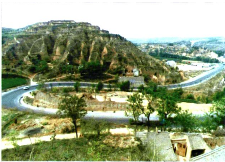
108国道合阳桥头河段