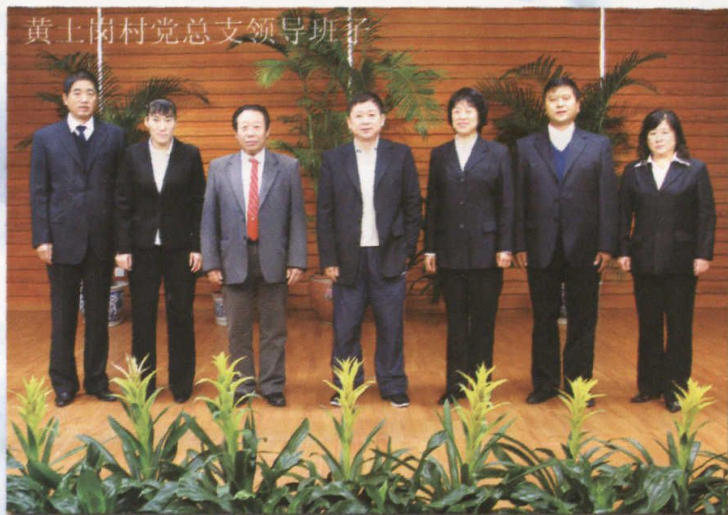
黄土岗村党总支领导班子