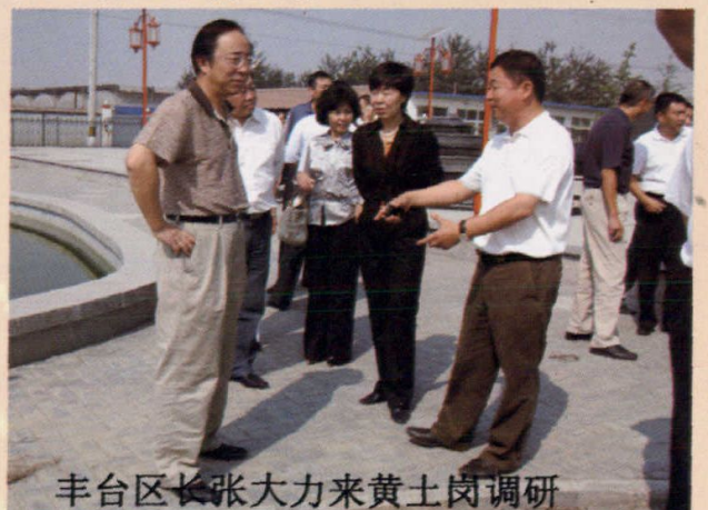
丰台区区长张大力来黄土岗调研