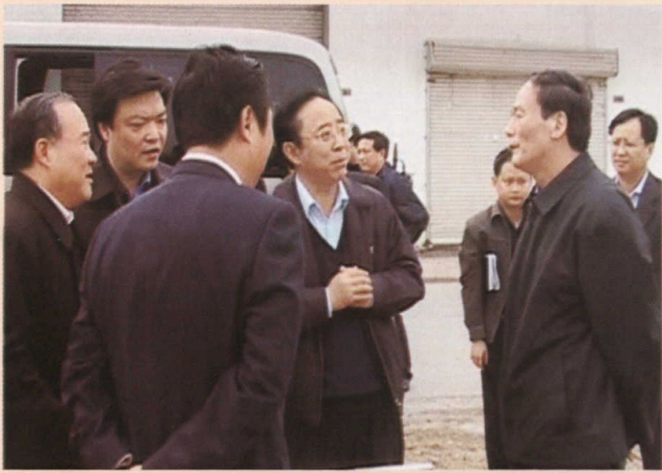
2006年3月，时任北京市市长王岐山来黄土岗视察拆除违章建设工作