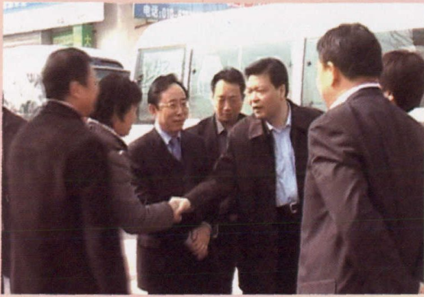
北京市副市长吉林、丰台区区长张大力来黄土岗调研