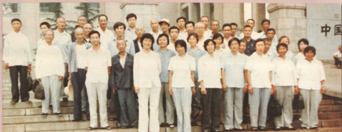
1987. 7. 1黄土岗村组织老党员老干部参观中国革命和中国历史博物馆