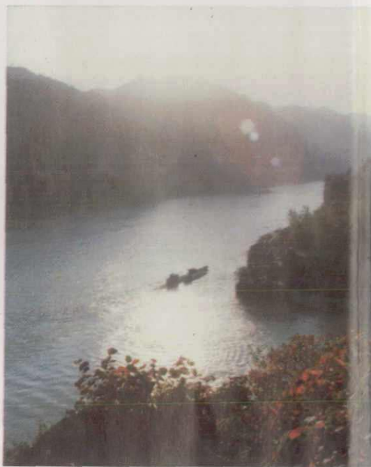
宜昌市长江西陵峡