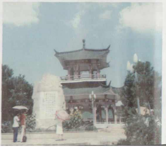
武汉市磨山风景区朱碑亭