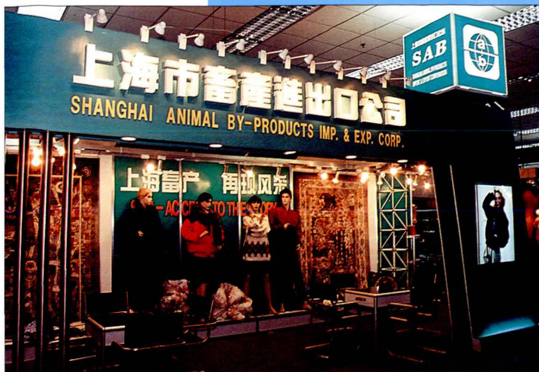
1995年3月，中国华东出口商品交易会上公司展台