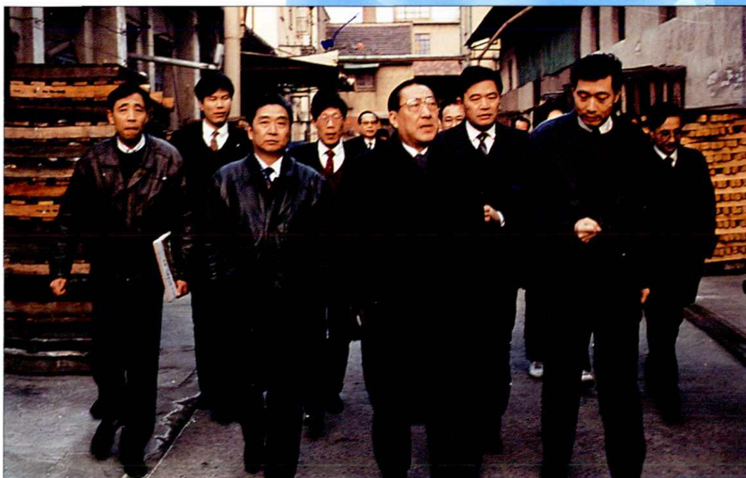
1992年2月20日，外经贸部部长李岚清（中）在市外经贸委副主任王祖康（左二）和公司总经理秦放（右一）陪同下视察上海肠衣厂