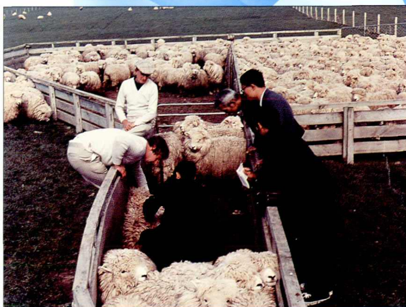
1980年，公司派小组在新西兰选购美利努绵羊进口