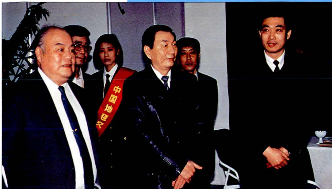
1991年2月24日，上海市市长朱镕基（中）在市外经贸委主任沈被章（左一）和公司总经理秦放（右一）陪同下视察第十七届中国地毯交易会