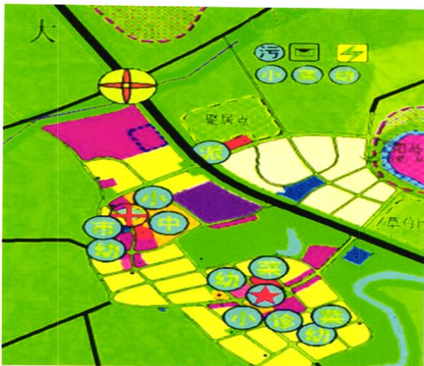
场镇建设用地规划图