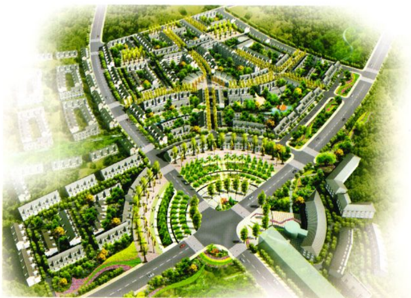
农民安置区鸟瞰图