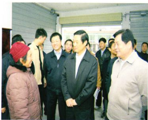
省委书记刘奇葆、省长蒋巨峰 视察我镇新农村建设