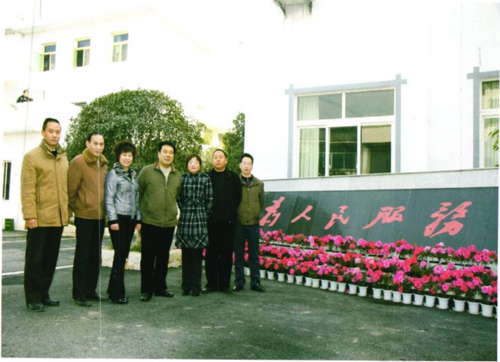
团结务实的兴隆镇领导班子