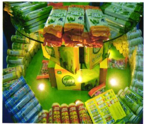
清香可口的仙绿宝食品