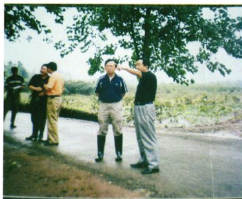
2005年7月县委书记谢瑞武到我镇 指导抗洪抢险工作