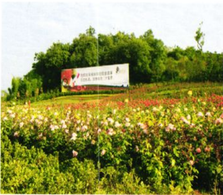
四季盛开的玫瑰花