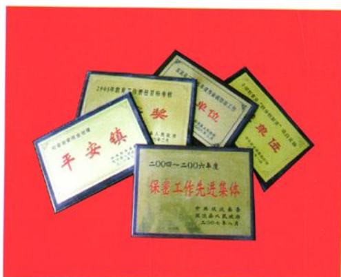
近年来我镇所荣获的部分奖牌