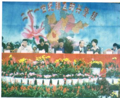
2001年9月县领导参加我镇撤乡建镇仪式