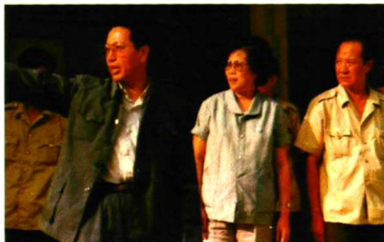
▲ 山西省公安厅副厅长黄环英(中)1989年来孟县公安局检查指导工作。