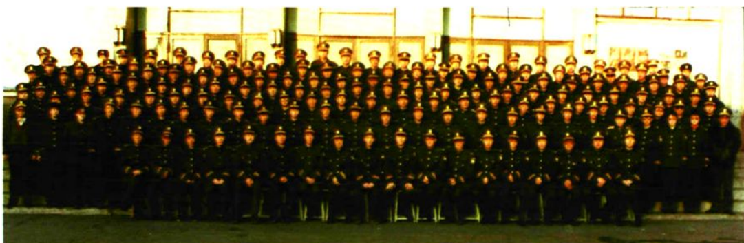
▲ 全体公安民警合影