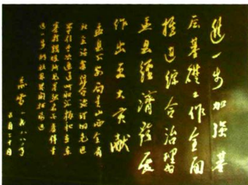
▲ 原公安部副部长俞雷题词