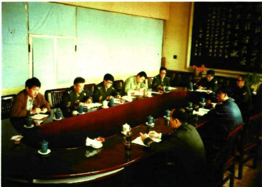
▲ 局党委在研究编撰《孟县公安志》