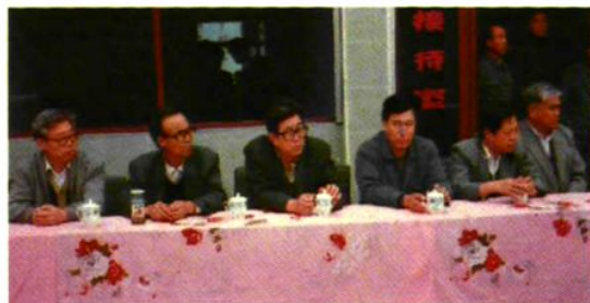
▲ 山西省公安厅副厅长张升东(右三)1995年来孟县公安局检查指导工作。