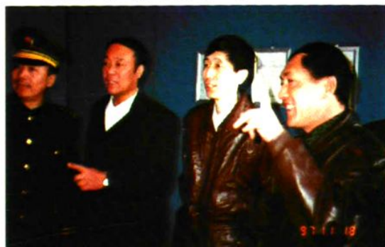
▲ 阳泉市政府、政法委、市公安局领导来孟县公安局考察工作。