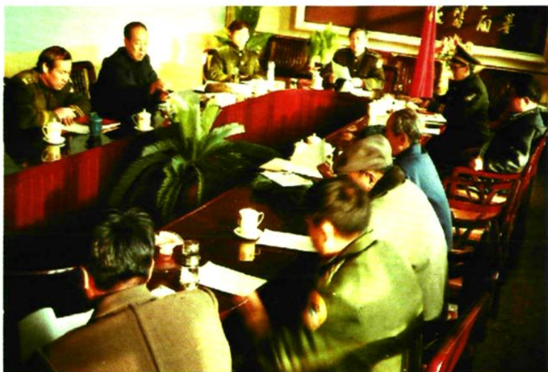
▲ 编委、顾问及工作人员在研究《孟县公安志》