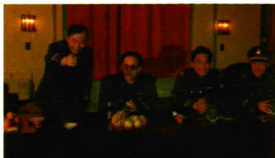
▲ 山西省公安厅副厅长丁松林(左二)来孟县公安局。