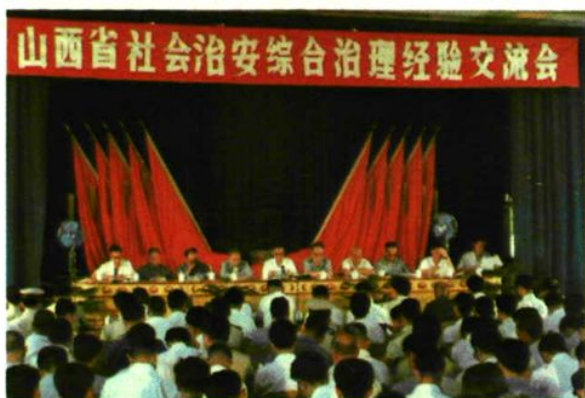
▲ 山西省社会治安综合治理经验交流会在孟县召开