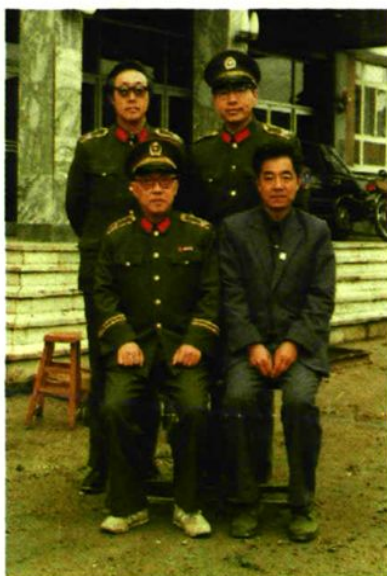
▲ 1988年公安部原副部长俞雷(前左)在山西省公安厅副厅长周耀祖(前右)、阳泉市公安局局长周子游(后左)在孟县视察工作。