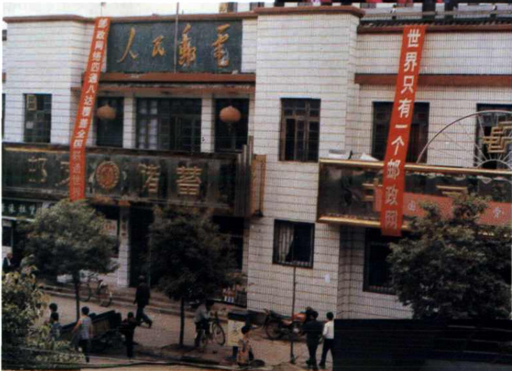
余干县邮电局邮政营业厅外貌