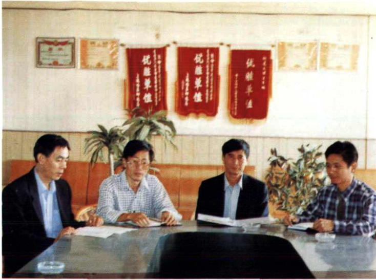
余干县邮电局现任局领导班子在研究部署工作