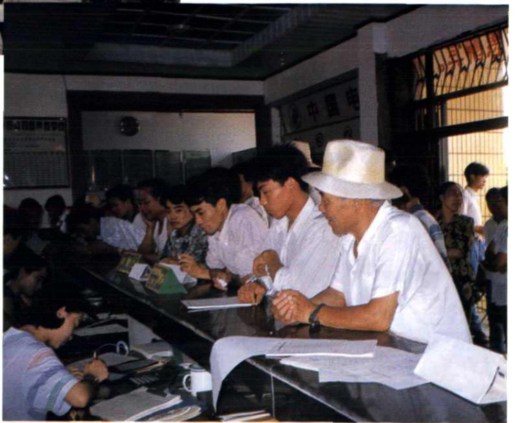
余干县邮电局电信营业厅一派繁忙工作景象