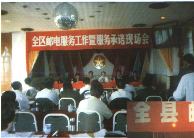
一九九七年四月，上饶地区邮电服务工作暨服务承诺现场会在余干邮电局召开。图为大会会场。