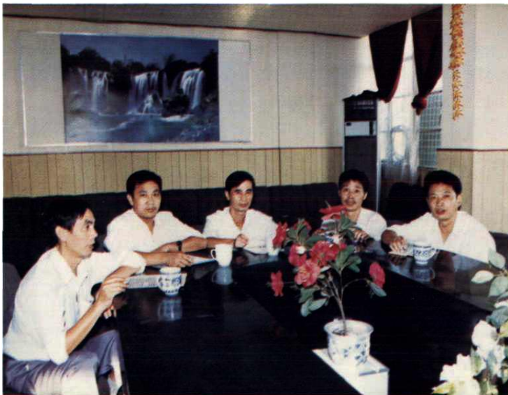
一九九五年余干局领导班子在研究部署工作