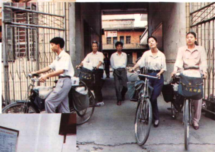
图为县局城投员们满载信报杂志，正离局开始一天投递服务。