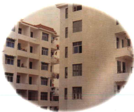
图为近年盖的家属宿舍楼群