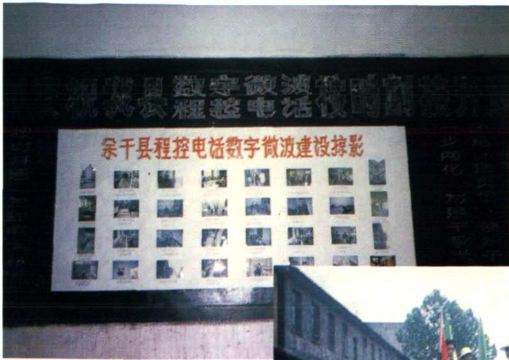
一九九三年十二月，余干县程控电话、数字微波按时割接开通。该局特出摄影专版、精配贺联，为庆典活动增景添彩。