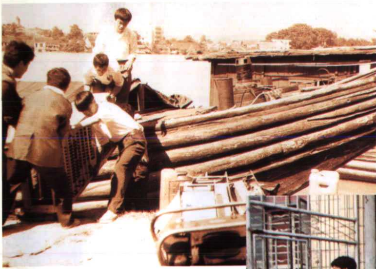
滔滔洪水，激发出干职们的忘我工作干劲。图为干职们不畏洪魔，乘木船装运设备至被淹支局使用，正手拉肩扛搬运设备下船。