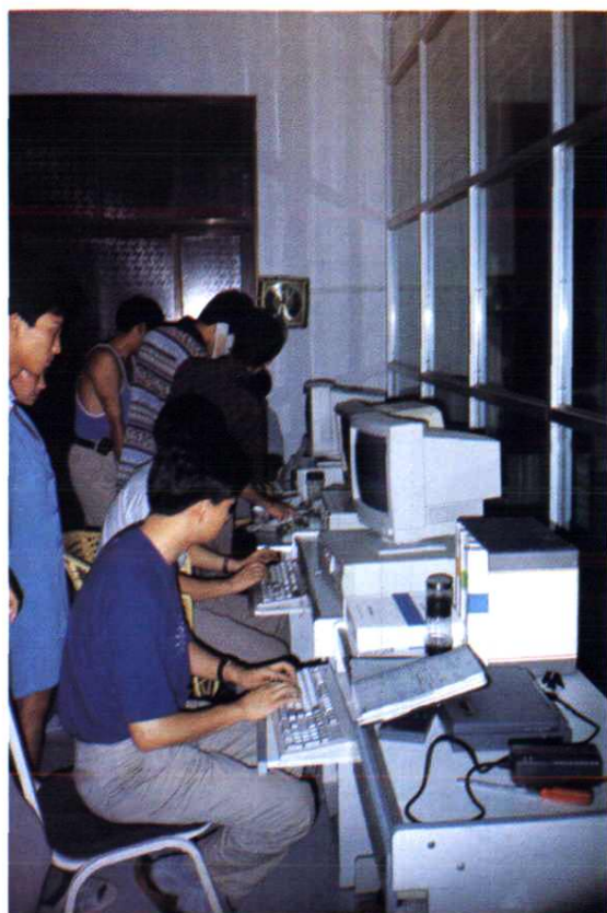
县局程控机房工程技术人员正在紧张调测