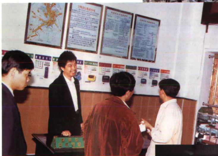
图为县局电信营业厅值班长正在热情回答用户的询问