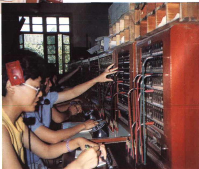
图为程控电话开通前，县局话房值班员忙碌工作的情景。