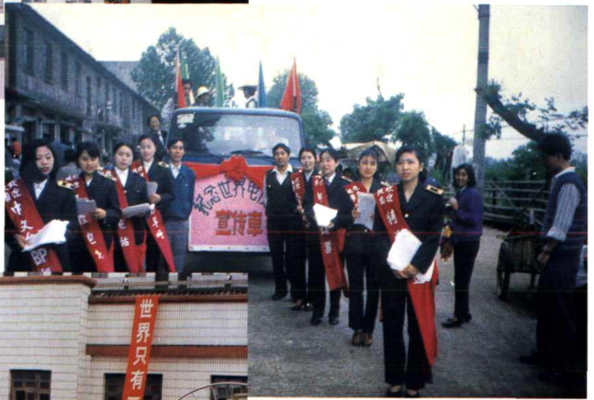
为庆祝、纪念世界电信日，组织各种宣传活动。图为宣传车、礼仪小姐在街上宣传，散发宣传单。