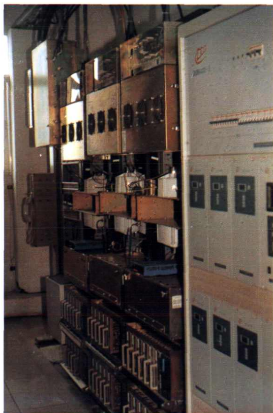
县局机房数字、模拟大哥大基站。