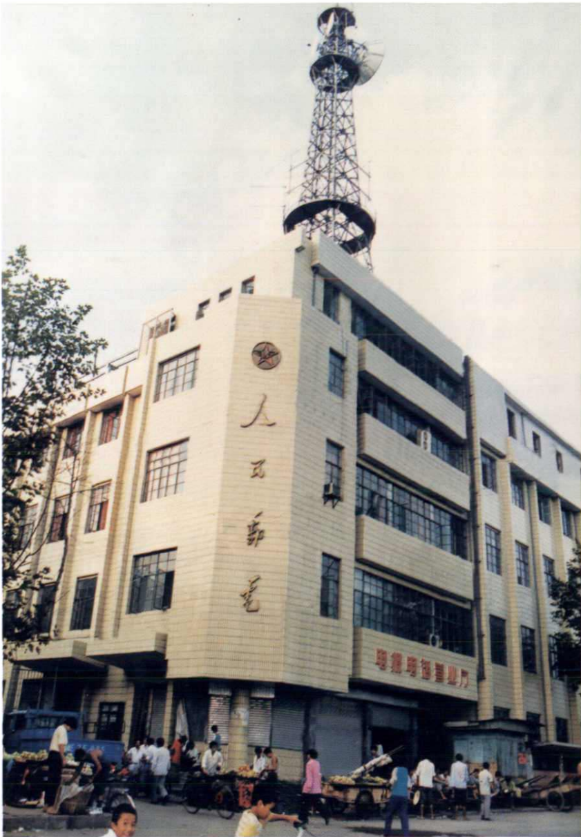
余干县邮电局外貌