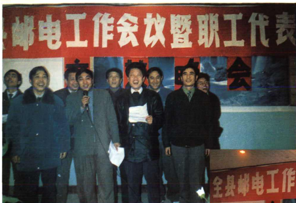
县邮电局领导和原任领导在局文艺晚会上放声高歌