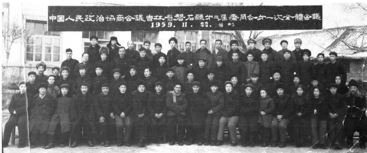
1959年11月22日，政协磐石县第二届委员会第一次会议，与会人员合影