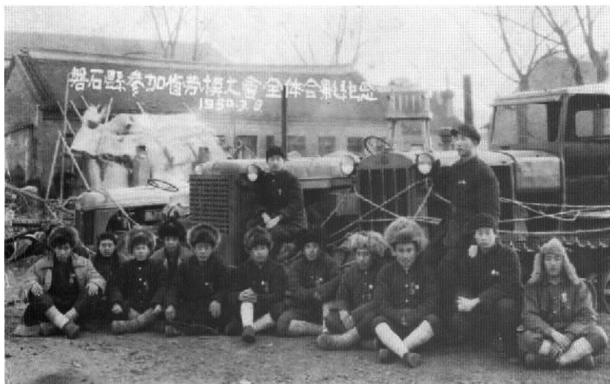
1950年3月8日，磐石县参加省劳模大会全体劳模合影