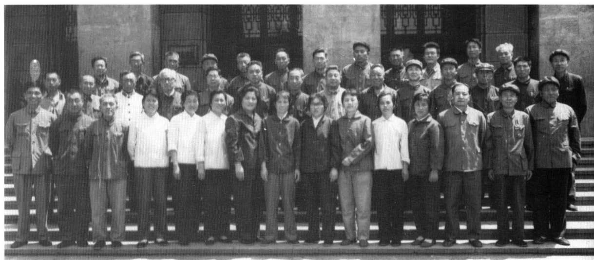
解放战争期间，在磐石工作过的部分同志合影