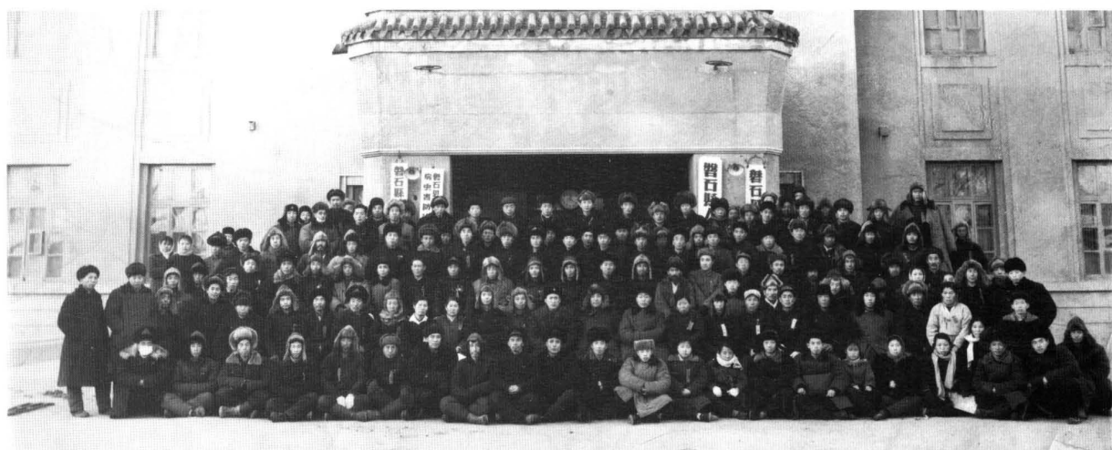
1960年1月23日，磐石县第三次烈军属和残疾、复员、退伍、转业军人代表会议，与会人员合影