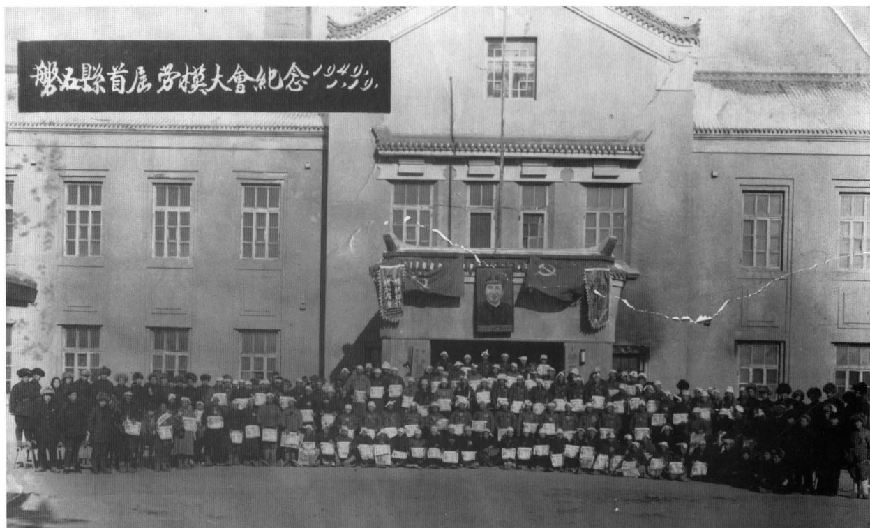
1949年1月19日，磐石縣首屆勞模大會，與會人員合影