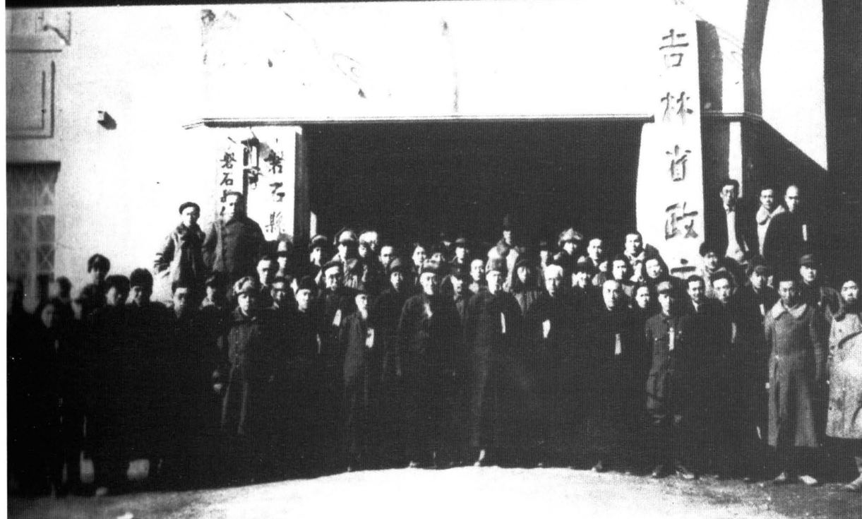
1946年4月9日，吉林省臨時參議會在磐石召開，與會代表全體合影