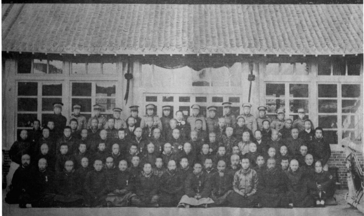
1912年，吉林磐石縣各界慶祝第一世正式大總統合影留念