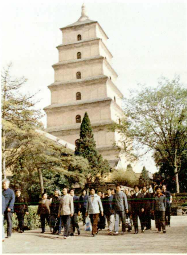
退休职工游览大雁塔