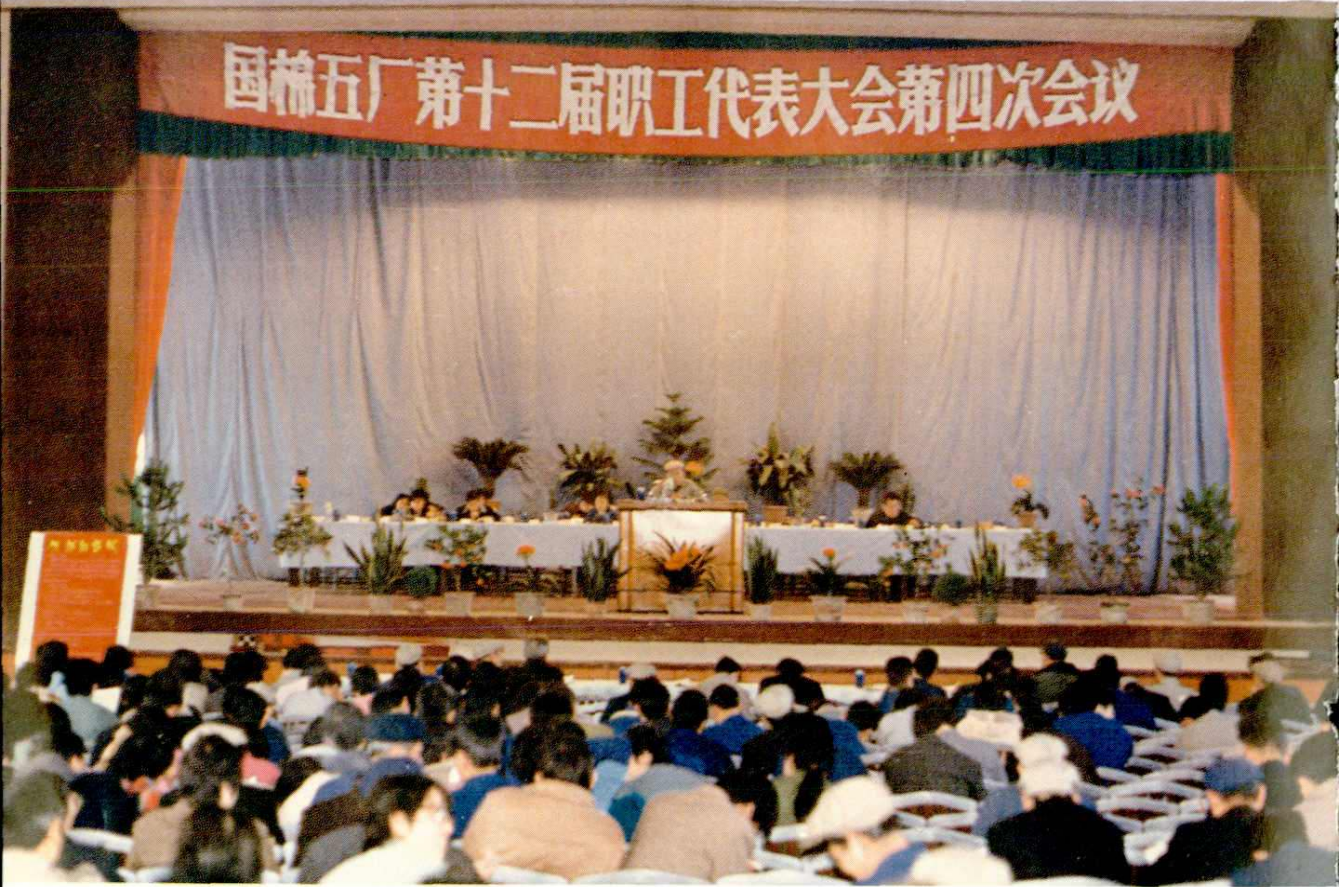
第十二届第四次职代会会场