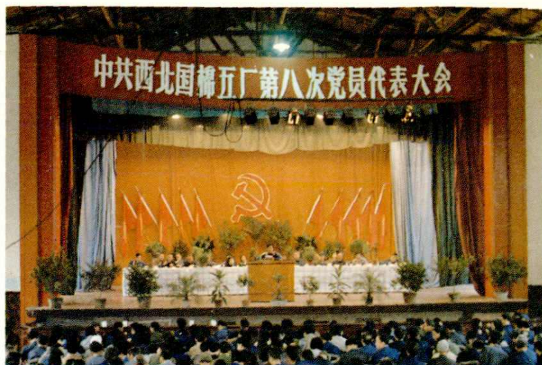
第八次党代会会场