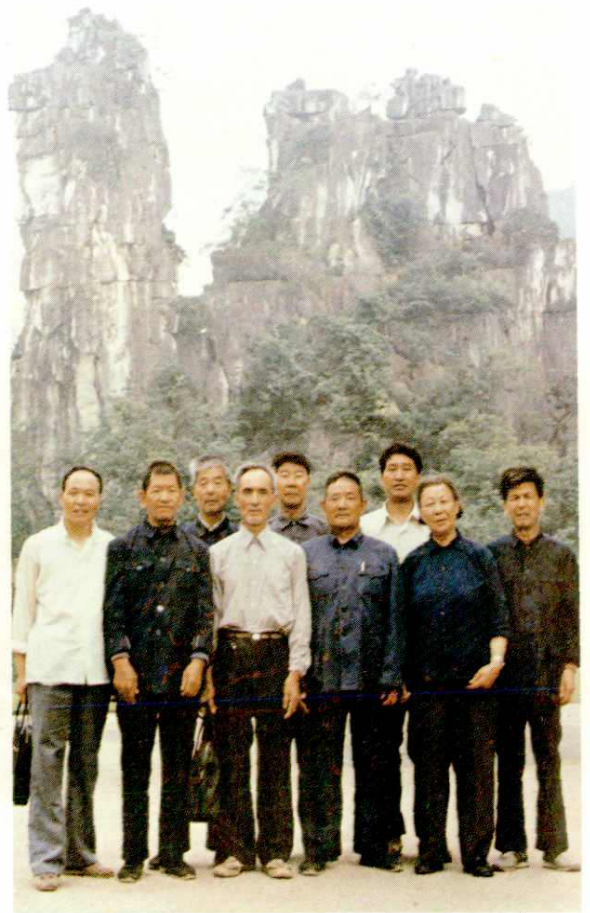
离休干部游览桂林