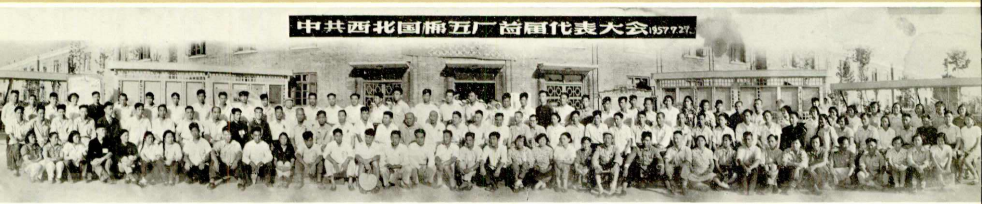
第一次党代会全体代表合影