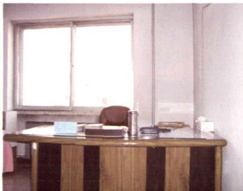
副 会 长 办 公 室