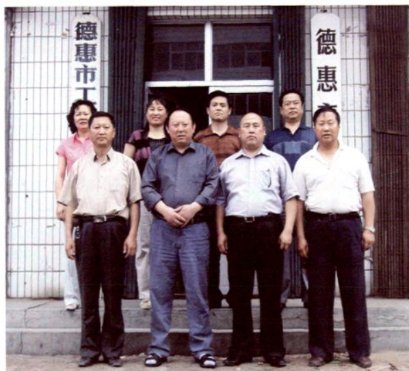
工商联机关全体干部合影