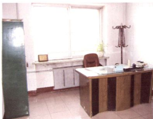
党 组 书 记 办 公 室