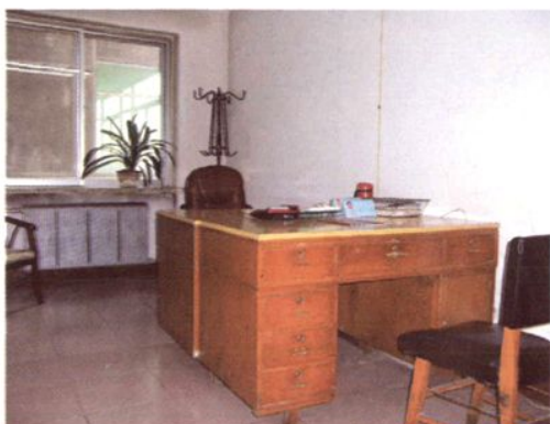
行 政 办 公 室