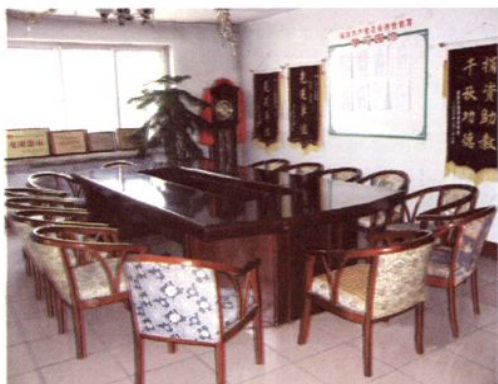
会 议 室