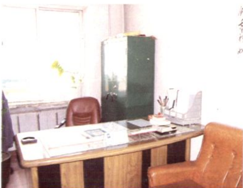
秘 书 长 办 公 室