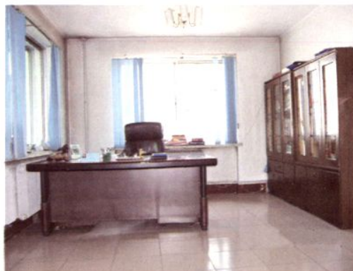
会 长 办 公 室