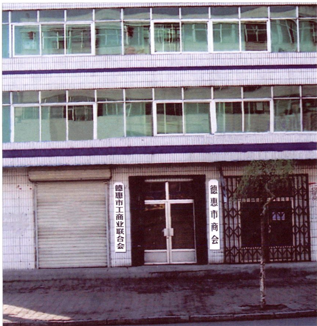
工商联办公楼座落在育才街（东九道街）