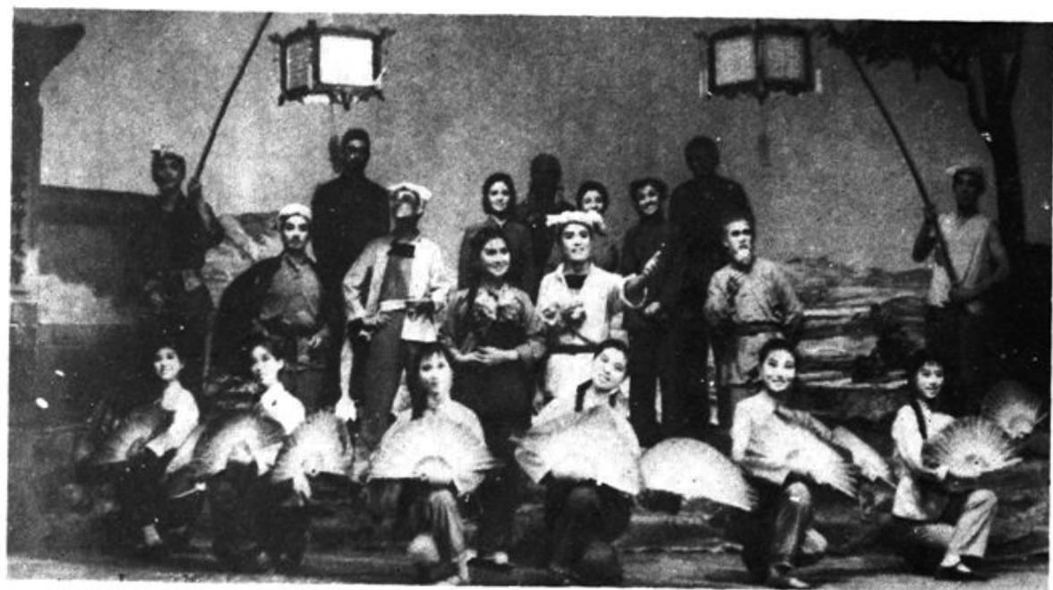
文工团演出的歌剧《小二黑结婚》