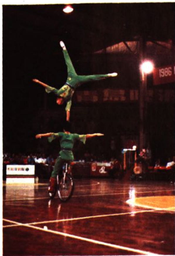
← 杂技团姐妹表演的双车 双人踢碗