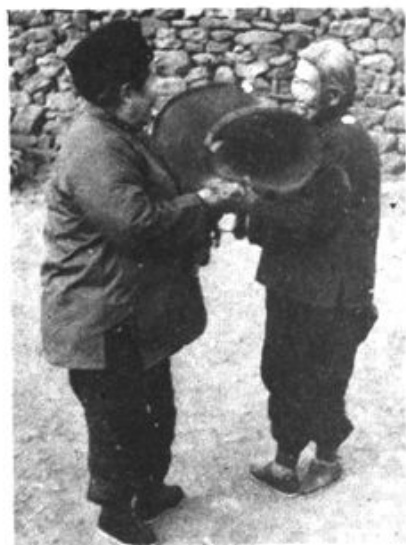
锦县大碾乡老大娘的太平鼓表演