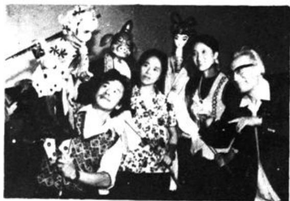
木偶剧团部分演员