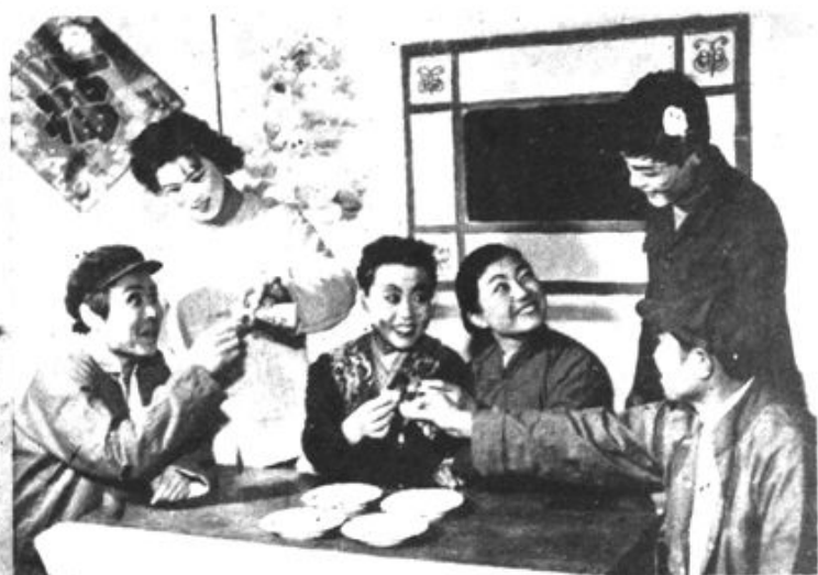
锦县余积公社半农半艺剧团，自己创作的《两家乐》，一年间为社员表演60多场，深受群众欢迎。