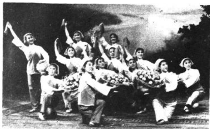
文工团演出的舞蹈《在果园里》