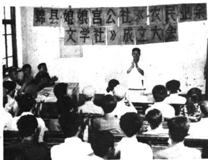
锦县“娘娘宫农民业余文学社”成立大会会场