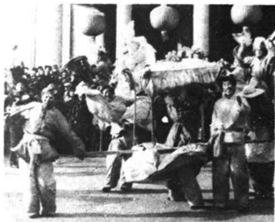
古塔区建筑公司秧歌队表演的 《早船》