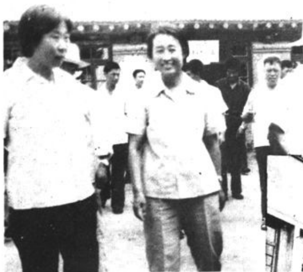
← 市领导参观兴城市羊安乡 柳蒿村文化室