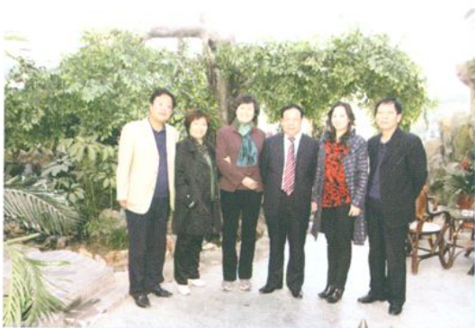
甘肃省非税局领导在榆中县调研