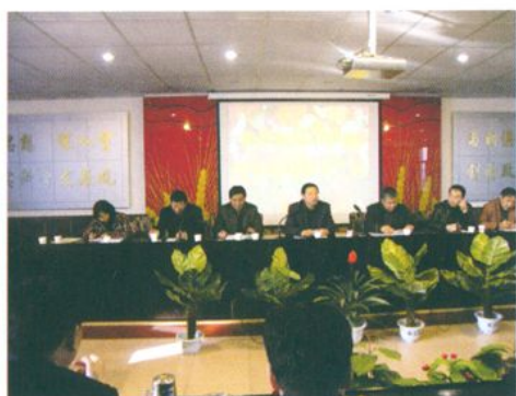
县上领导考核2008年财政工作