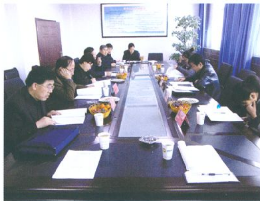
中央驻甘肃专员办调研 榆中县社保资金使用情况