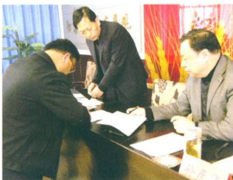
财政局领导与各股室签订目标责任书