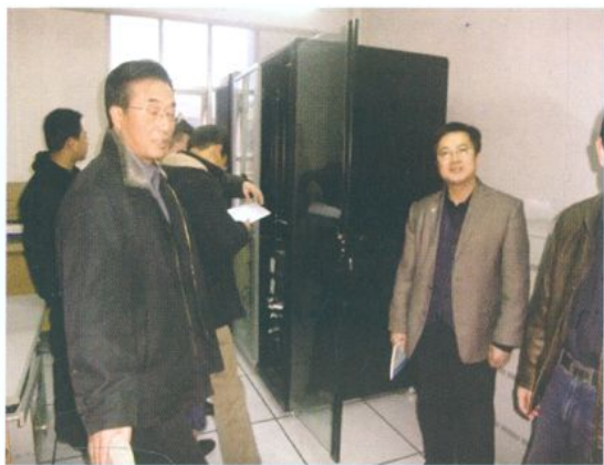
省财政厅国库处检查 榆中县国库集中支付系统建设