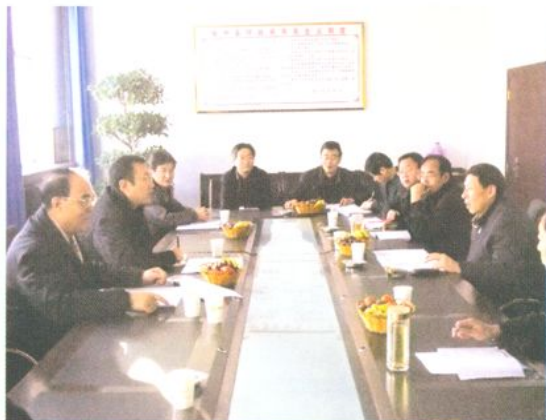
中央驻甘肃专员办检查 榆中县扩大内需资金使用情况