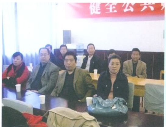
市财政局领导检查培训工作