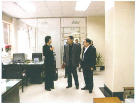
省文明办检查财政局 省级文明单位创建工作