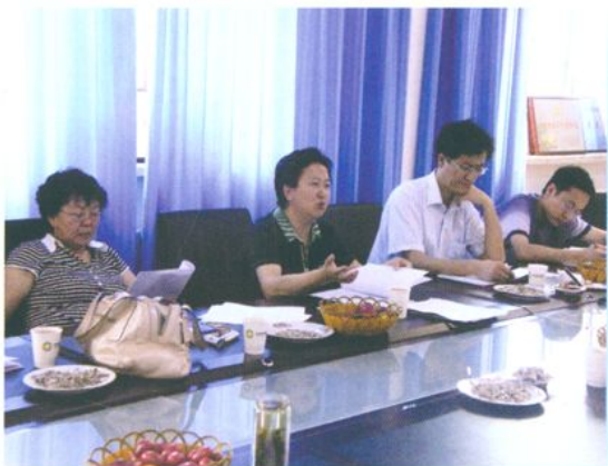
省市财政部门检查榆中县财政工作