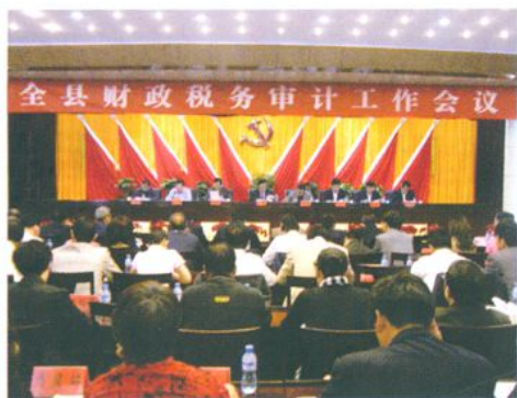
2011年榆中县财税工作会议