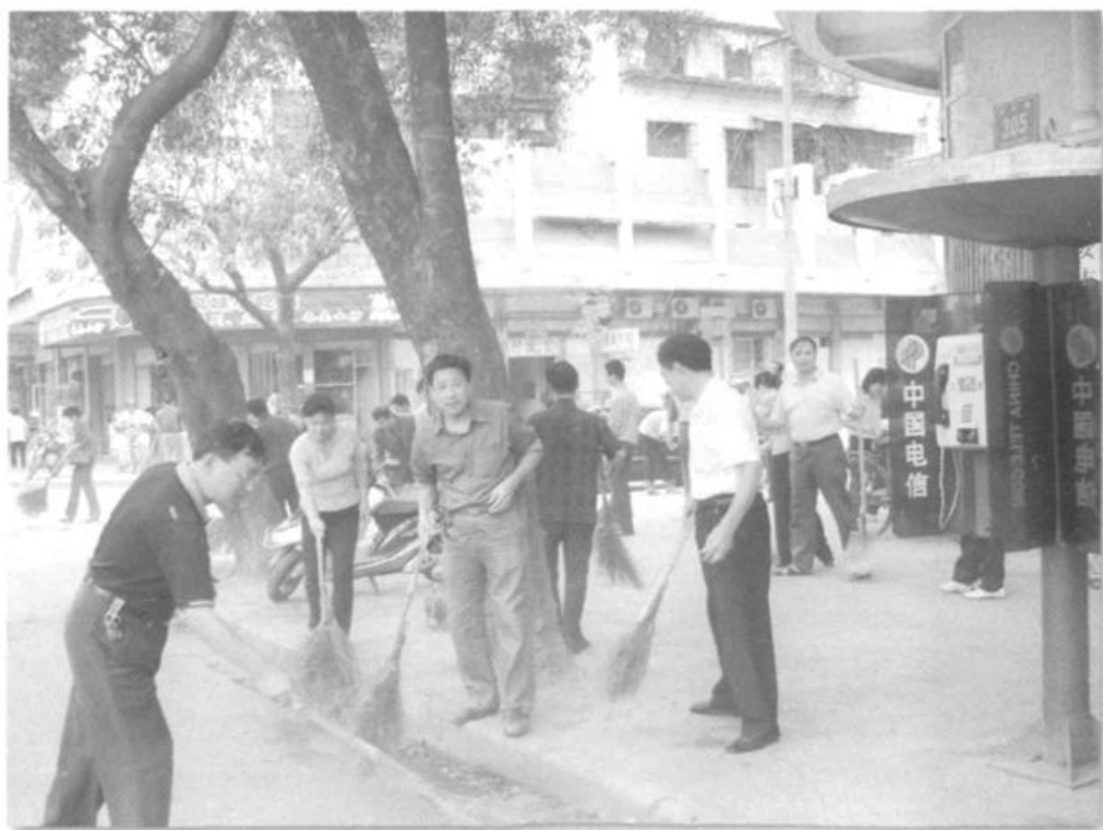
●参与创建文明城市义务劳动