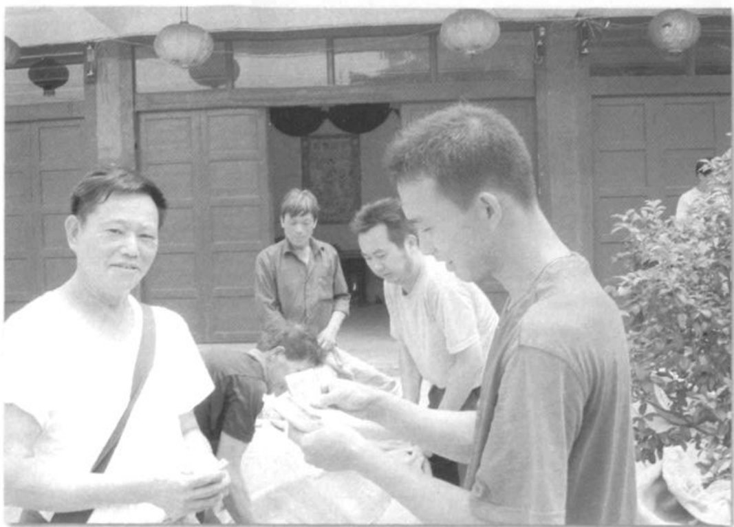
●为国储粮，开展订单粮食收购