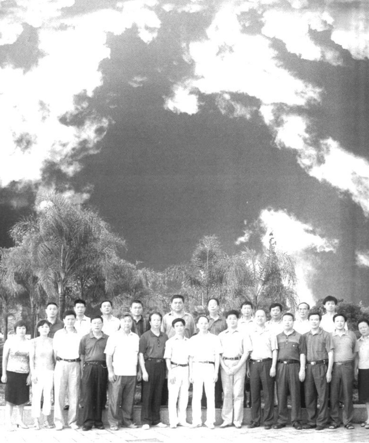
●2007年7月市粮食局全体同志与《永安市粮食志》编辑人员合影