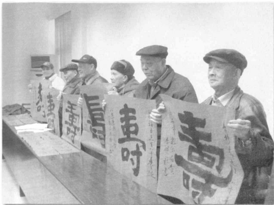
●为高龄离退休老同志祝寿