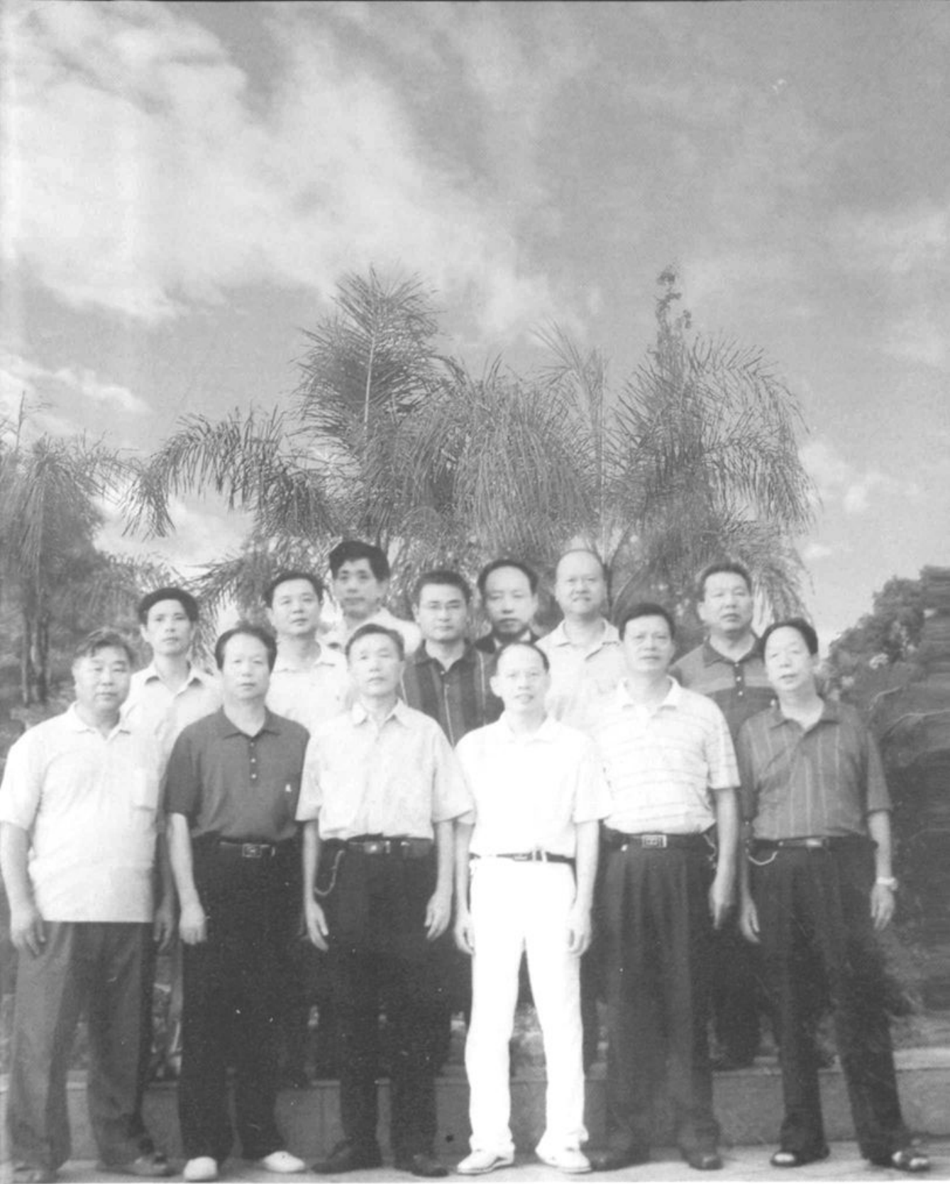
● 1988—2005 年市粮食局历任领导合影