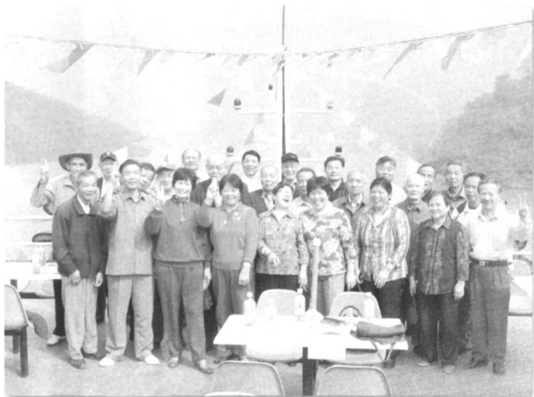
●金秋重阳粮食老人在一起