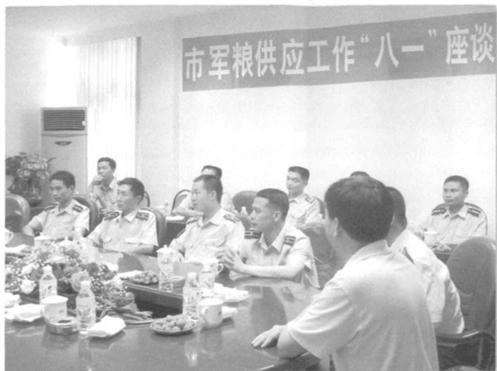
●军粮供应向部队伙食单位征求意见