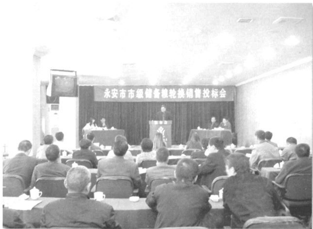
●规范粮食安全管理，落实储备粮轮换制度