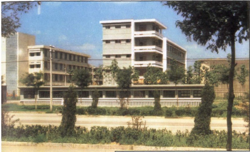
▲ 滕县卫生防疫站, 1987年迁入善国北路新址。