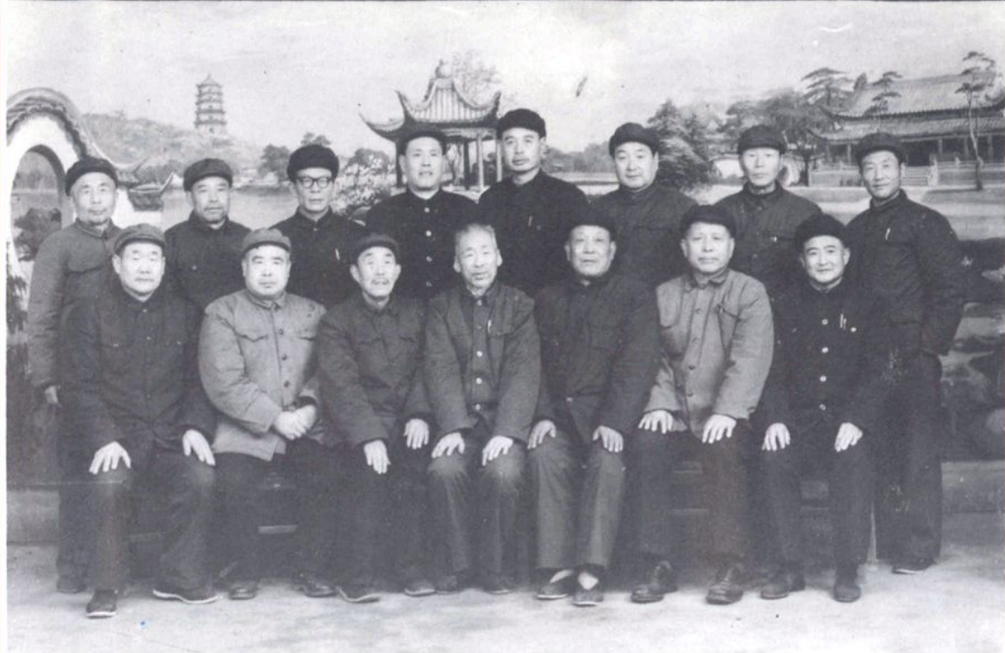
▲ 1983年11月24日，《滕县卫生志》顾问组召开会议研究编志工作，此为与会人员合影。