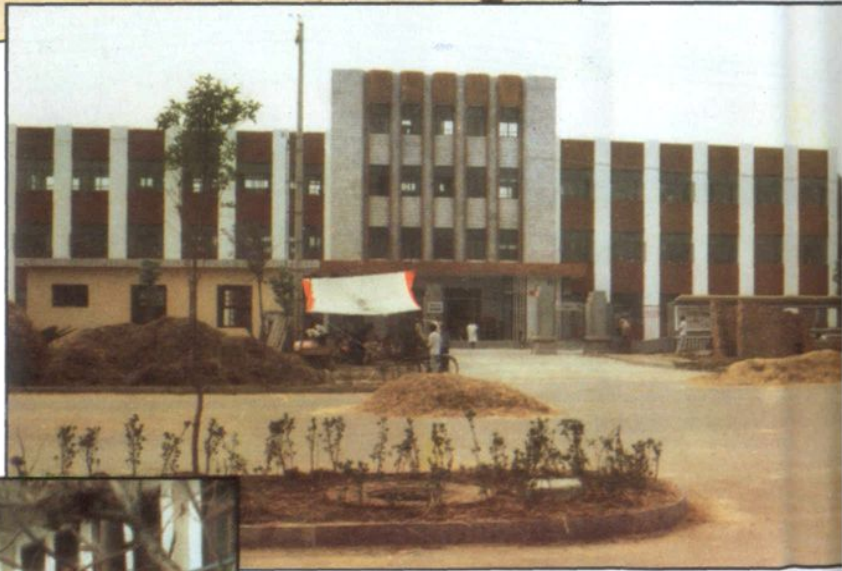
▲ 滕县妇幼保健站, 1987年迁入中心大街新站址。