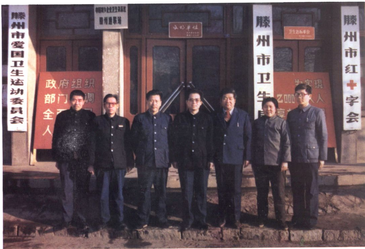
《滕县卫生志》领导小组全体人员（1989年）