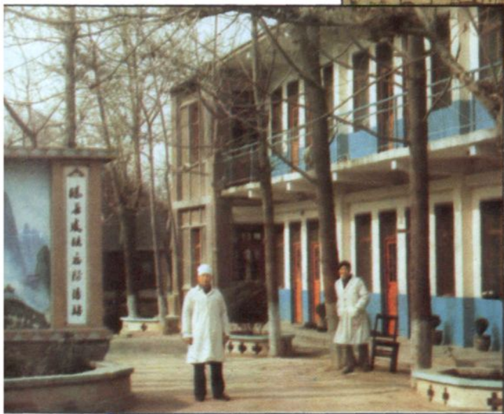
◀ 滕县皮肤病防治站办公楼。