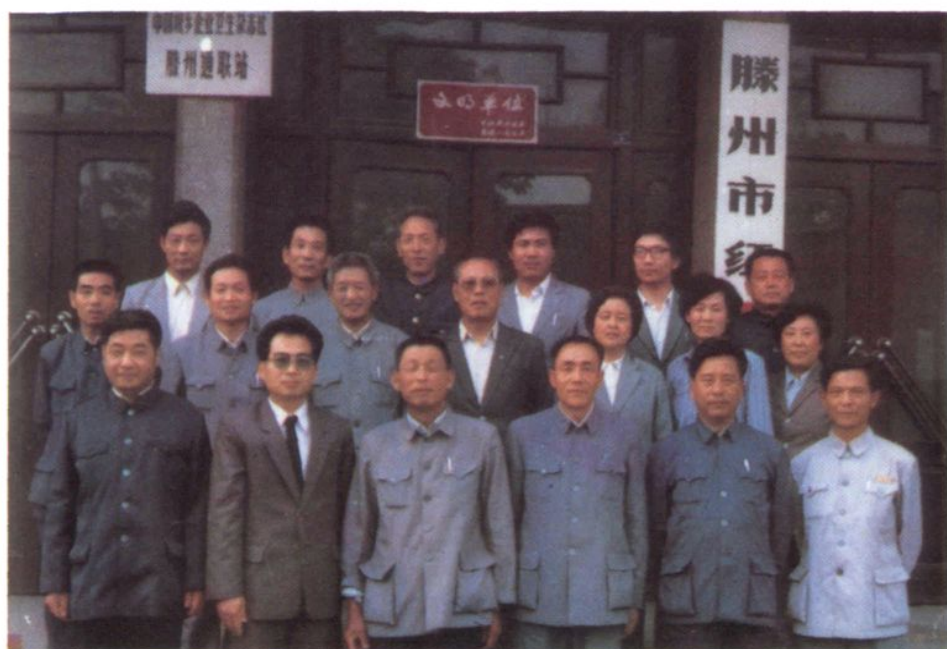
◀ 滕县卫生局全体人员 (1989年)。