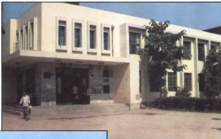
▶ 滕县中心人民医院放射楼。