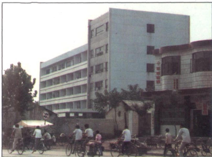
◀ 滕县中心人民医院外科系病房楼，1987年启用。