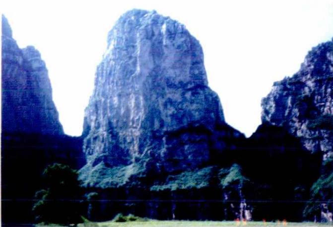
△ 北魏文成皇帝南巡御射笔架山