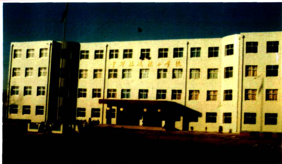
▷ 县城镇小学教学楼