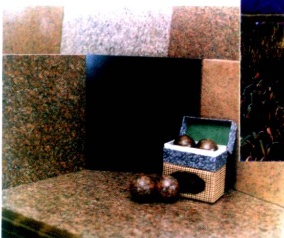
△ 花岗岩健身球(手球)