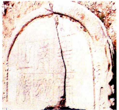
△ “文成皇帝南巡之颂”碑首