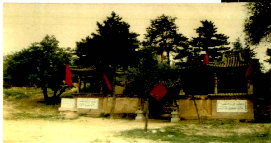
△平型关战役遗址老谷庙