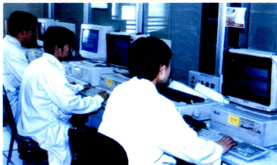
◁程控电话交换机房