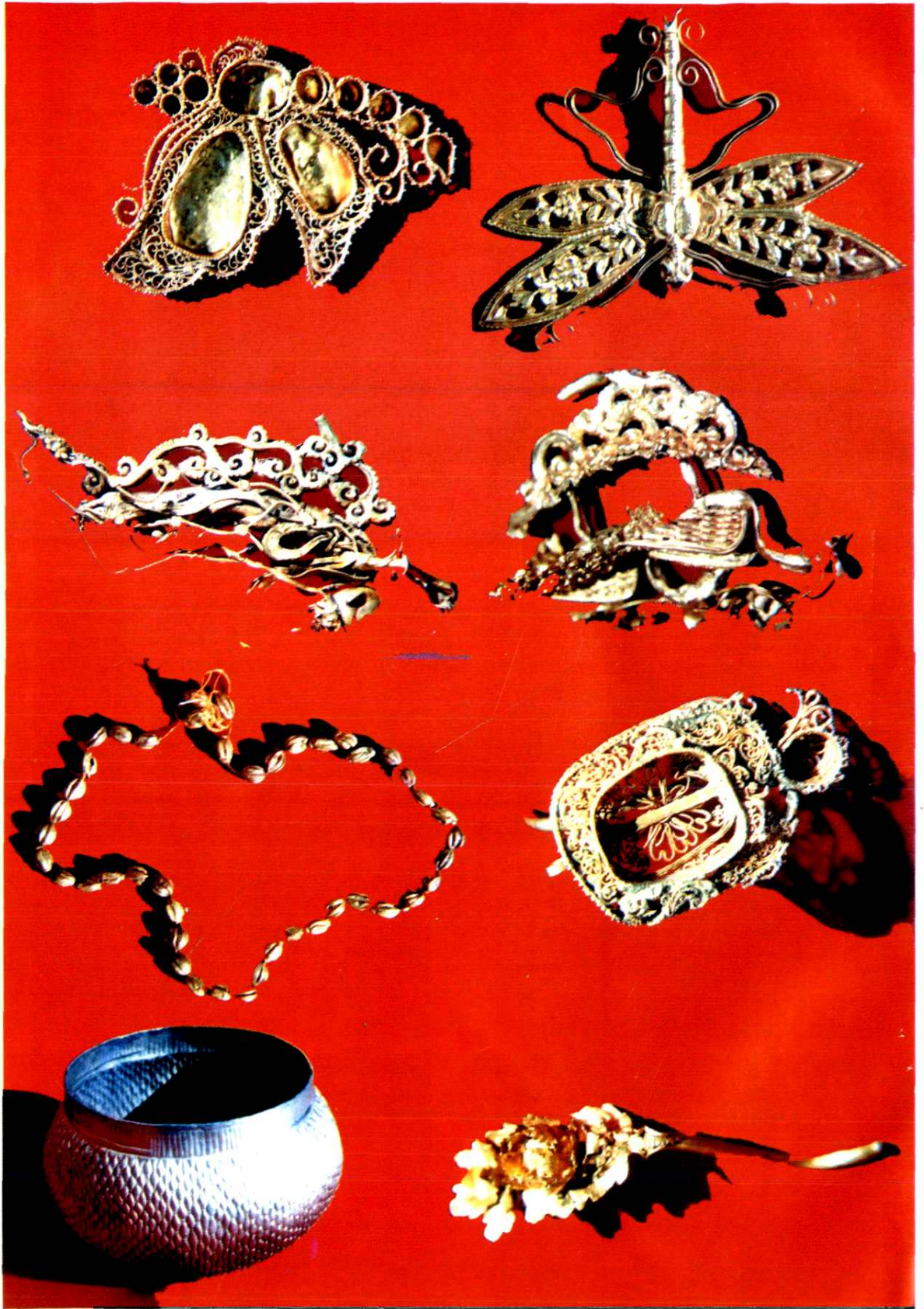
△ 1983年曲回寺出土元代金、银器