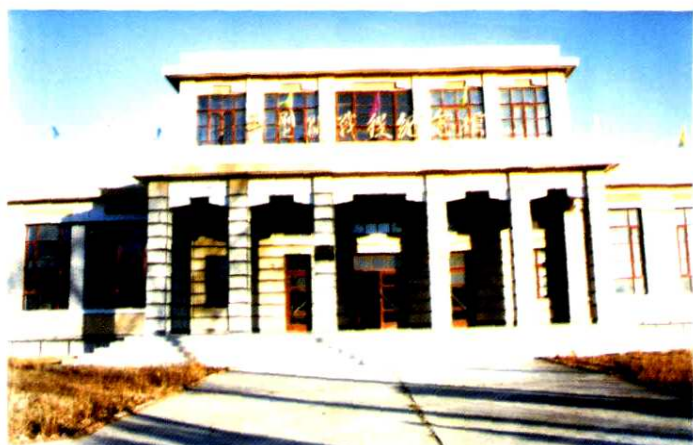
△平型关战役纪念馆