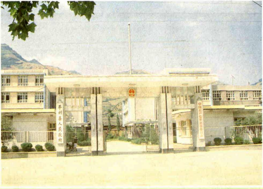
县委、县政府办公楼