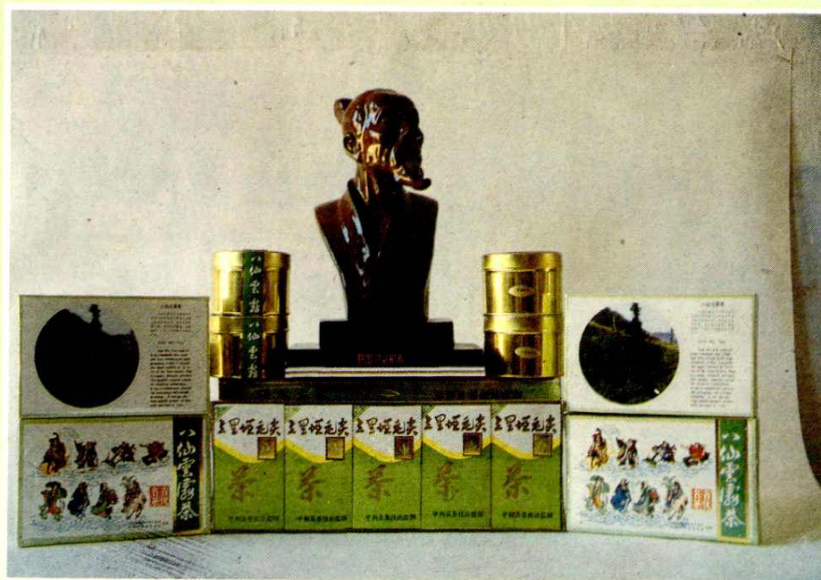
平利县“八仙云雾茶”