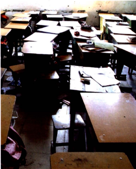
二完小地震后教室现场