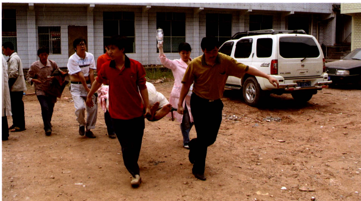
医务人员与志愿者齐心协力转运伤员