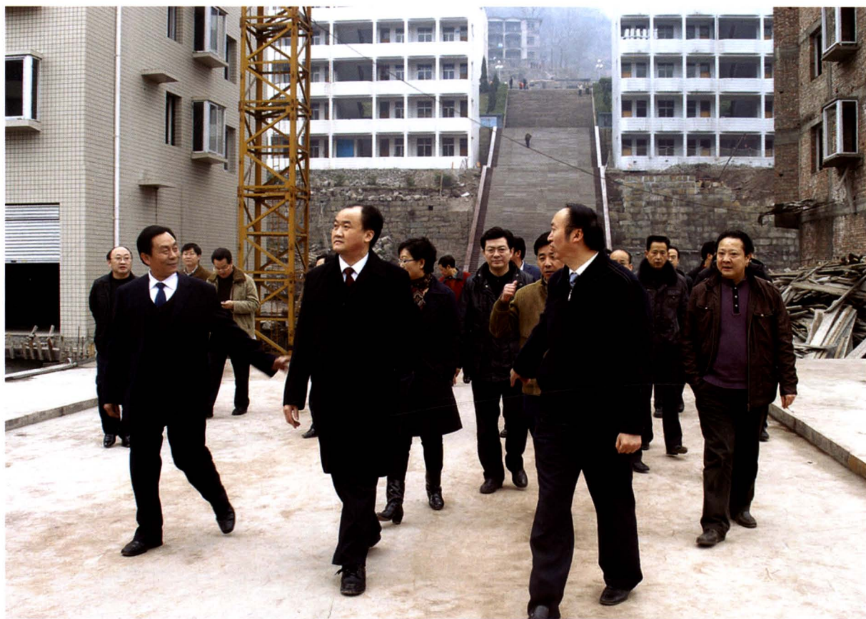
时任市委书记、市人大常委会主任李仲彬（前中）深入县职中检查指导灾后重建工作