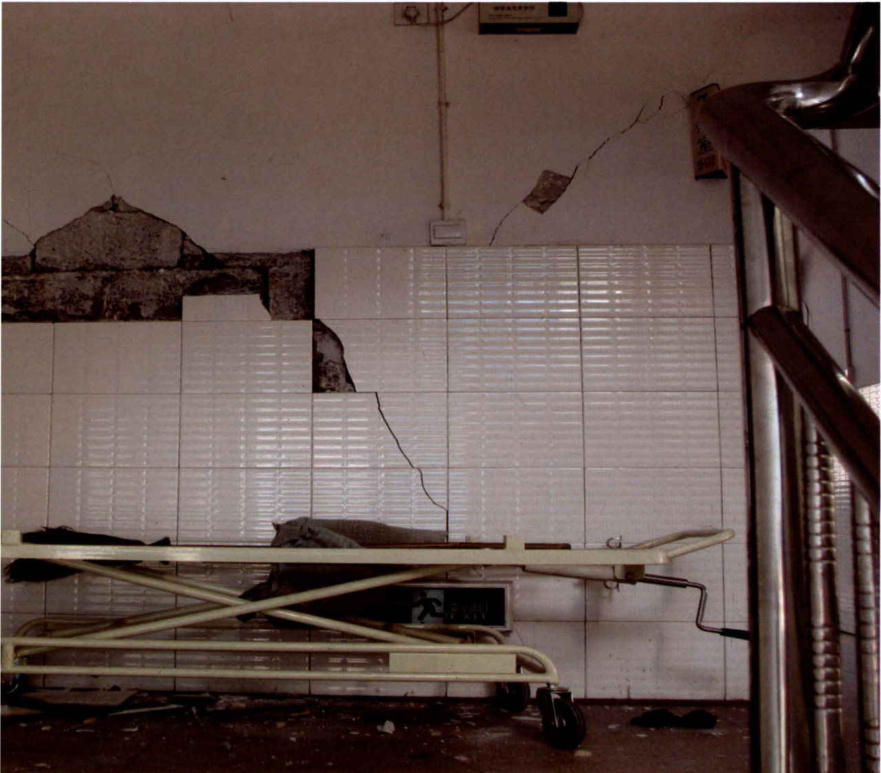
县人民医院墙体多处受损