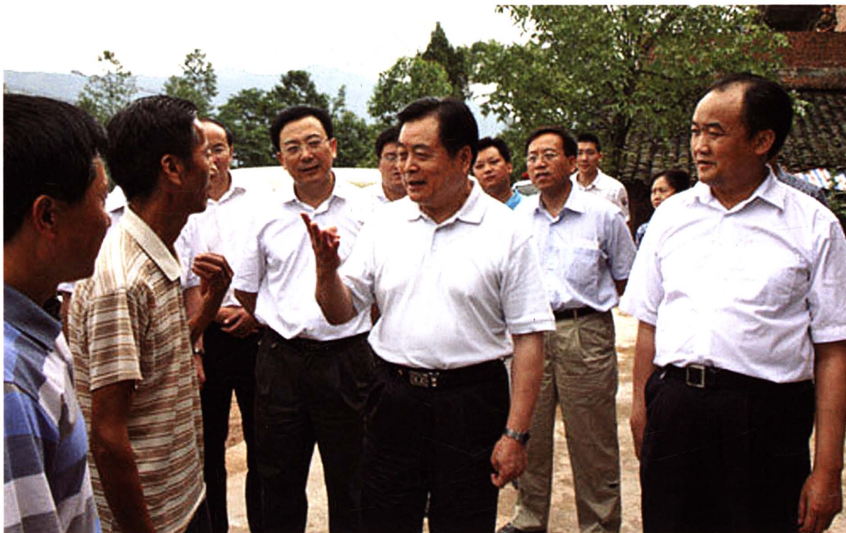
2008年9月5日，时任省委副书记、省长蒋巨峰（中）检查指导南江灾后重建工作