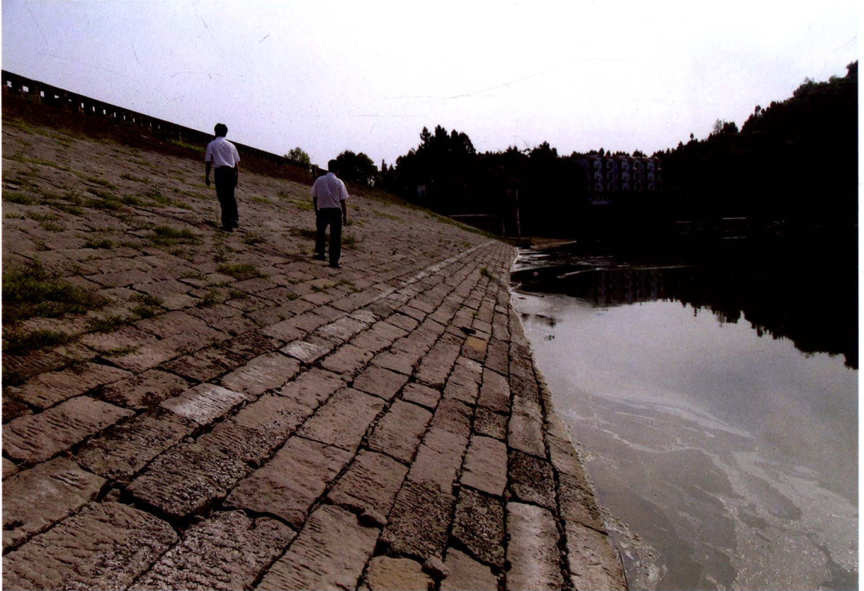
地震造成红光乡玉堂水库渗漏，水位下降