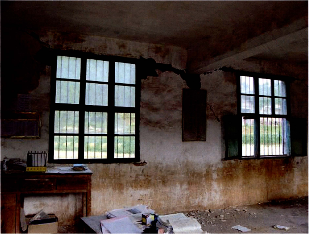
傅家乡袁家村小学教室震损现场