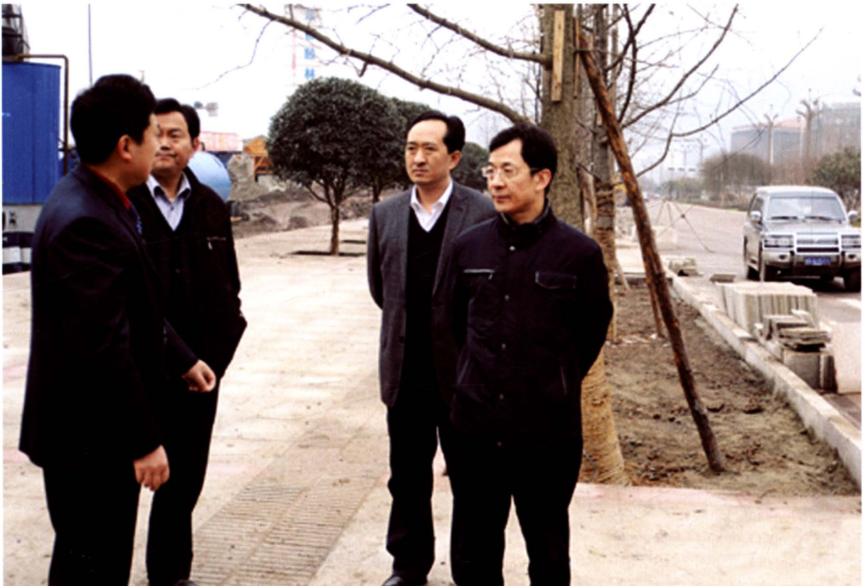
人大常委会党组书记、主任郭治中（右一）深入红塔新区督查灾后重建进度