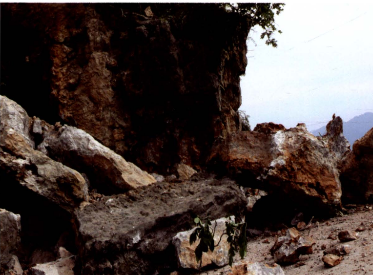
地震造成鹿（角垭）贵（民）路断道