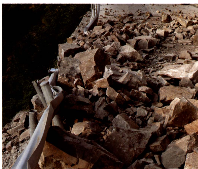
地震造成二南（南江—南郑）路陈家山段断道