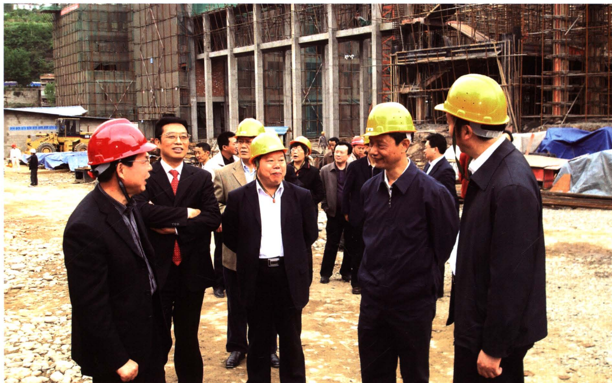
2010年4月22日，省教育厅厅长涂文涛（右二）在南江中学新校区建设工地视察