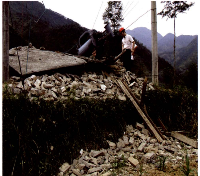
地震造成电力设施设备损毁