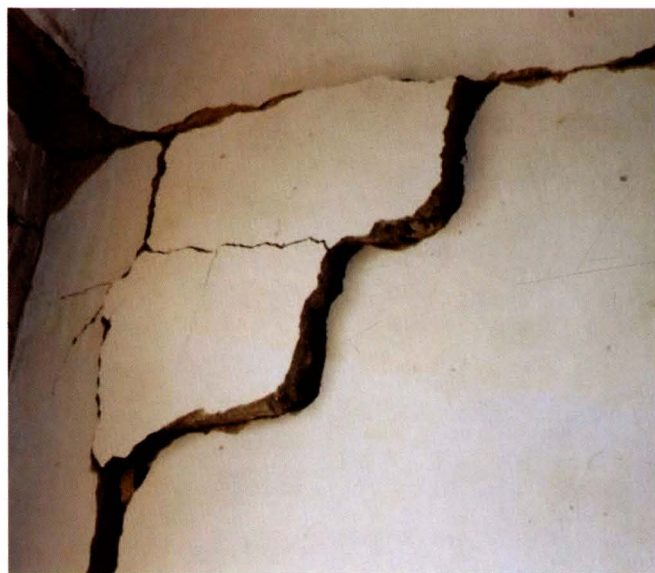
桥亭乡龙门村小学墙体严重受损并错位、主梁折断