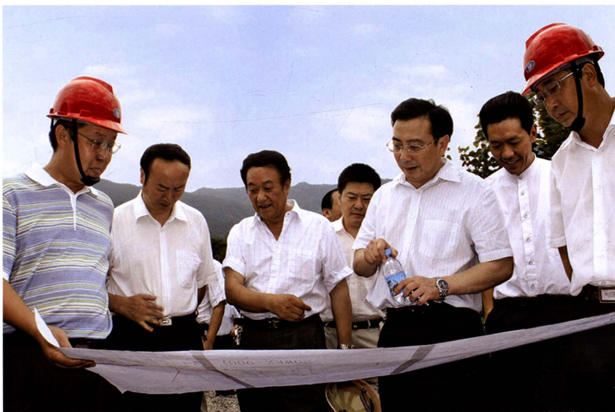
时任市委副书记、市长蒲波（右三）到南江检查指导灾后重建工作