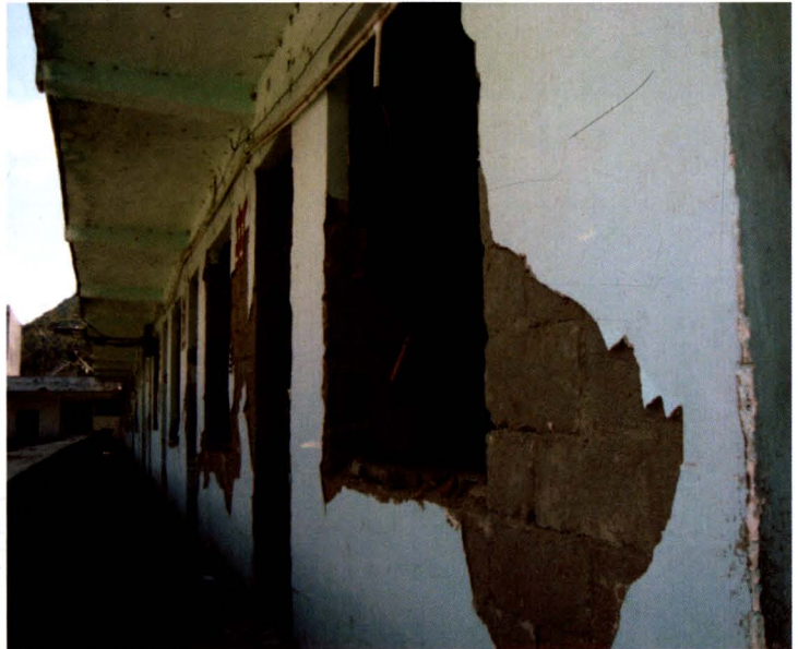
关坝小学震损现场