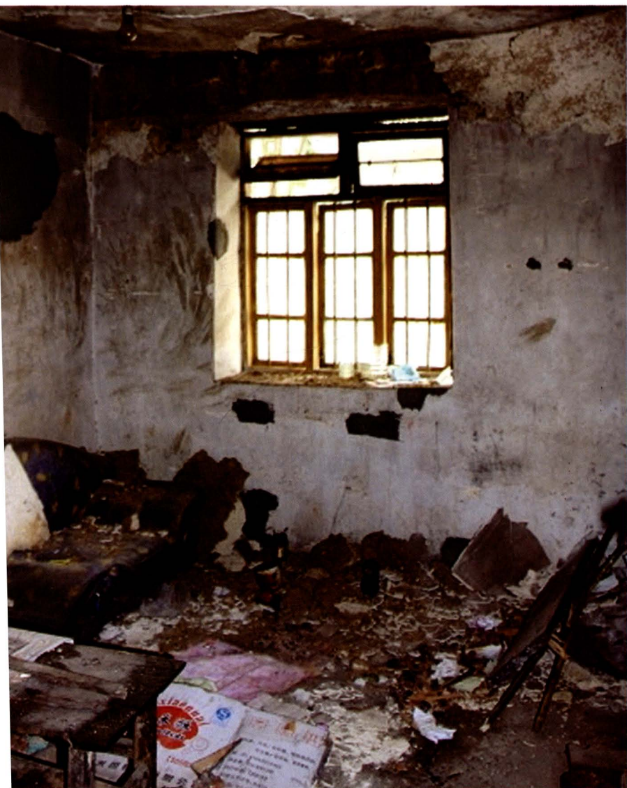
流坝小学震损现场