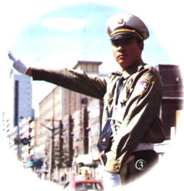
① 队列手势比赛 ② 少年交通警察 ③ 交通指挥