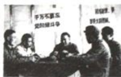
图2 乌鲁木齐市群众专政委员会办公室，群众专政委员会办公室，群众专政委员会办公室。

一年来，革命村党支部在上级党委的正确领导下，遵照上级党委的指示，确实抓出了战果，他们组织发动群众，大打人民战争，借助公安机关破获了各种案件三十起，有力地打击了犯罪分子，进一步巩固了无产阶级专政为政治制度，群众专政工作提供了有益的借鉴。