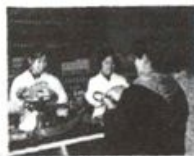
图4 乌鲁木齐市群众专政委员会办公室，群众专政委员会办公室，群众专政委员会办公室。