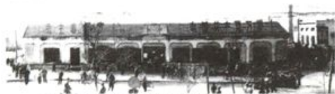
图1 乌鲁木齐市群众专政委员会办公室，群众专政委员会办公室，群众专政委员会办公室。

ANNA DIKTATORISINING KUDRITI QAKSIZ — BAYHUACUNNING AMANLIK SAKLAX HIZMITI TOMRISIDA