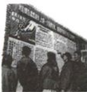
图3 乌鲁木齐市群众专政委员会办公室，群众专政委员会办公室，群众专政委员会办公室。