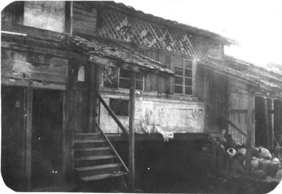
原贡川 税务所(城墙堡)