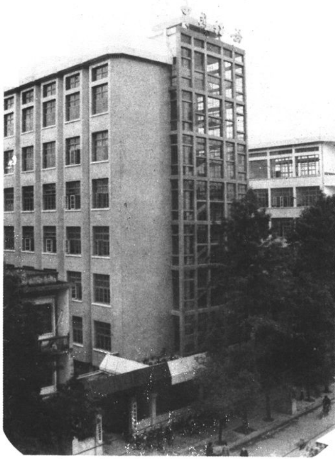
永安市税务局外景