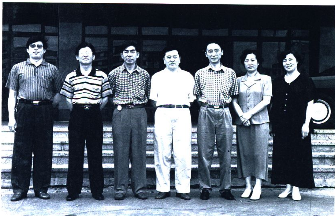
市计委领导班子合影