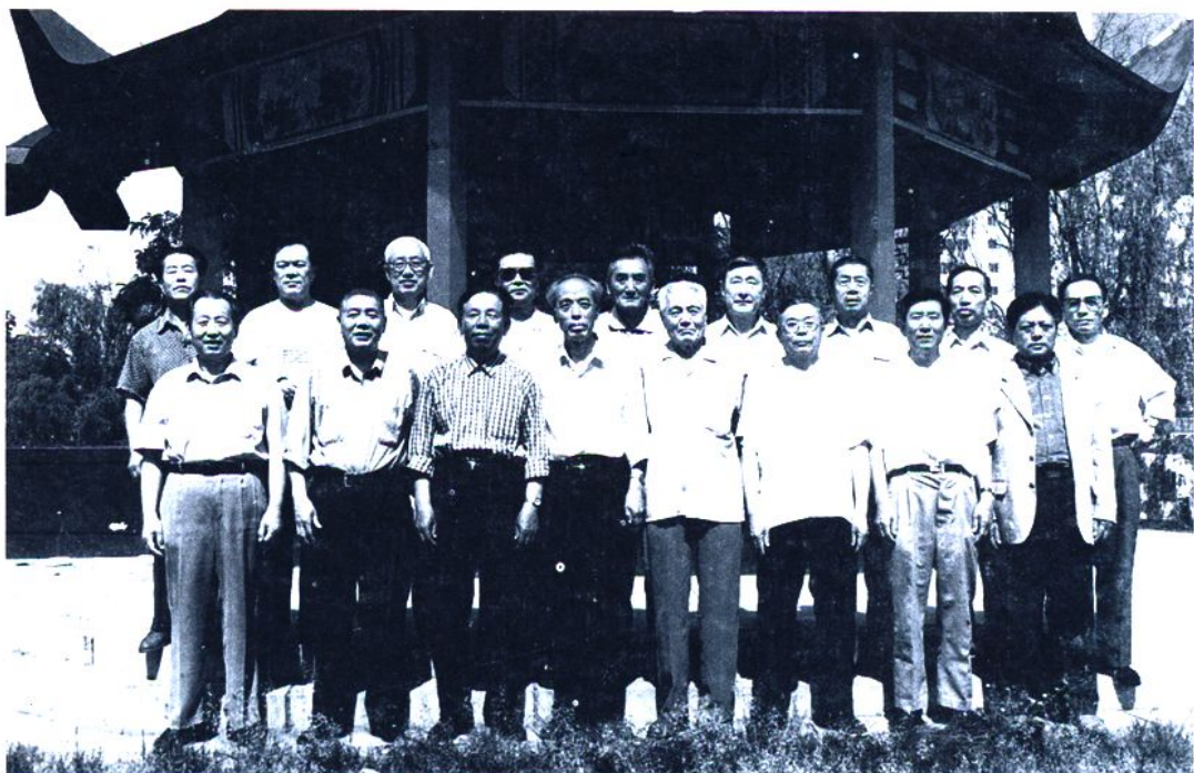
市计委离退休人员合影