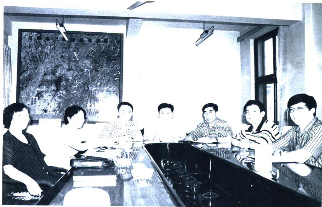
计划志编委会审查志稿