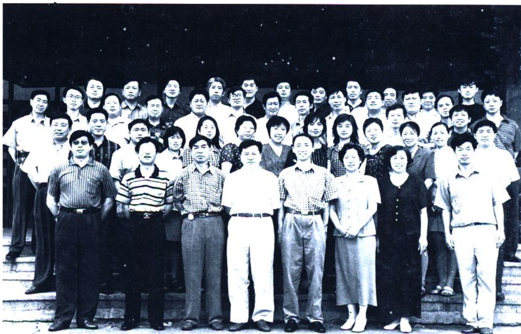
市计委工作人员合影