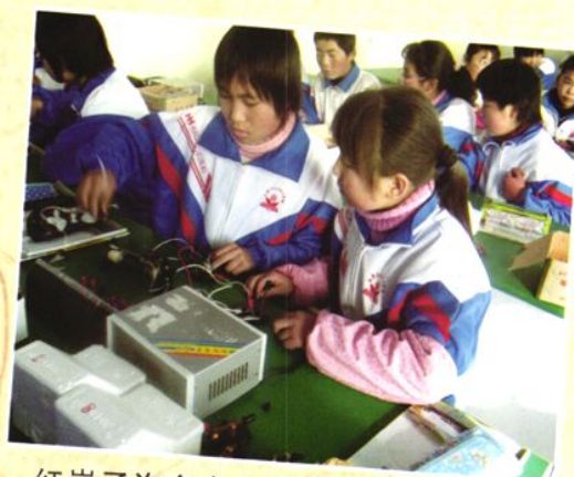
红崖子沟乡中心学校学生在做实验