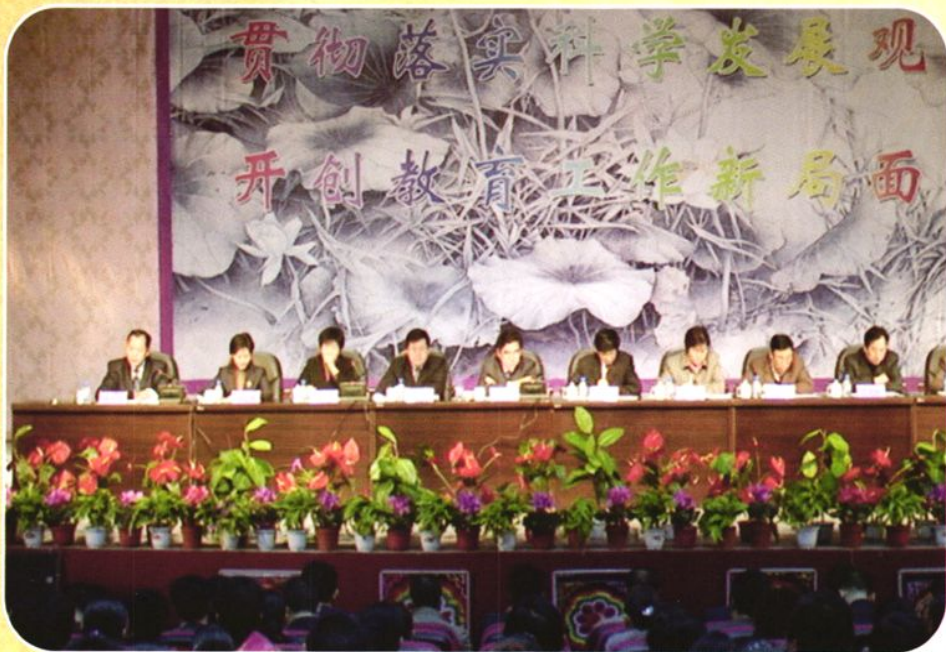
县委、县政府召开全县教育工作会议。 图为大会主席台。