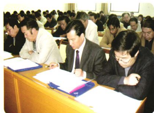
教育局召开全县校长工作会议