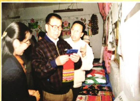
1997年5月14日，国家教委副主任张天保（中）在副省长白玛（右一）、县特校副校长马灵芝（女，左一）陪同下，到互助县检查指导教育工作。图为观看县特校学生做的土族刺绣作品。