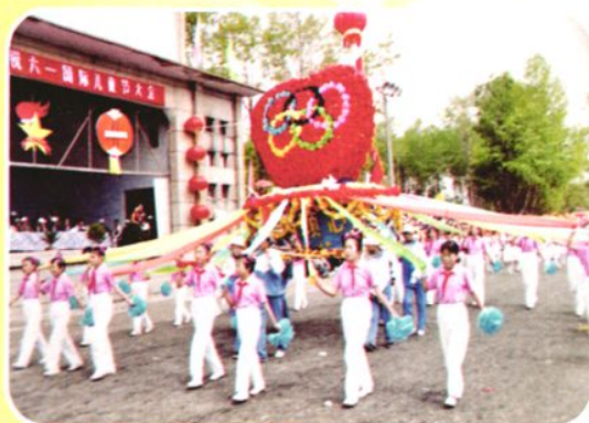
“五环”方队经过主席台