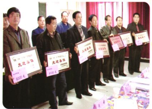
全县学校“抓管理，促质量” 先进集体受到表彰