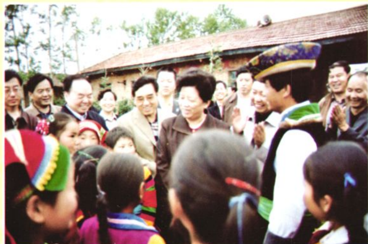
2003年8月9日，国务委员陈至立（女，中）及教育部部长周济（左三）来我县视察指导教育工作。图为陈至立国务委员和教育部部长周济与互助县东沟乡塘拉小学师生亲切交谈。