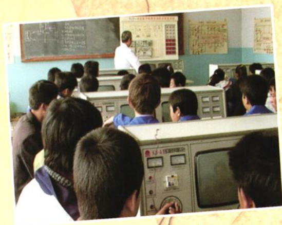
职中学生上机电课