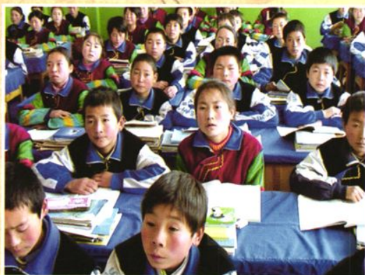
互助民族中学学生正在上课