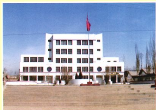
互助县职业技术学校教学楼