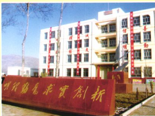
新建的丹麻中学教学楼