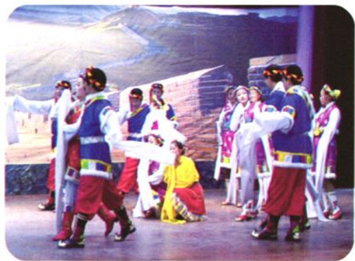
学生表演文艺节目