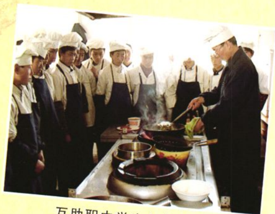
互助职中学生上烹饪课