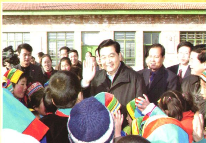
2005年12月25日，中共中央总书记、国家主席、中央军委主席胡锦涛（图中）前来互助县威远镇古城小学视察。