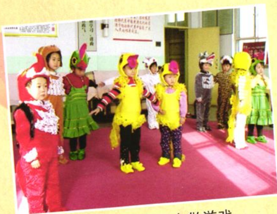
机关幼儿园小朋友做游戏