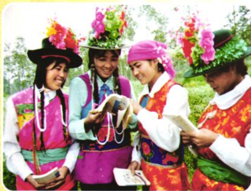
东和乡麻吉村扫盲班学员交流学习