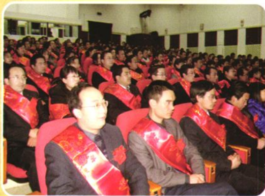
全县骨干教师表彰会。图为受表彰的教师。