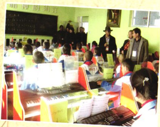
学生家长观摩新建的电子琴专用教室