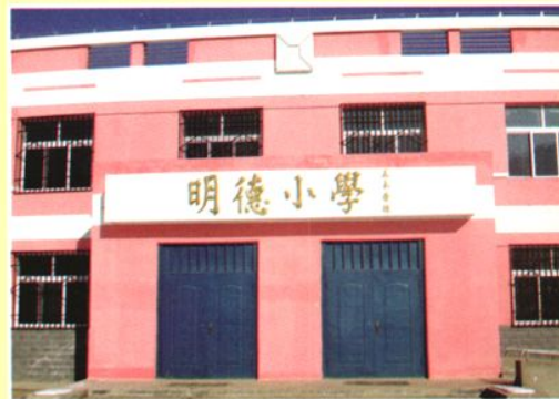
南门峡镇卷槽村明德小学教学楼