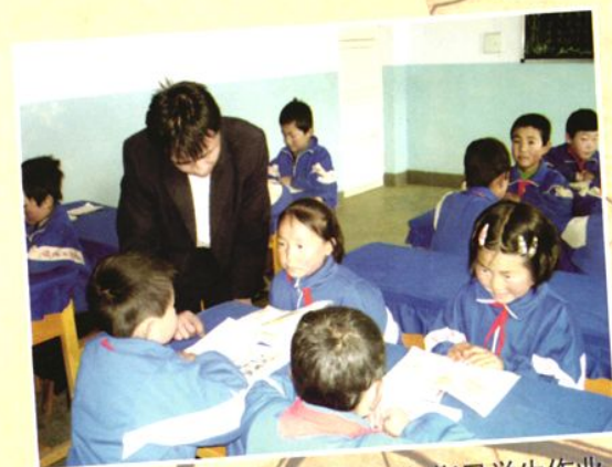
南门峡镇卷槽村明德小学教师指导学生作业