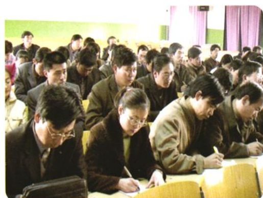
全县中小学教师培训