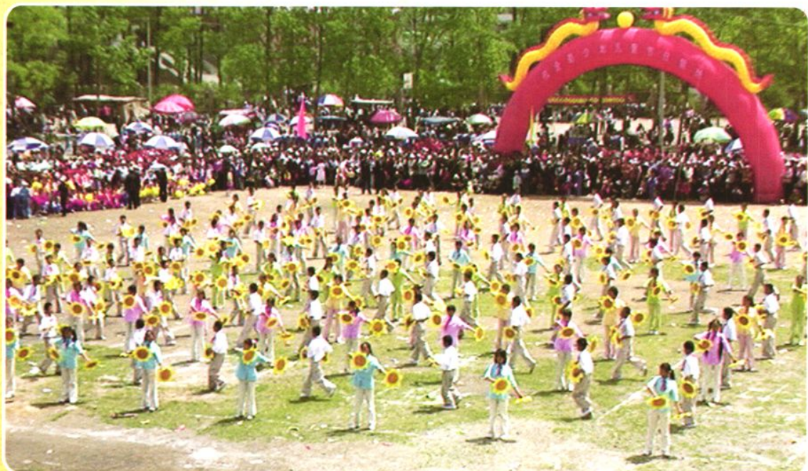
学生团体体操表演