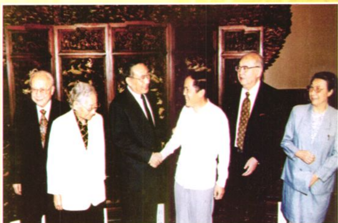
1997年9月10日，党和国家领导人李岚清（时任中共中央政治局常委、国务院副总理，左三）、雷洁琼（左二）、钱伟长（左一）、王光英（右二）、钱正英（右一）在北京亲切接见互助县东山乡什巴小学校长、特级教师刘让贤（右三）。