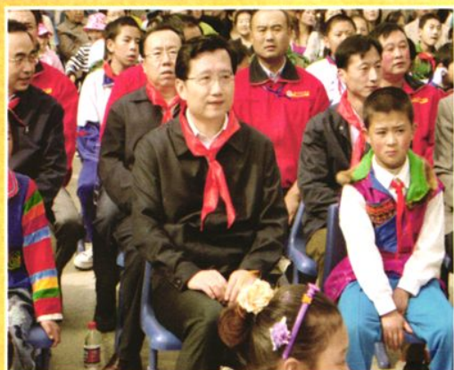
省委书记强卫（前排中）到互助县丹麻镇中心学校同师生一起欢度“六一”国际儿童节。