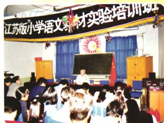
全县部分小学语文教师苏教版培训