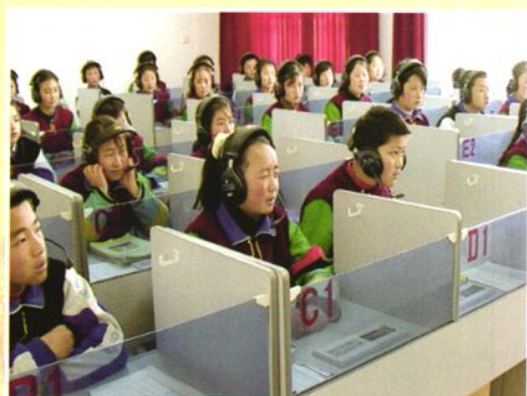
互助民族中学学生上英语听力课