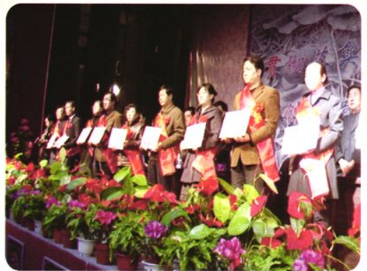
全县优秀教师表彰会。图为受表彰的教师