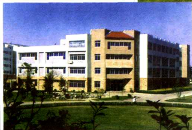
宁波效实中学图书馆