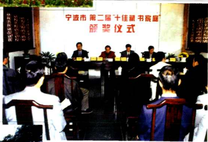
宁波市第二届“十佳藏书家庭”颁奖仪式