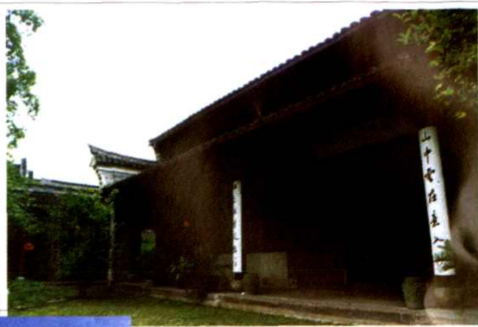
天一阁博物馆内的 中国地方志珍藏馆