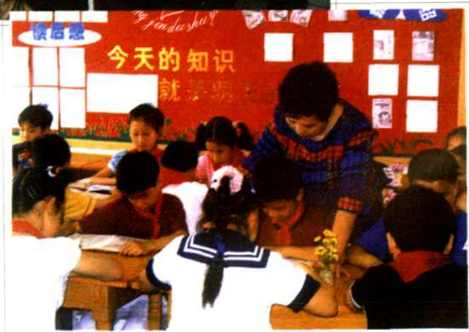
宁波市江东区实验小学 图书馆开展阅读指导