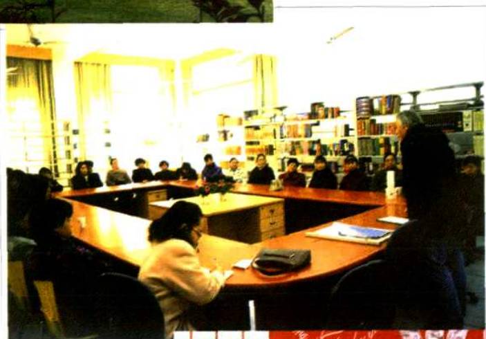
宁波华茂外国语学校 图书馆