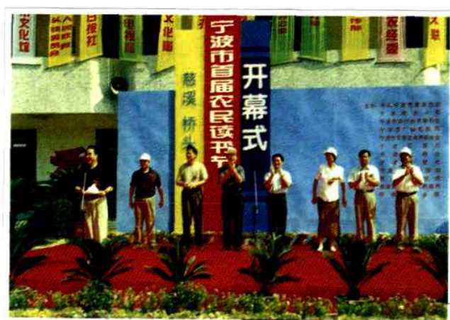
宁波市首届农民读书节开幕式