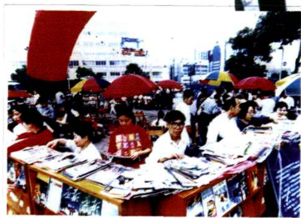
宁波市图书馆在中山广场开辟阅览广场