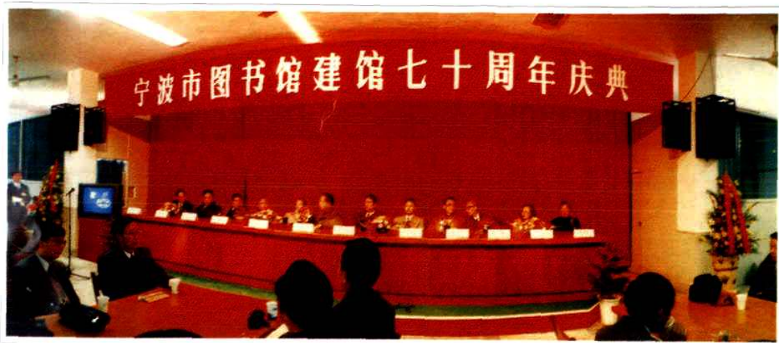
宁波市图书馆建馆七十周年庆典