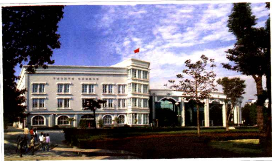
宁波市图书馆新貌