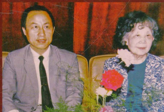
省政协主席、原省委书记卢荣景(左一)和王稼祥夫人朱仲丽(右一)来我校视察