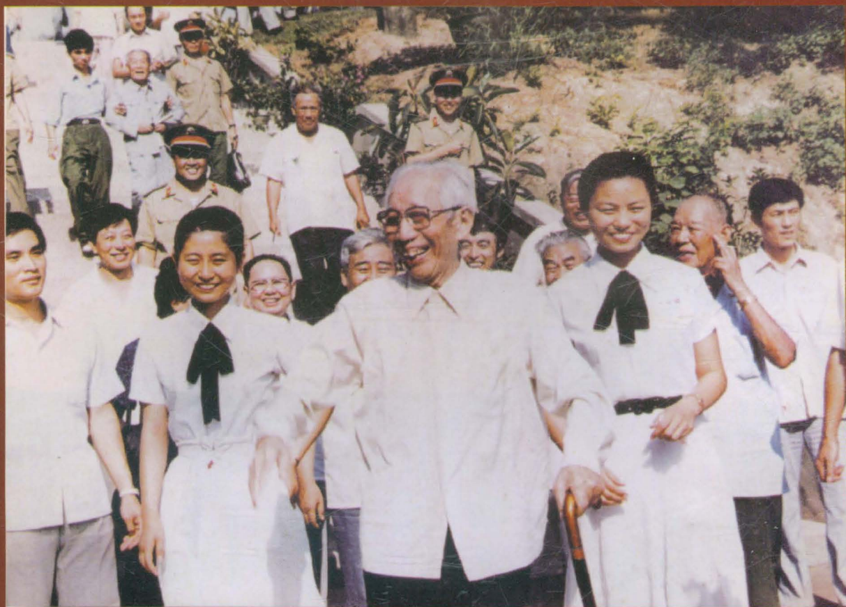
原国家副主席王震和我校师生在一起