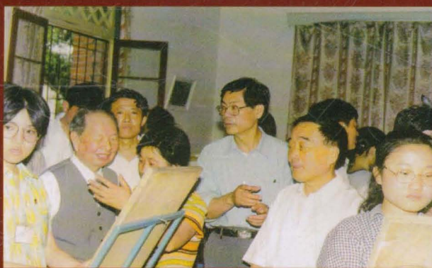
参加省陶研会素质教育现场会的代表来我校视察 (左二为原省人大常委会主任王光宇同志)