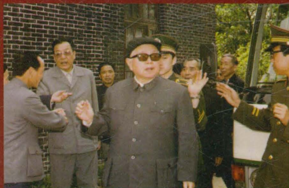
原驻法国大使黄镇同志来我校视察