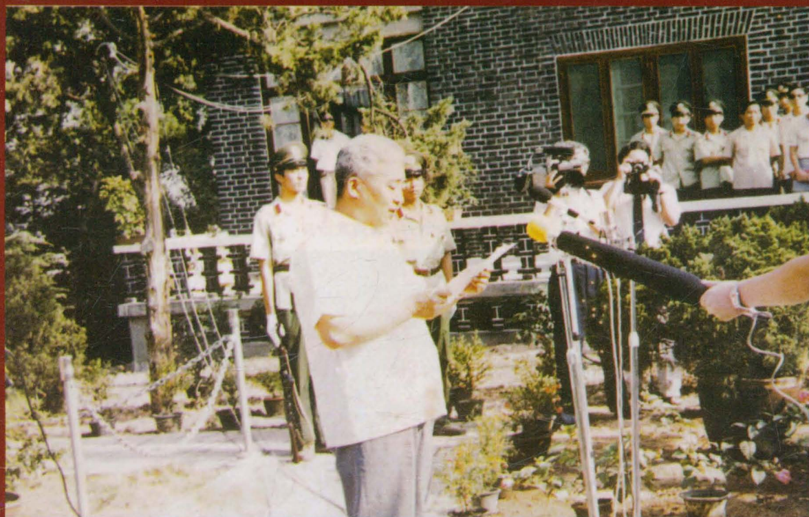
全国政协副主席、原省委书记李贵鲜同志来我校视察