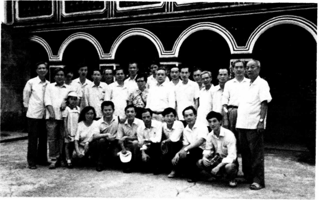
一九八九年十月一日本会组织党员与致华教师参观 中山市翠亨中山故居