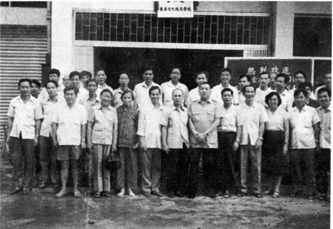
台山致华文化技术学校（高中部）迁址仪式结束后 本会领导、嘉宾、教师合影