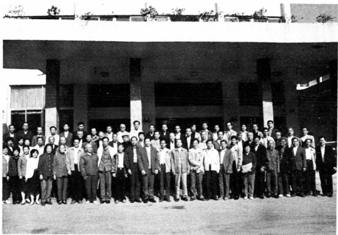
本党台山县第三届委员会成立时，全体党员与领导、嘉宾合影