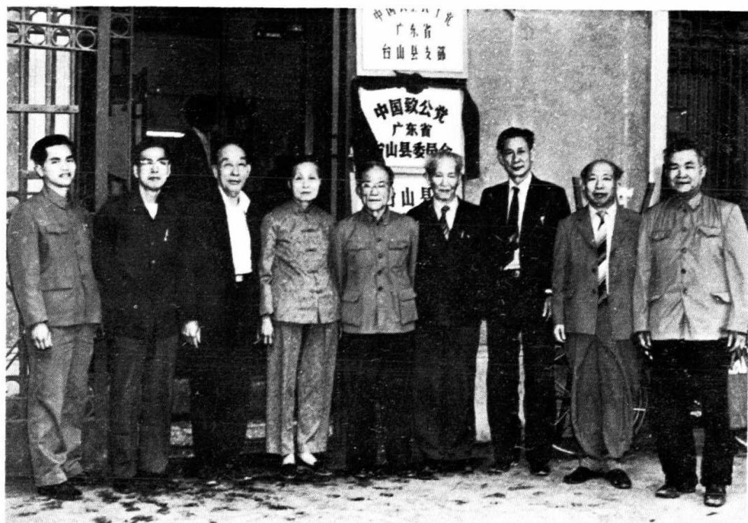
本党台山县第一届全体委员于1984年3月15日在县委成立“挂牌”后合影