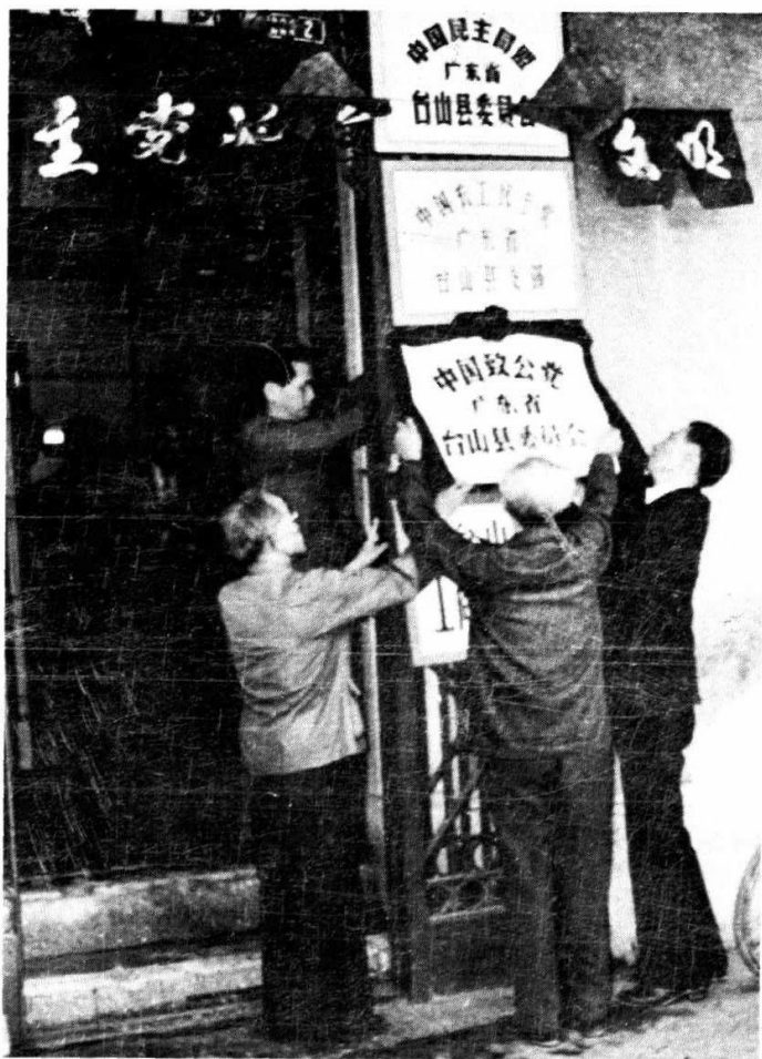
致公党台山县委会（一九八四年） 办公地址：台城西濠路二号地下欄楼