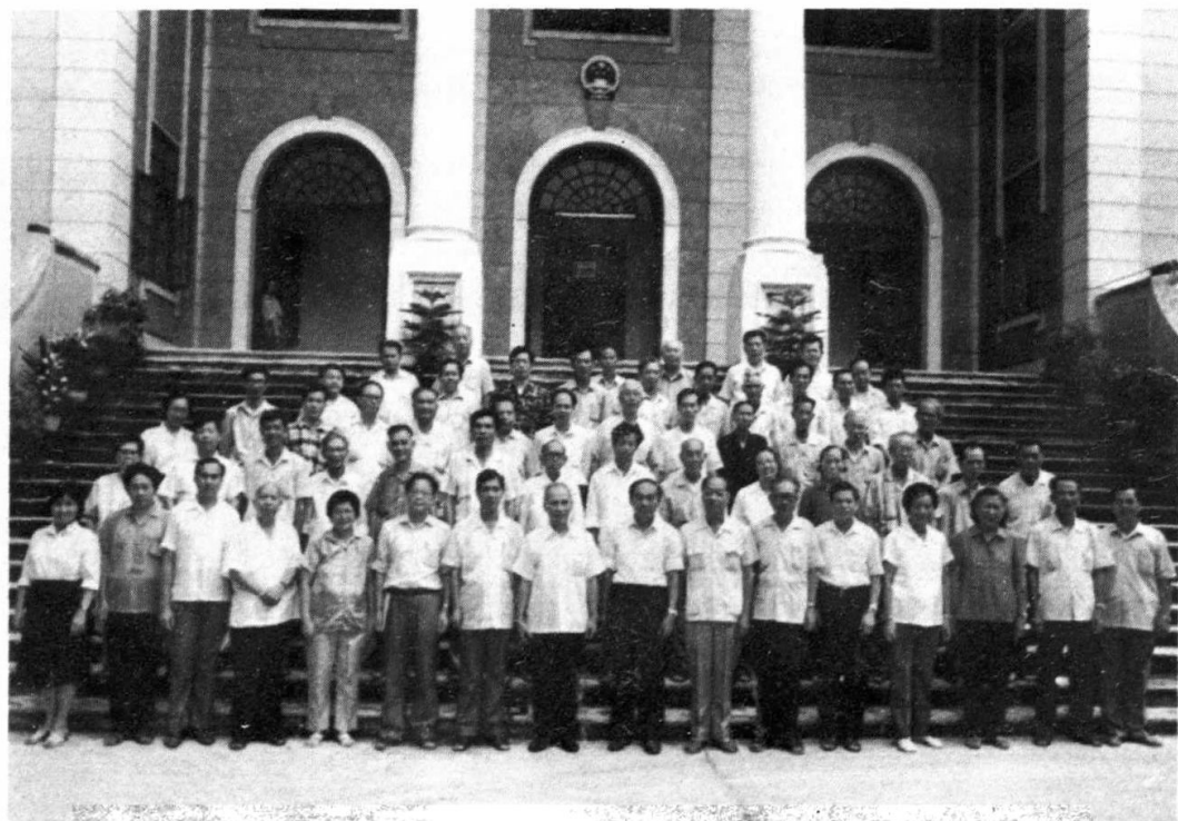
本党台山县第二届委员会成立时，全体党员与领导、嘉宾合影