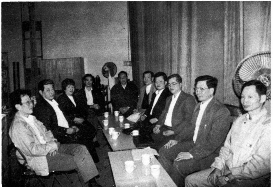
本会第三届全体委员与有关领导在会议时合影