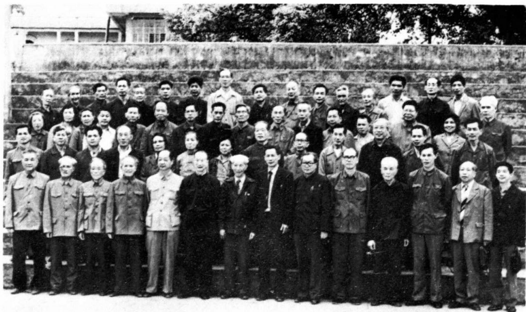
本党台山县第一届委员会成立时，全体党员与领导、嘉宾合影