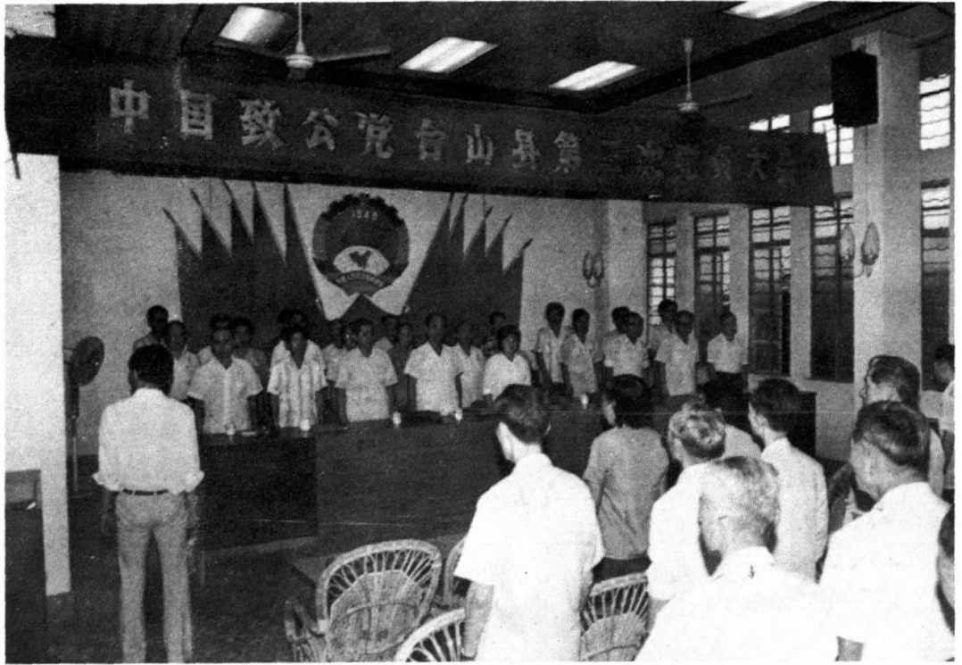
本党台山县第二次党员大会于1988年8月26日在县政协礼堂召开