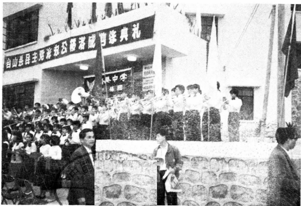
本党台山县委会（一九八九年） 办公地址：台城双亭街十四号