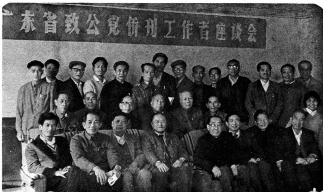
1987年12月8日，本党省委会在台山召开“广东省致公党侨刊工作者座谈会”。图为与会者合影。