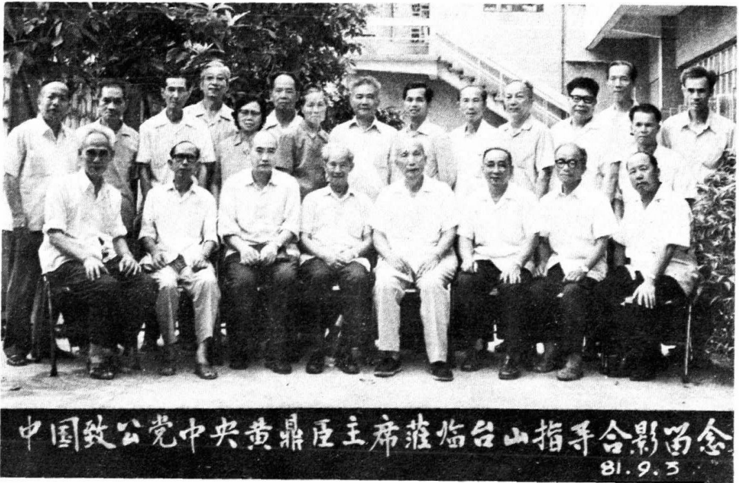
本党台山县全体党员与本党中央黄鼎臣主席（前左五）合影