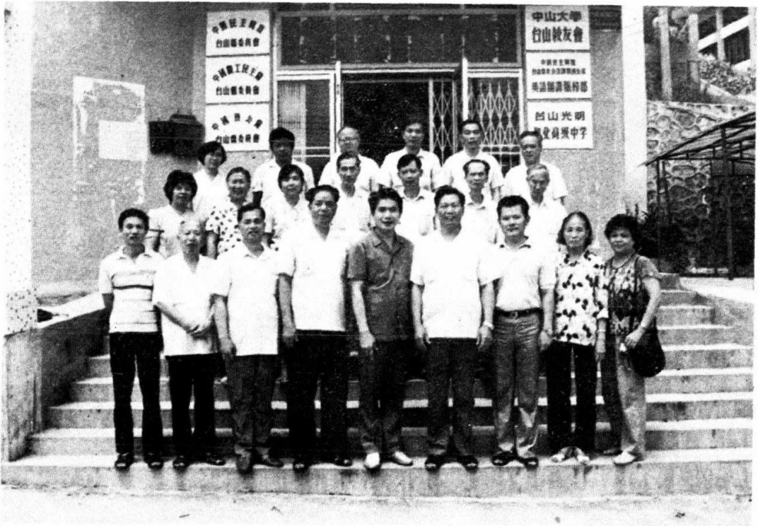
本党中央王宋大副主席（前左五）和本会同志合影