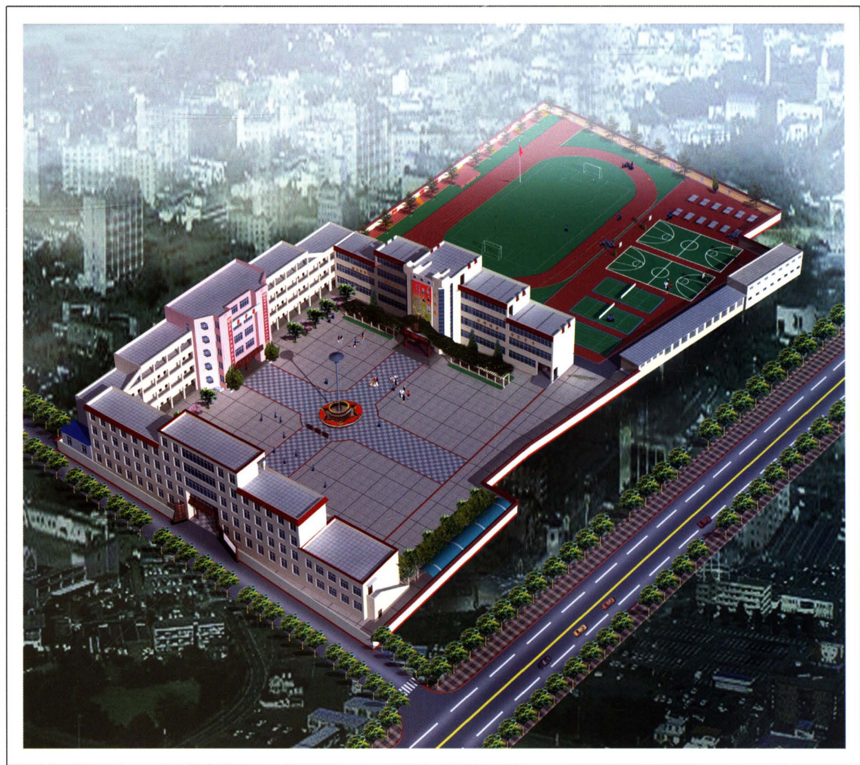
牡丹区第二十二初级中学鸟瞰图（校本部）