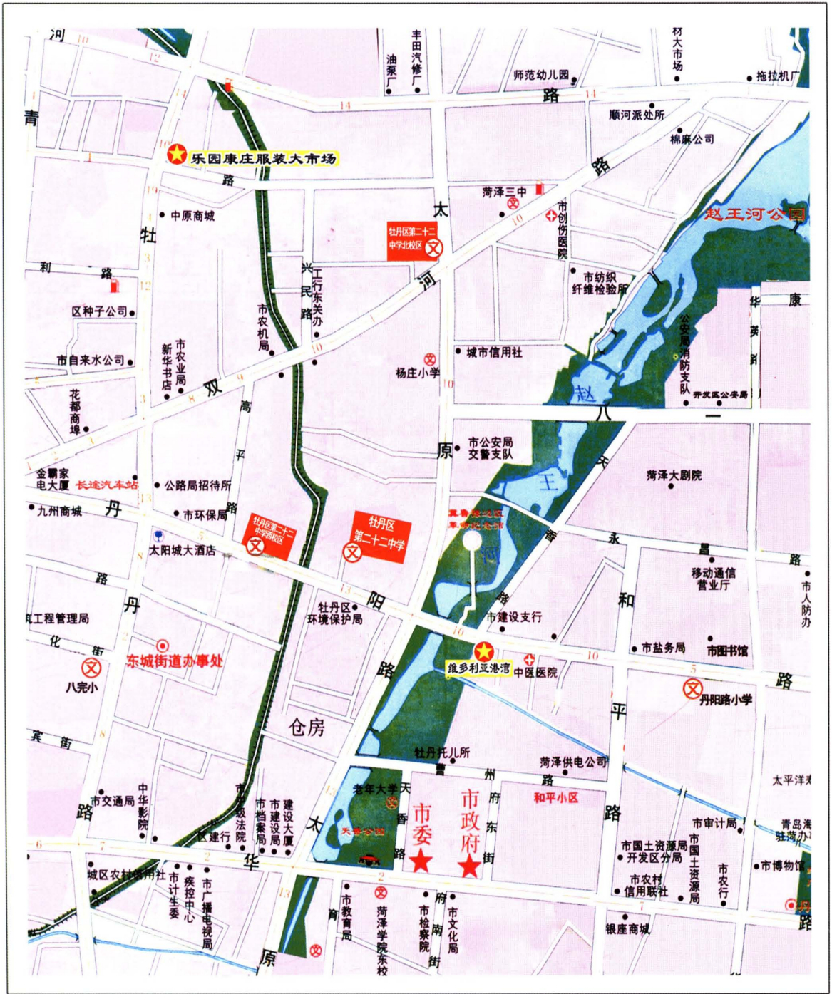
牡丹区第二十二初级中学位置图