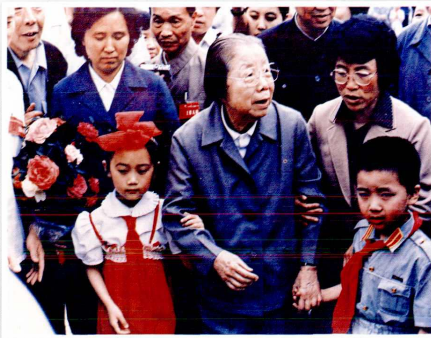
1986年6月全国政协主席邓颖超（中）参加西安市青少年宫落成典礼