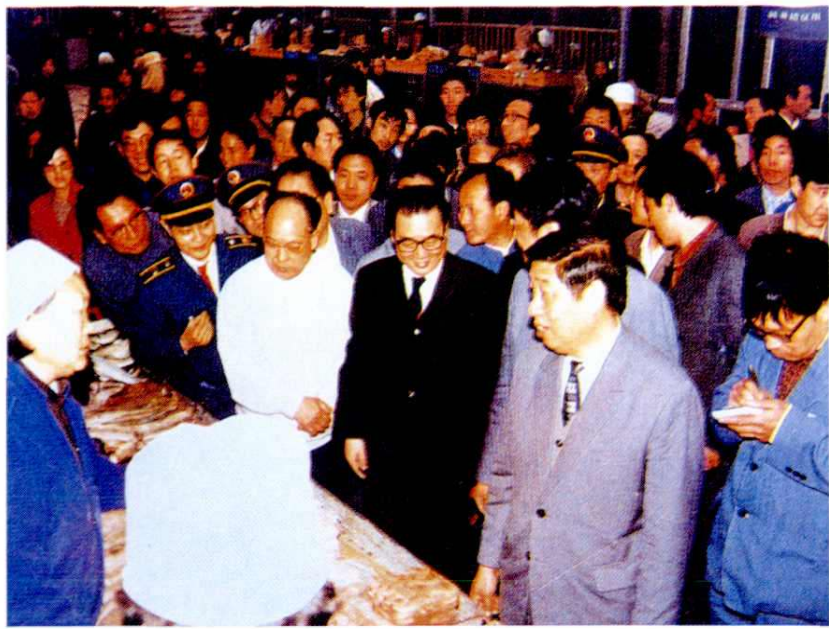
1988年5月国务院总理李鹏（前右二）视察炭市街副食品市场