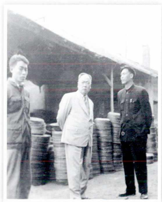
1961年10月国务院副总理陈毅(中) 视察西安人民搪瓷厂