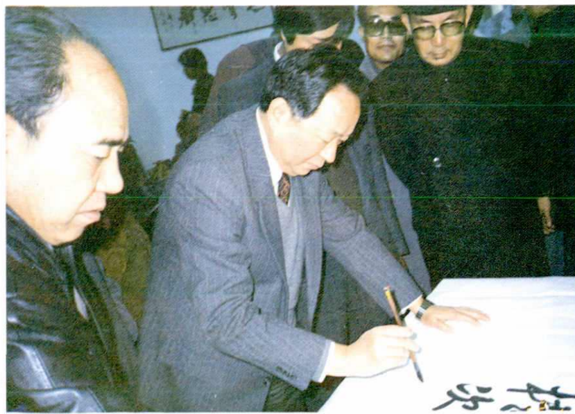
1992年11月国务院副总理田纪云视察翠宝首饰集团公司