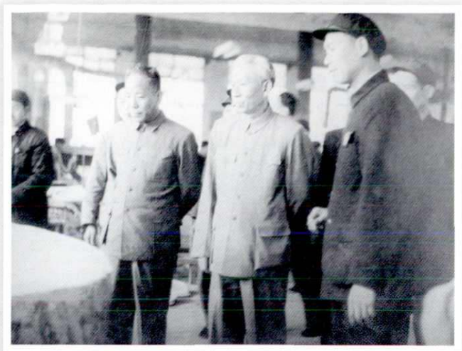
1960年4月中华人民共和国主席刘少奇 (前右二)视察西安人民搪瓷厂