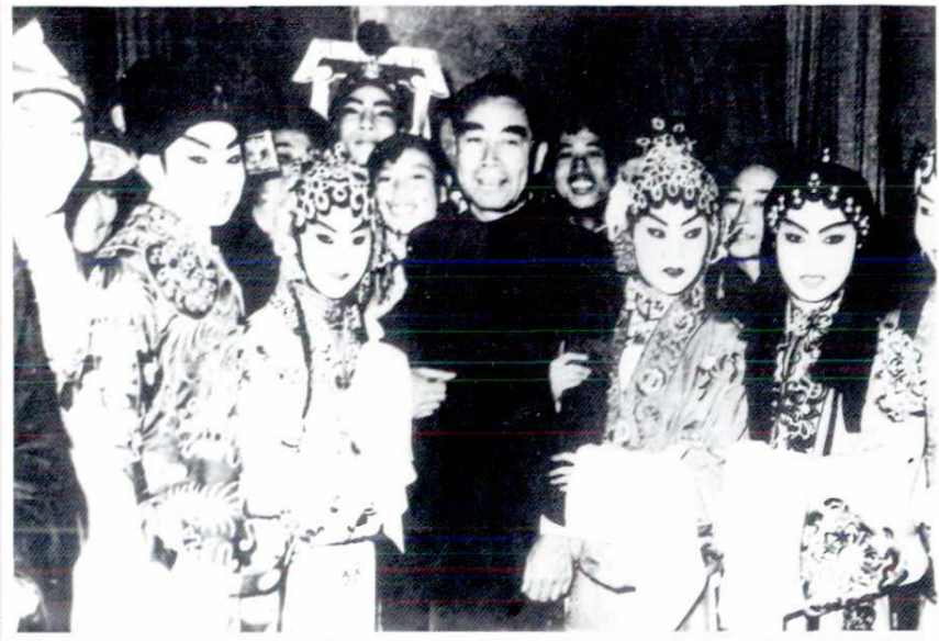
1958年国务院总理周恩来（中）接见易俗社《三滴血》剧组演员