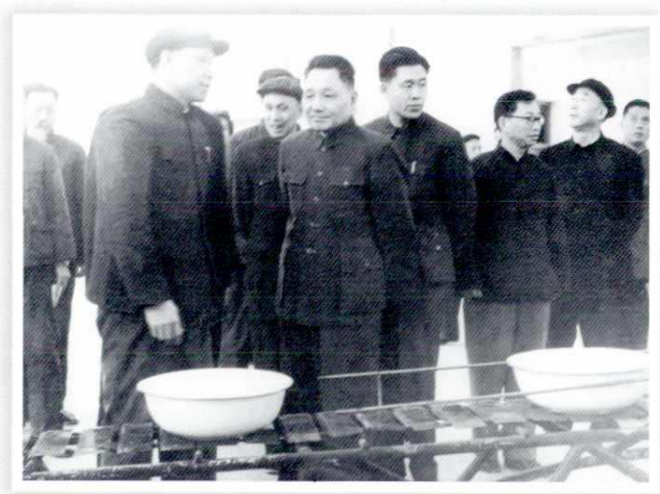
1966年3月中共中央总书记邓小平 (前右一)视察西安人民搪瓷厂