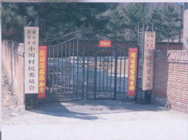
现小川村民委员会