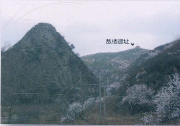
村南部边墙 敌楼遗址