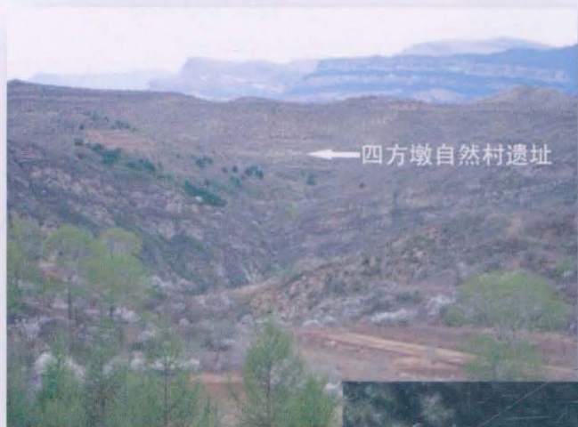
四方墩自然村遗址