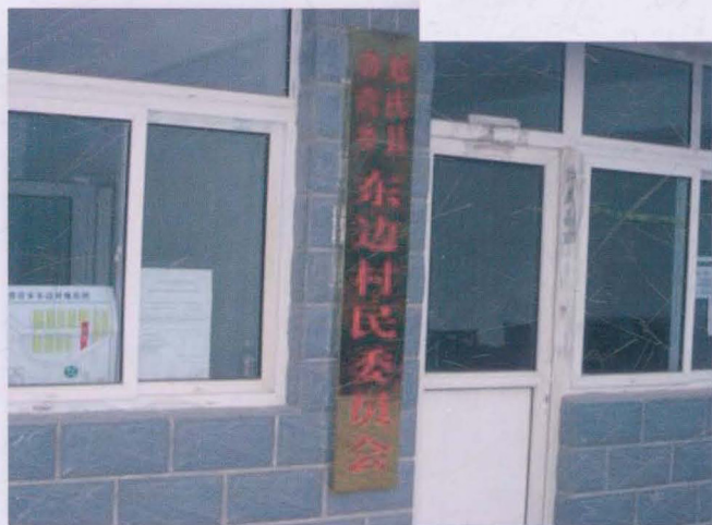
现东边村民委员会