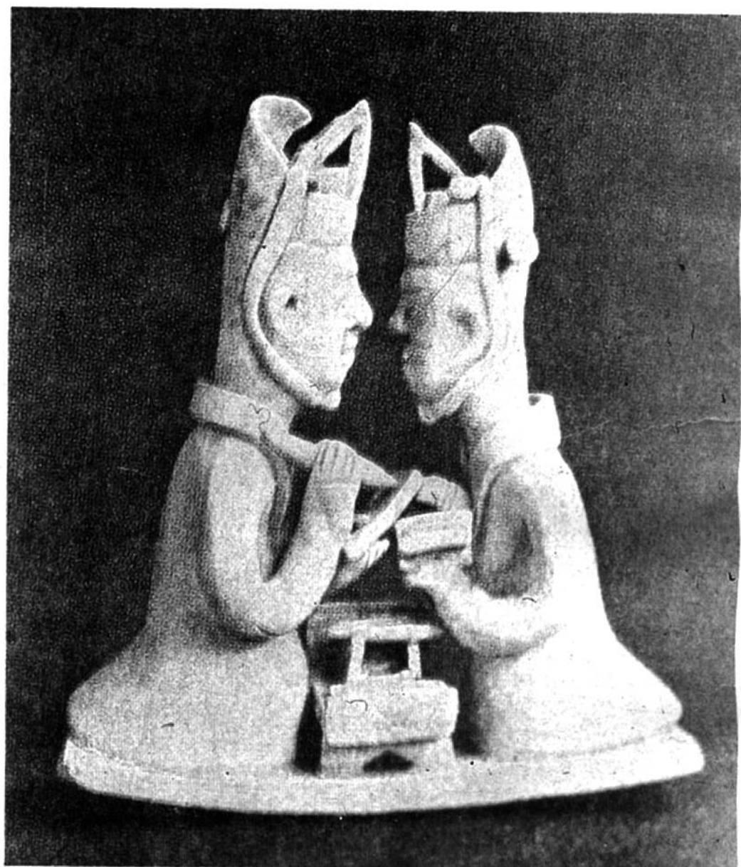
校 雛 俑