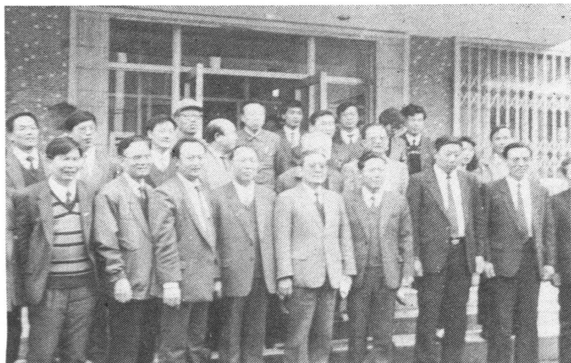
国务委员、国家科委主任宋健来院视察