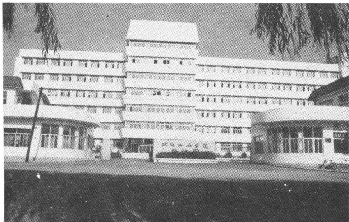
沈阳工业学院科技园