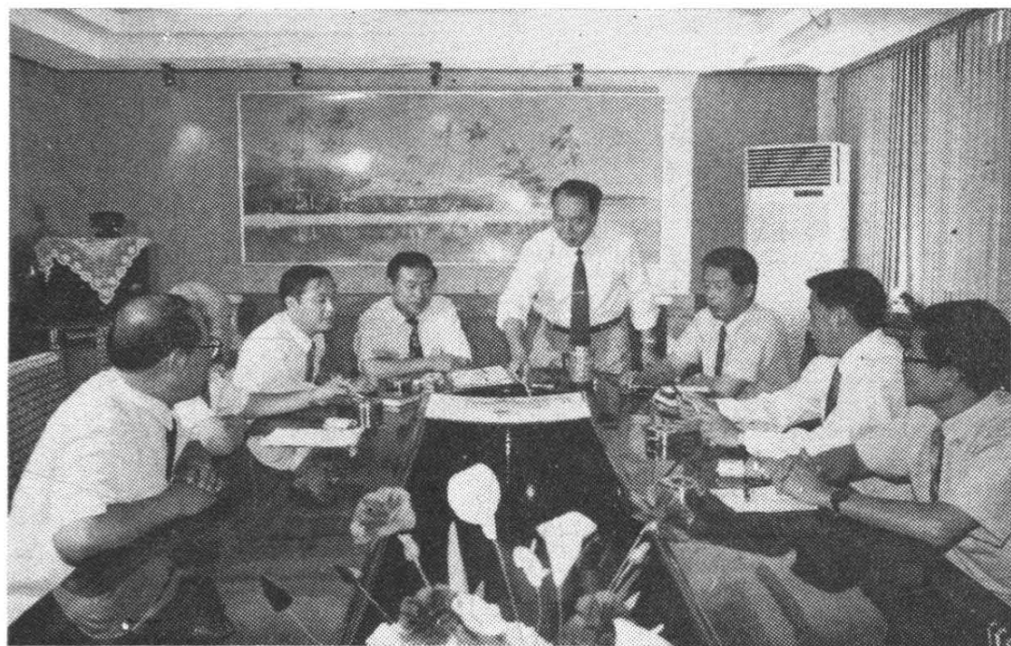
学院领导班子在研究工作。