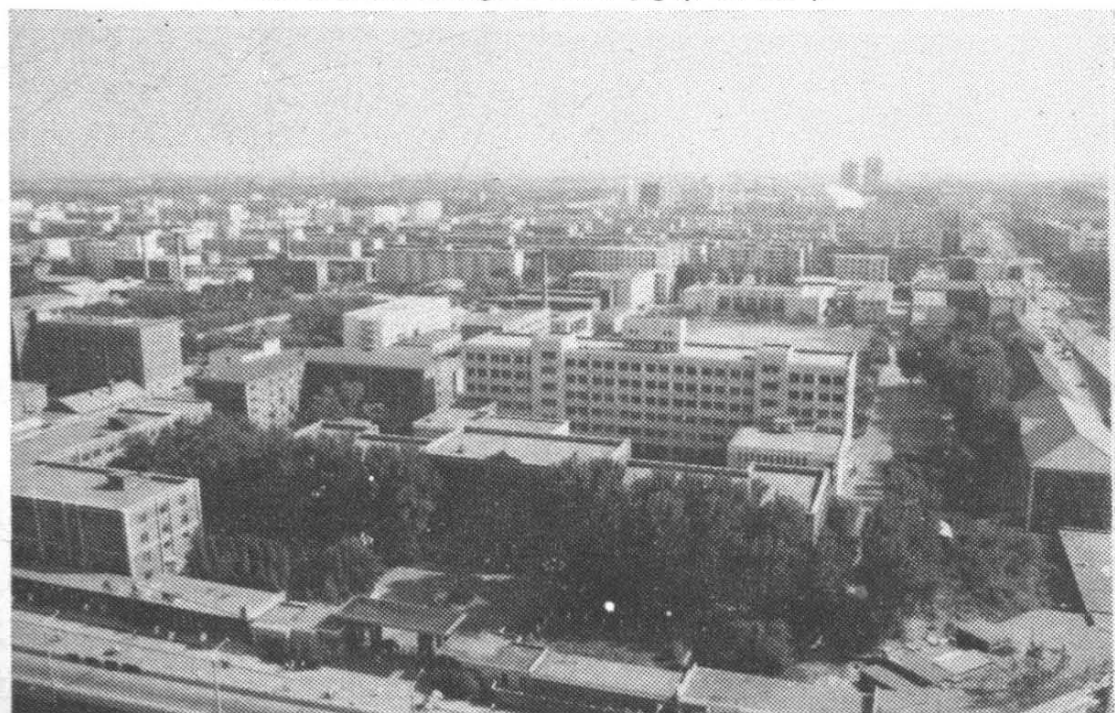
沈阳工业学院全貌