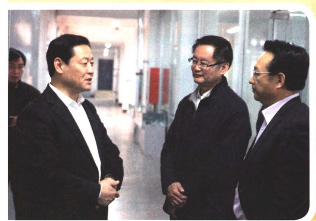
2014年，时任河北省常委、石家庄市委书记孙瑞彬到我院视察