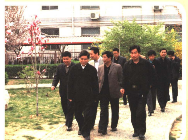
2007年，时任河北省副省长龙庄伟到我院视察