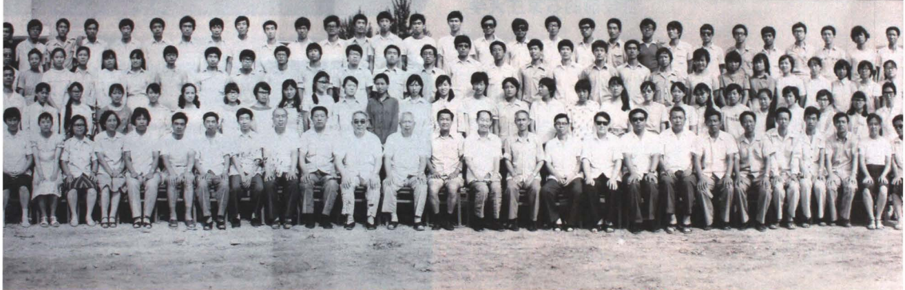
石家庄大学首届毕业生合影

合并后学院的党政管理机构，教学科研业务机构(见附表)，需按程序报省教委审批。 三、合并后，原石家庄大学和市广播电视大学的编制合并使用为209名。领导职数按照国家教委(85)教计字090号文件规定：校长设1正3副，党委书记1正1副。 四、所需经费仍从原渠道列支。