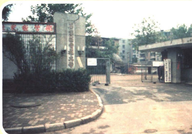
合校后的石家庄职业技术学院