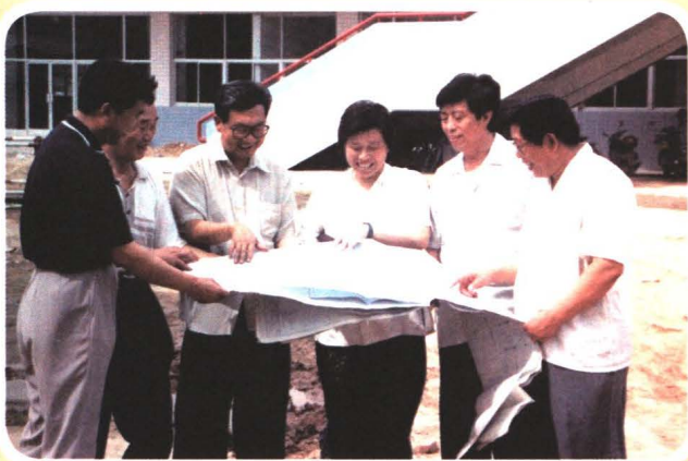
1998年7月7日，校领导视察新校址， 共同研究学校发展规划