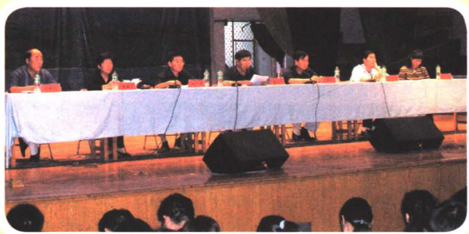
2004年，石家庄职业技术学院第一次党代会选举产生第一届党委委员