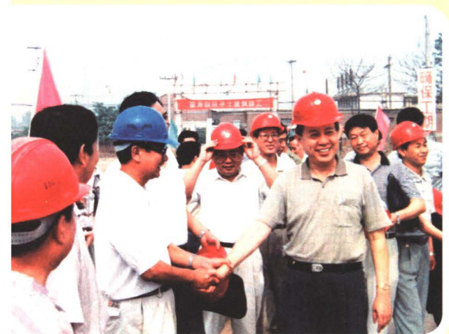
1996年，时任河北省常委、石家庄市委书记赵金铎到我院视察