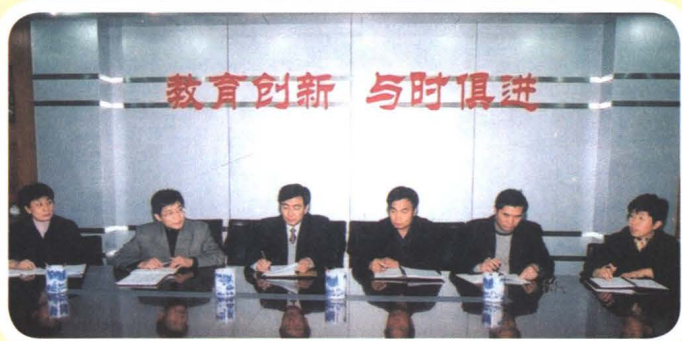
2008年，石家庄职业技术学院第二次党代会选举产生第二届党委委员