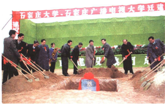
1995年11月，学院举行新校奠基仪式