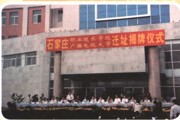
1998年9月25日，新校迁址揭牌仪式