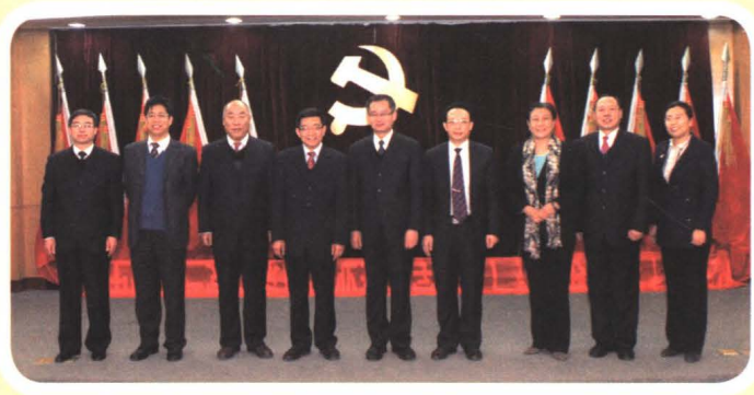
2013年，石家庄职业技术学院第三次党代会选举产生第三届党委委员