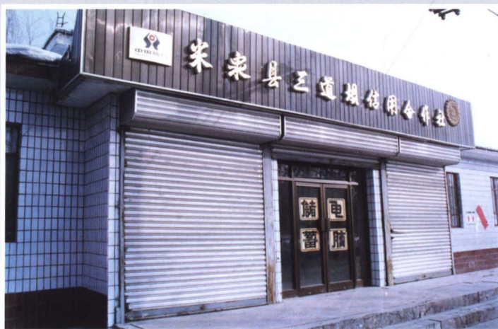
1997年，米泉县三道坝信用社营业办公用房