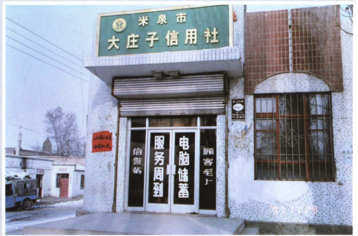
1997年，米泉县大庄子 信用社营业办公用房