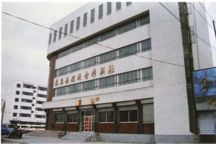
1997年，米泉县联社综合办公楼（一楼为联社营业部）