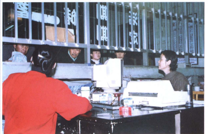
1997年11月30日，米泉 县联社营业部员工在为群 众办理业务