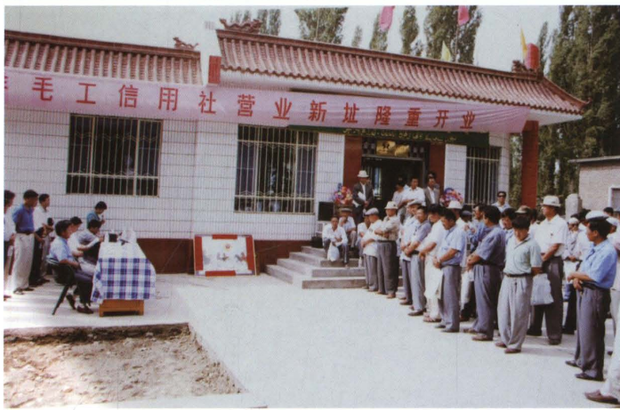
1999年8月8日，米泉县 羊毛工信用社开业庆典