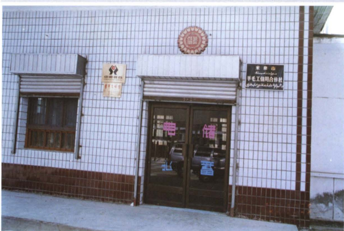
1997年，米泉县羊毛工信用社营业办公用房