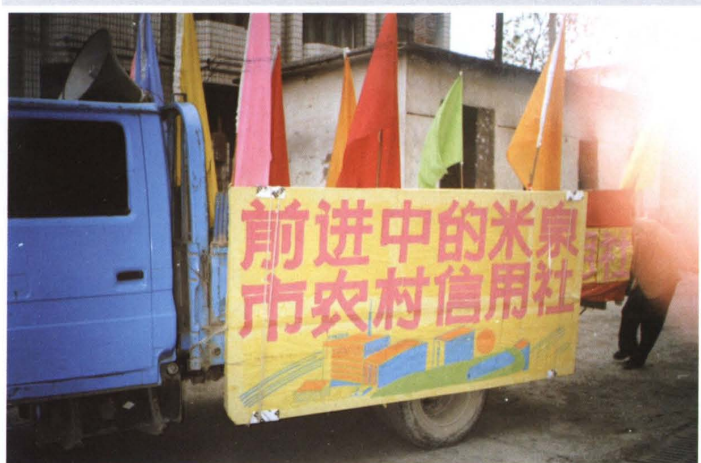
1998年6月，米泉县联合社综合业务宣传车