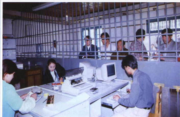
2000年12月4日，米泉县铁厂沟信用社员工在为群众办理业务