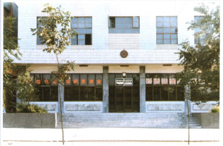
1997年，米泉县古牧地信用社营业办公用房