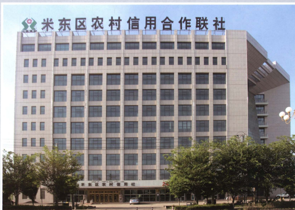
2013年，米东区联社办公楼