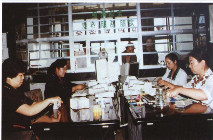
1997年11月30日，米泉县古牧地信用社员工在为群众办理业务