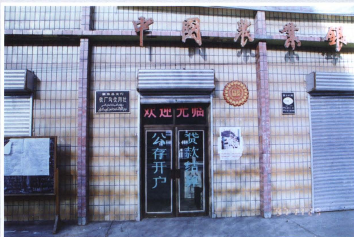
20世纪80年代初期，米泉县长山子信用社营业办公用房