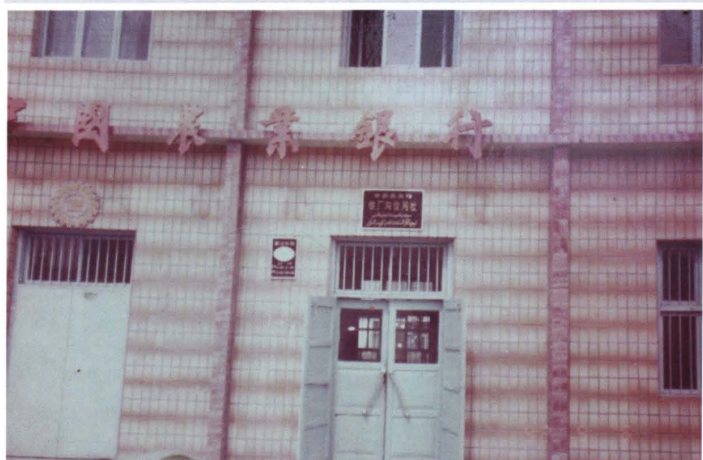
20世纪80年代，米泉县铁厂沟信用社营业办公用房