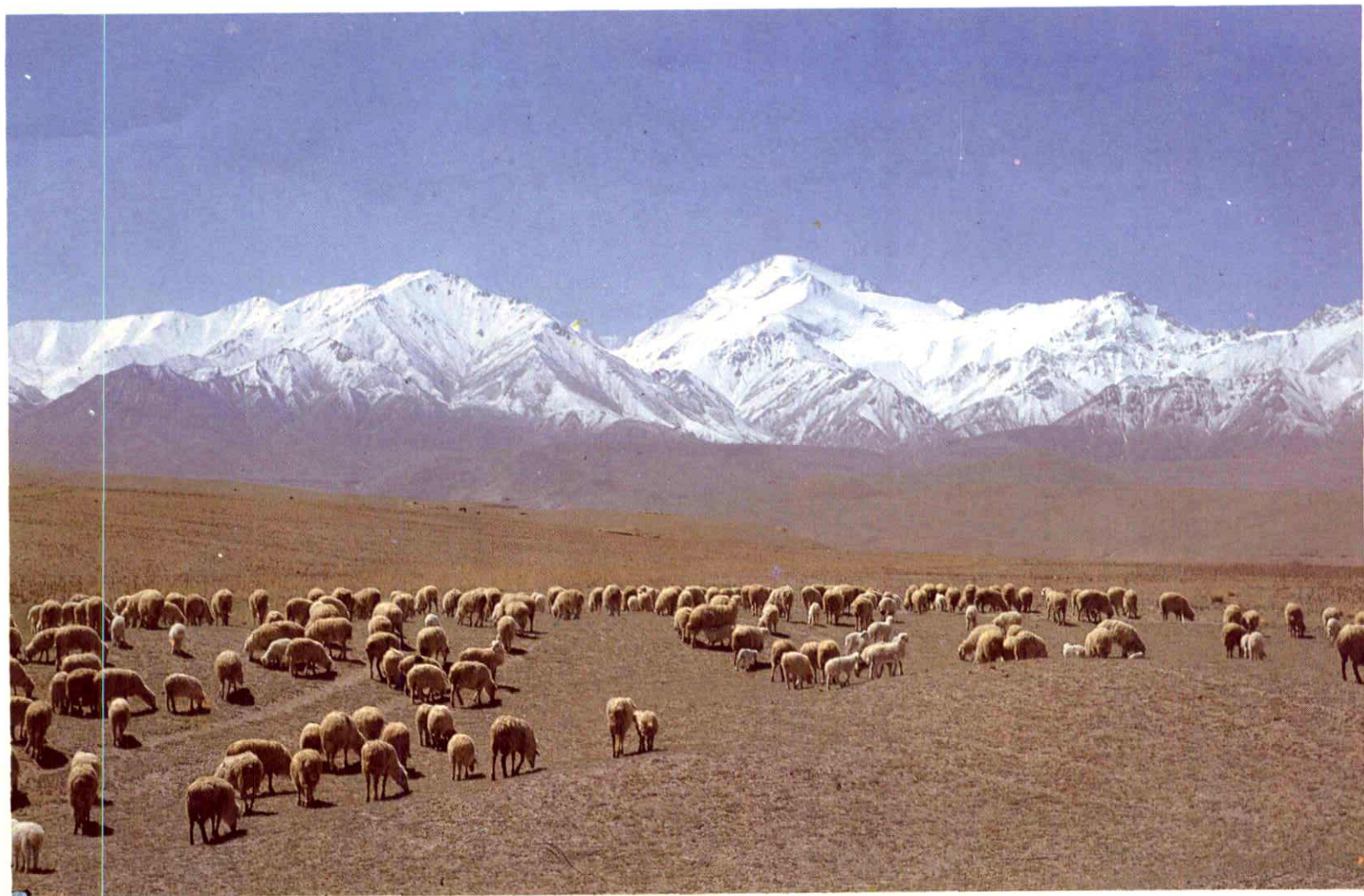
11. 放牧在昆仑山下的和田羊群