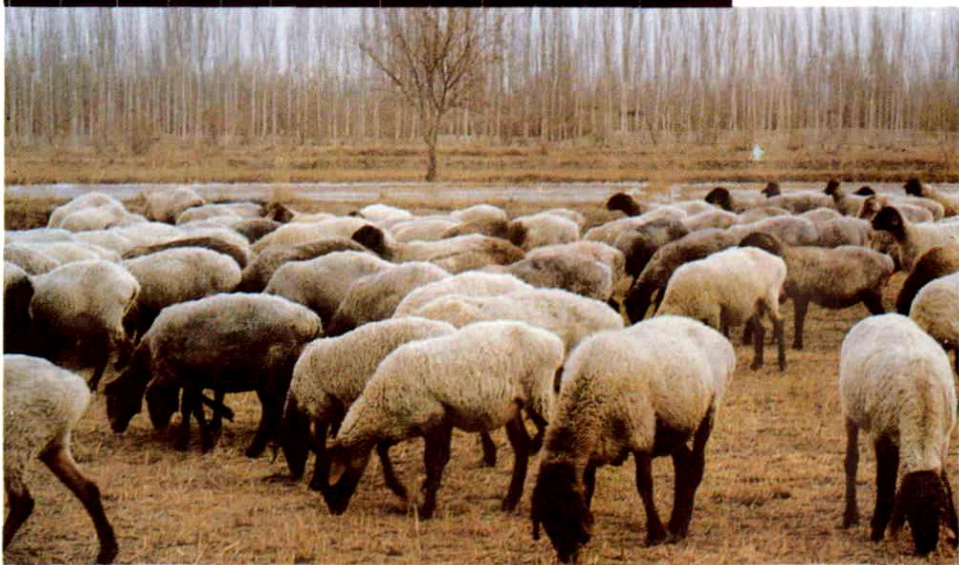
17. 放牧在田间地头的多浪羊群