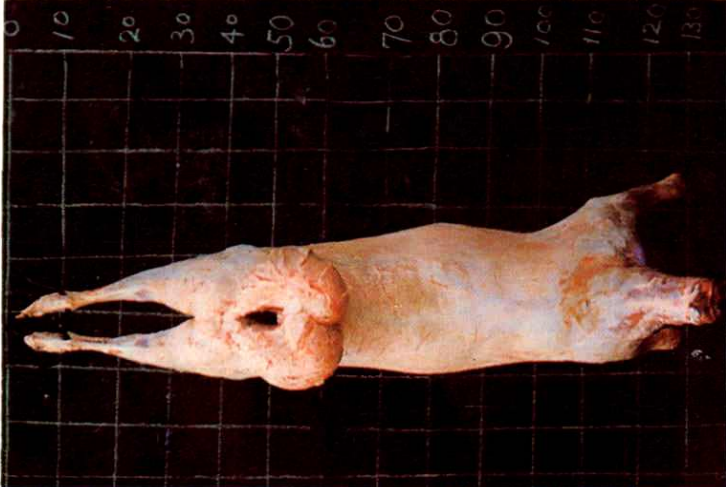
18 · 多浪羊羔羊胴体