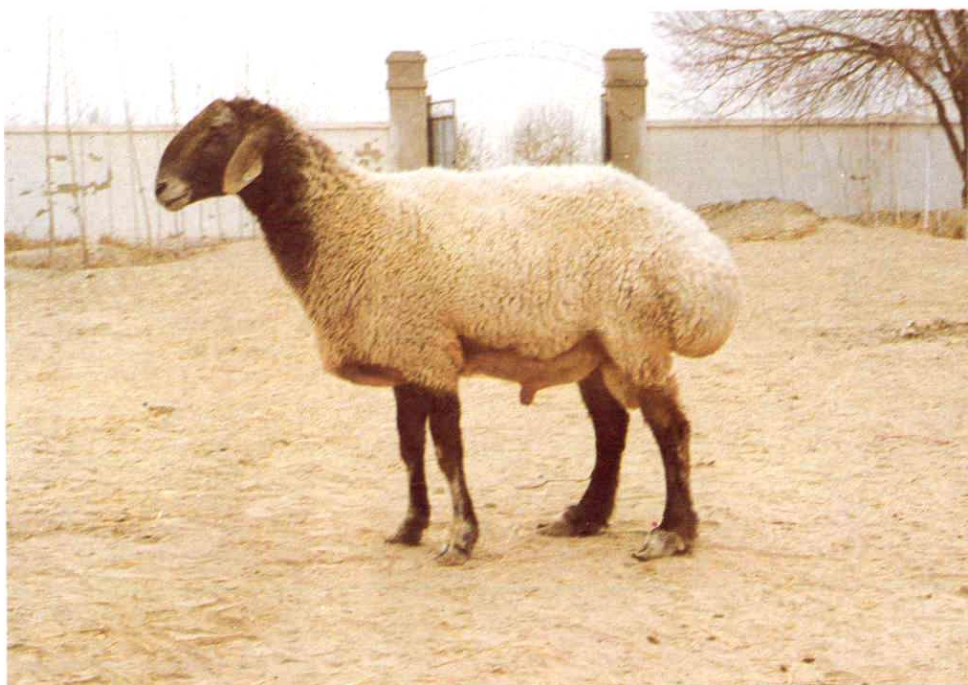
14. 多浪羊成年种公羊