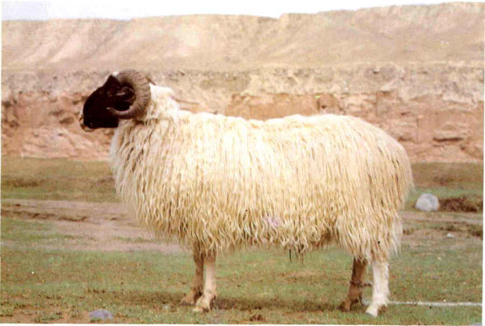
9. 和田羊成年种公羊 (黑头白身)