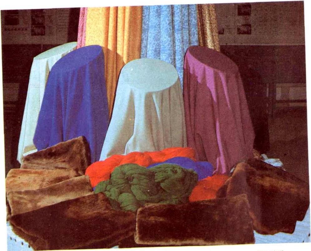
4. 用新疆细毛羊的皮与毛制成的各种产品