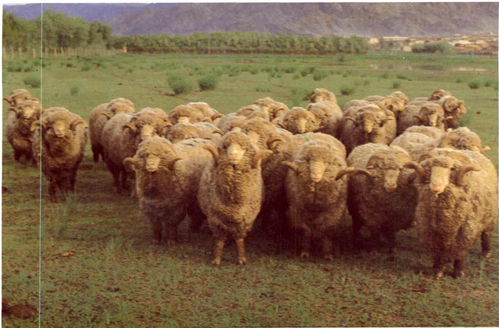
5. 著名的巩乃斯种羊场饲养的种公羊