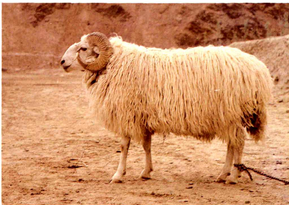
7. 和田羊成年种公羊 (全身白色)