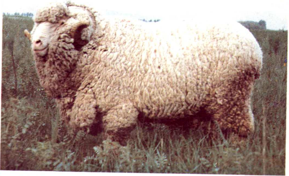
1. 新疆细毛羊成年种公羊