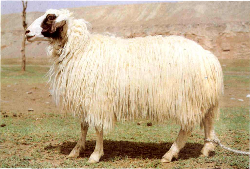
10. 和田羊成年母羊 (黑头白身)