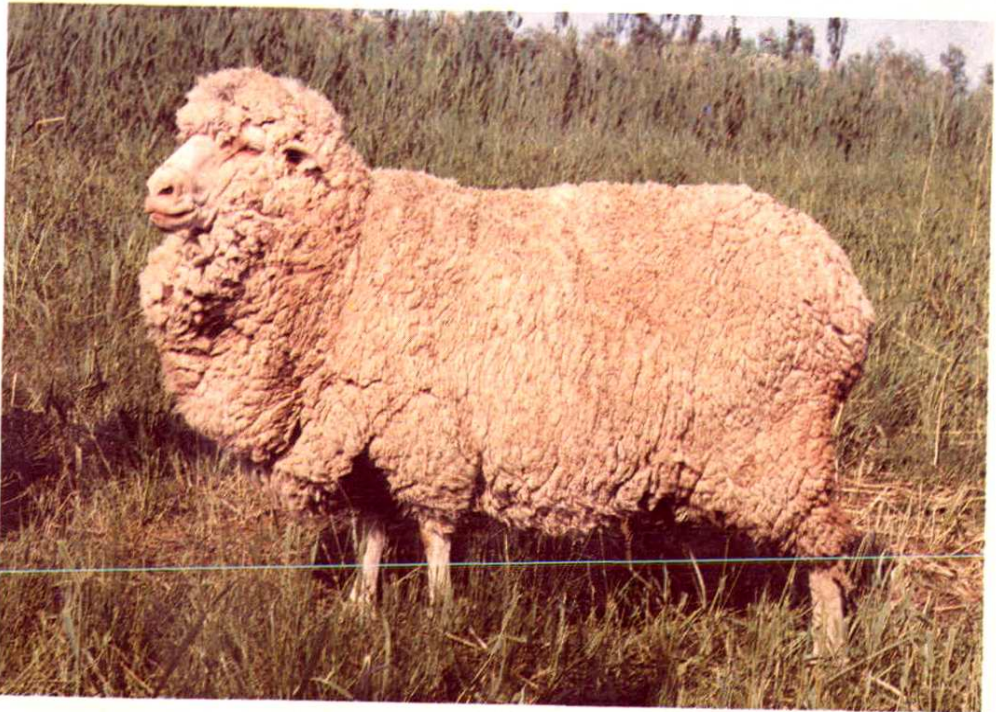
2. 新疆细毛羊成年母羊