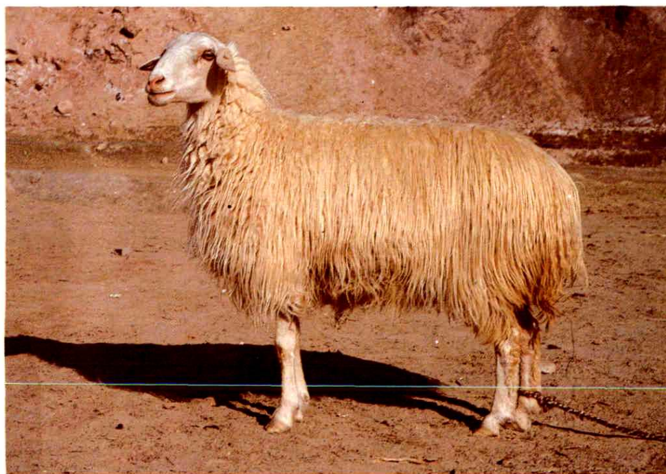
8. 和田羊成年母羊 (全身白色)