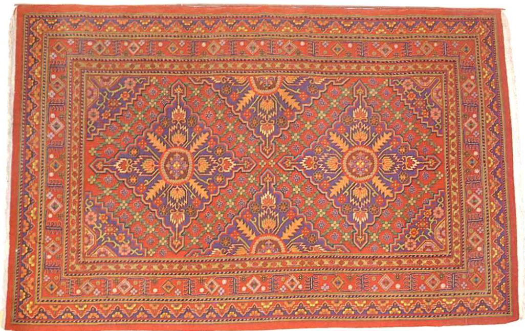
12. 用和田羊毛织出的驰名中外的和田地毯