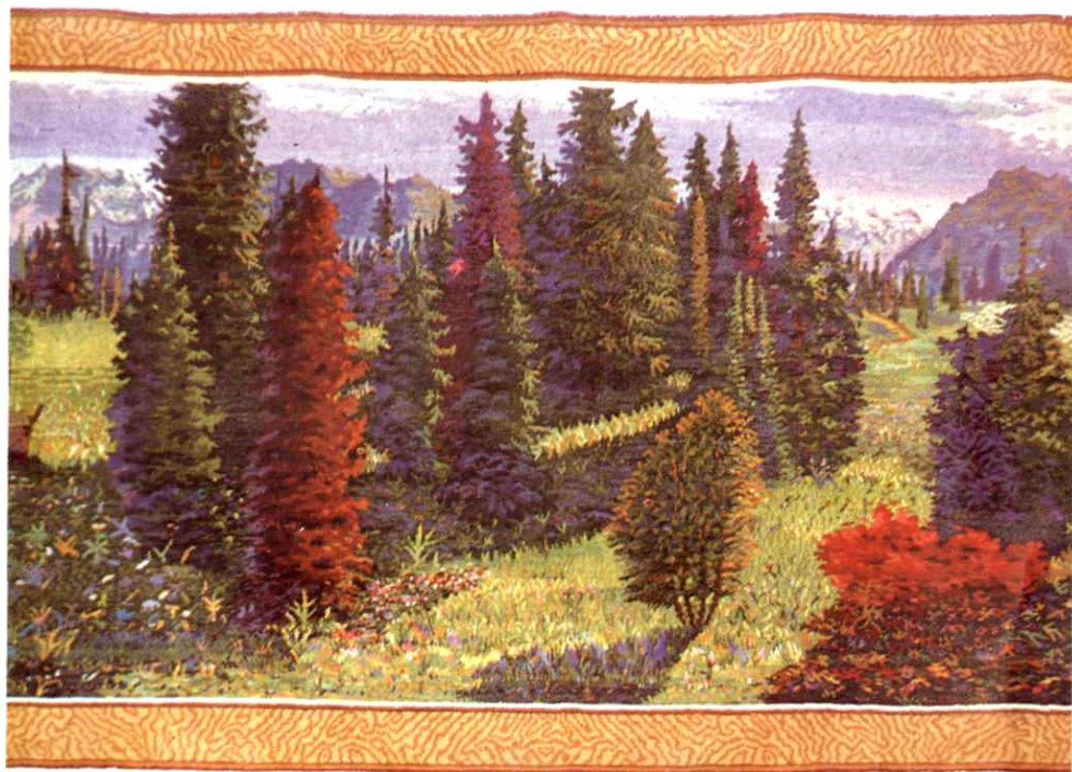
13. 用和田羊毛织出的驰名中外的和田地毯