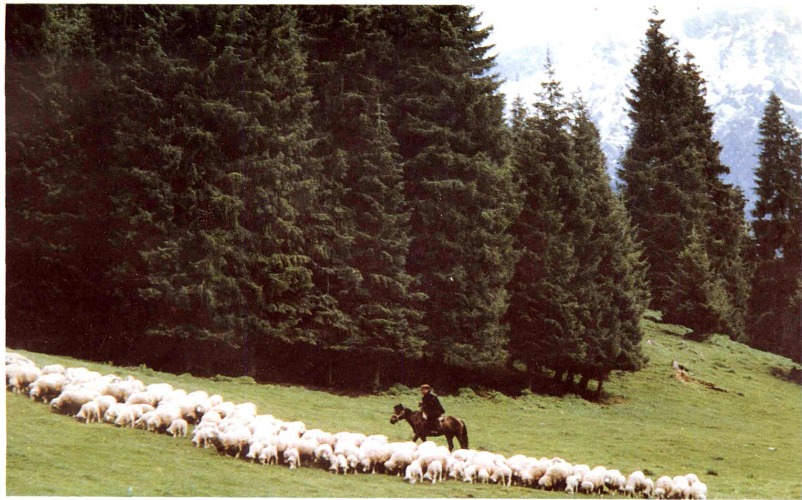
6. 放牧在天山夏季牧场的新疆细毛羊羊群