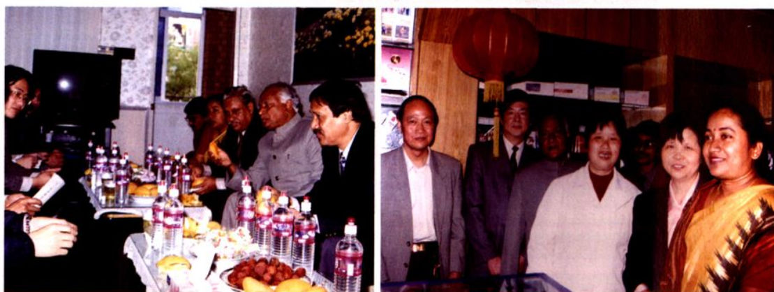
2000年4月，孟加拉国青联代表团在南汇考察计划生育工作。