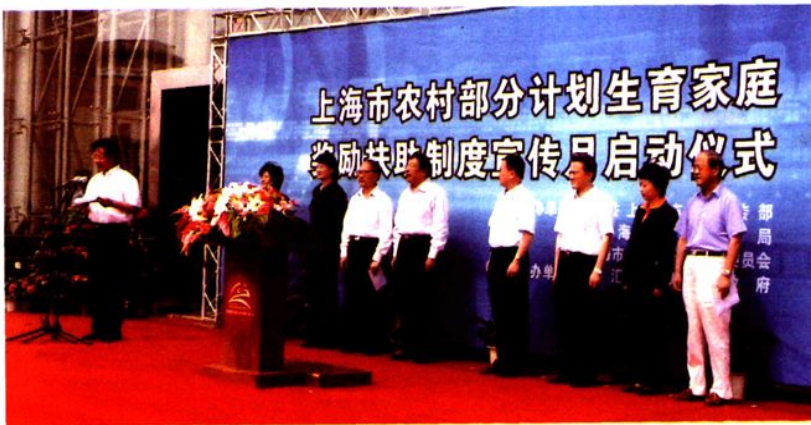
2005年6月9日，上海市农村部分计划生育家庭奖励扶助制度宣传月启动仪式在南汇举行。副市长杨晓渡（右五）出席仪式并讲话。