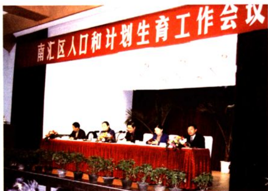
2002年，区人口和计划生育工作会议。