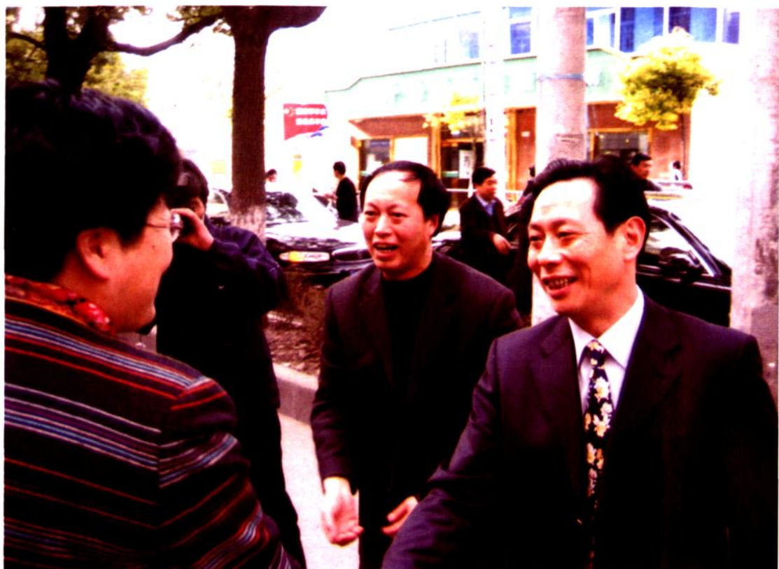
2007年，国家人口计生委副主任江帆（右一）视察惠南镇人口和计划生育综合服务站。