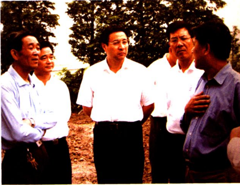
2001年，上海市常务副市长冯国勤（中）视察南汇三峡移民安置工作。