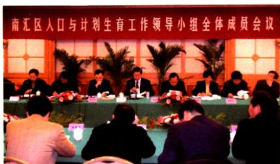
2002年，区人口与计划生育工作领导小组全体成员会议。