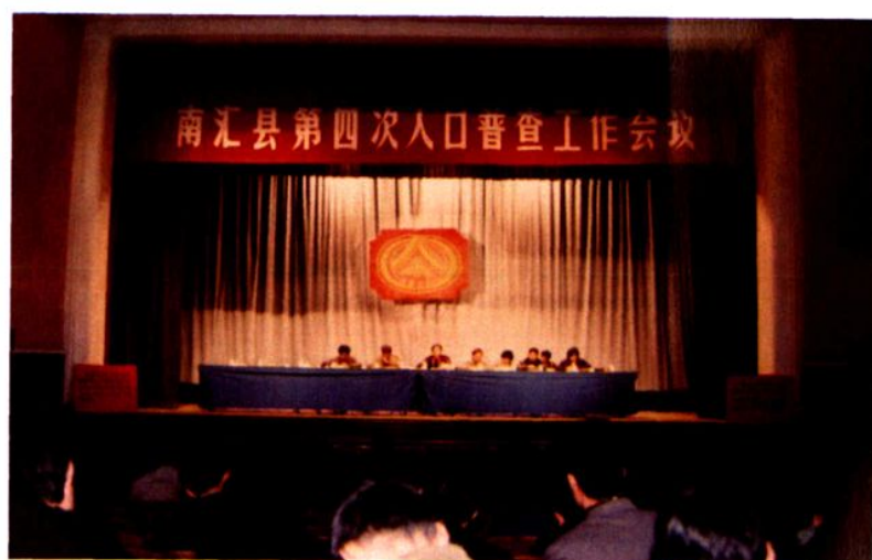
1990年5月，南汇县第四次人口普查工作会议在惠南镇召开。