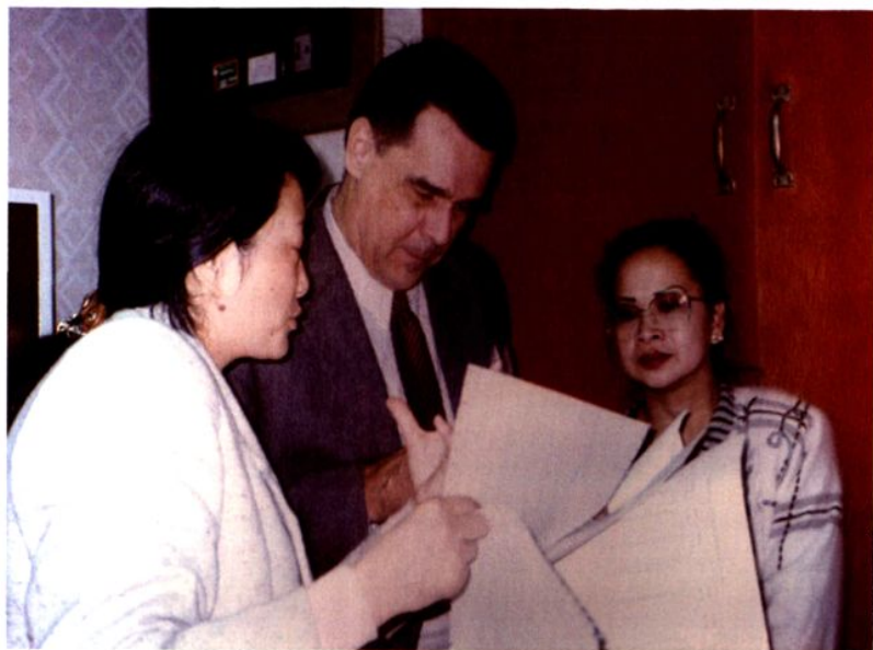
1995年，联合国人口基金会官员在南汇了解人口情况。