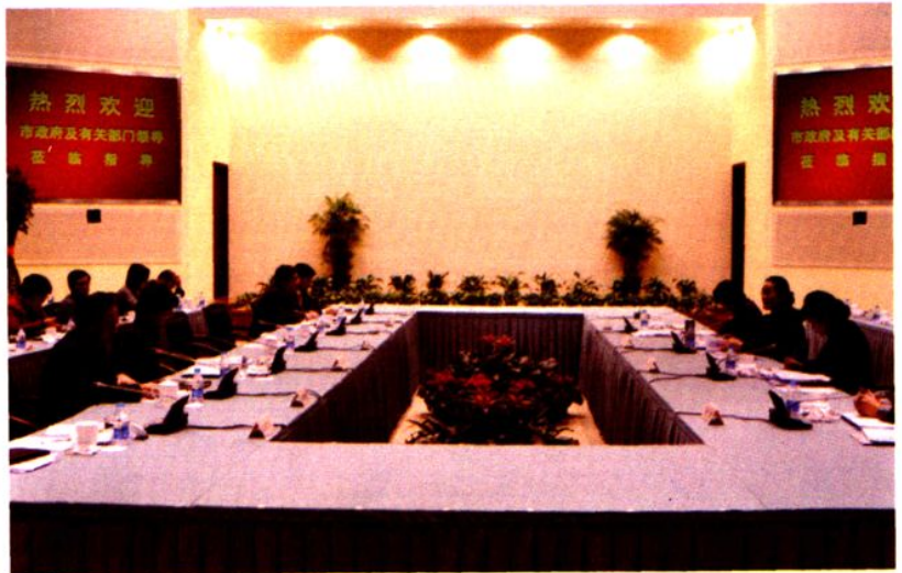
2008年，上海市副市长赵雯（右二）调研南汇人口和计划生育工作。