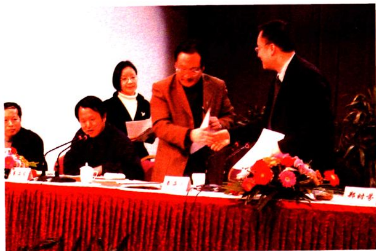
区委书记戴海波（右一）出席区人口和计划生育工作会议。