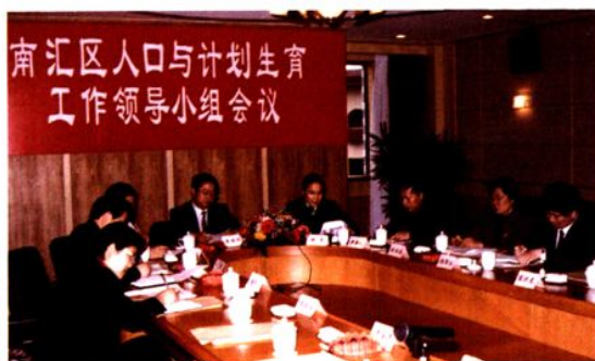
2002年，区人口与计划生育工作领导小组会议。