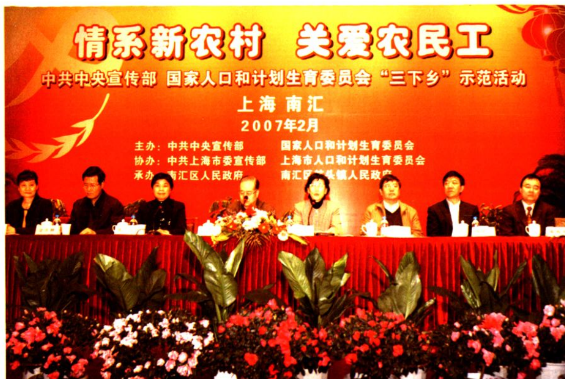
2007年2月10日，由中共中央宣传部、国家人口计生委联合举办的“三下乡”活动在航头镇举行。国家人口和计划生育委员会主任张维庆（左四）、上海市副市长杨定华（右四）出席。