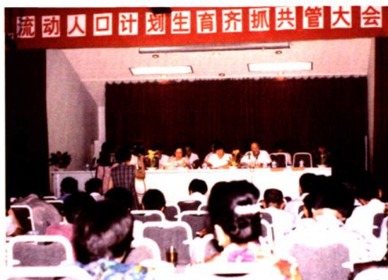
1993年，县流动人口计划生育齐抓共管大会。