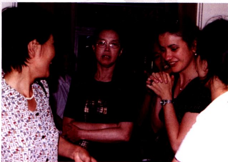
2001年6月21日，知情选择项目外国专家组美国教授在南汇考察惠南镇计划生育生殖保健综合服务站。