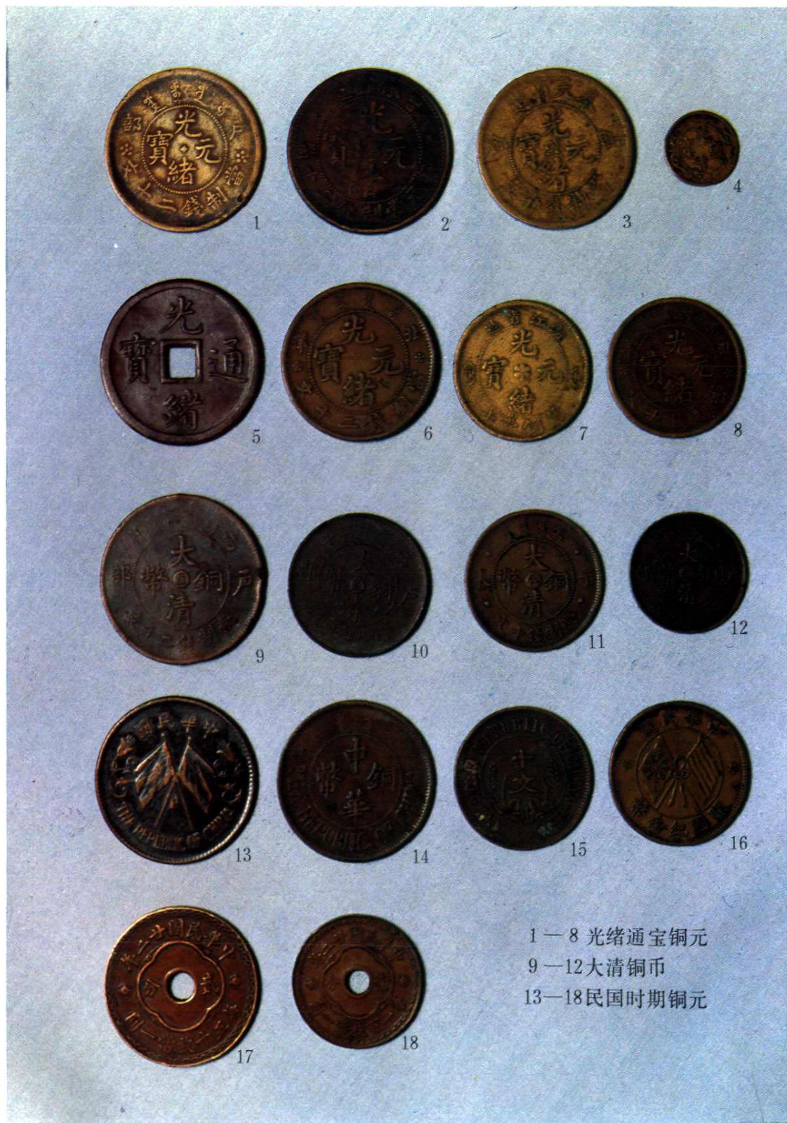
1—8 光緒通寶銅元 9—12 大清銅元 13—18 民國時期銅元