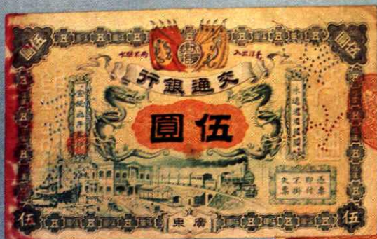
15.3 × 9.2 (cm)