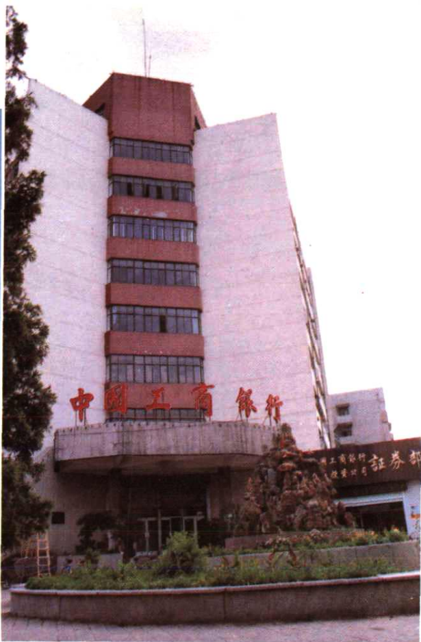
中国工商银行秦皇岛中心支行