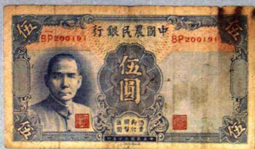
14.3 × 7.8 (cm)