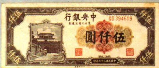
15.5 × 6.4 (cm)