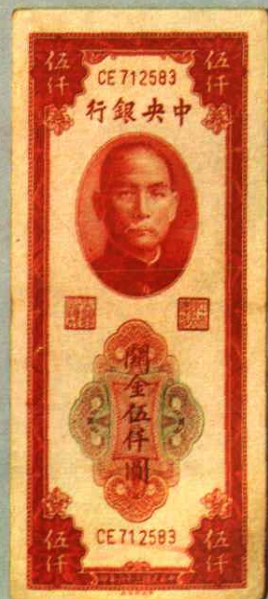
7.3 × 16.4 (cm)

1924年，孙中山先生为调节金融，活跃经济，在广州设立“中央银行”，代理国库，发行货币，履行国家银行的职能。1928年，国民党政府在上海重设中央银行。