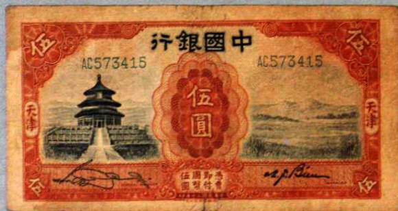
16.5 × 8.3 (cm)

辛亥革命成功，大清銀行於 1912年2月改組成中國銀行。1928 年國民黨政府指定為特許的國際匯 兌銀行，逐漸成為官僚資本銀行之 一。解放後成為人民政府外匯專業 銀行。