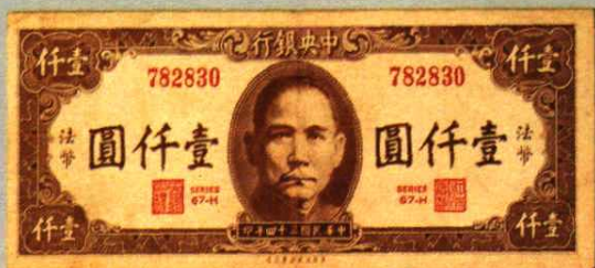
15.3 × 6.6 (cm)