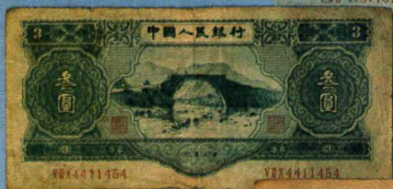
中国人民银行叁元 (1953年) 井岗山龙源口图 16 × 7.2 (cm)