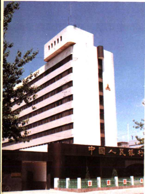
中国人民银行秦皇岛分行