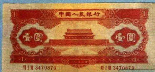
中国人民银行壹元 (1953年) 天安门图 15 × 6.8 (cm)