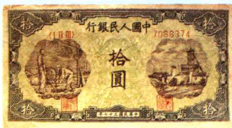
12.1 × 6.4 (cm)