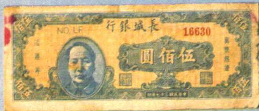
14.9 × 6 (cm)