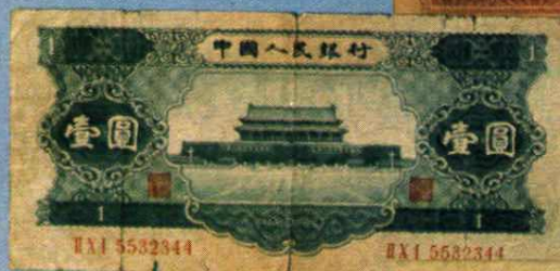
中国人民银行壹元 (1956年) 天安门图 15 × 6.7 (cm)