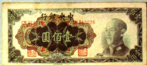
14.6 × 6.2 (cm)