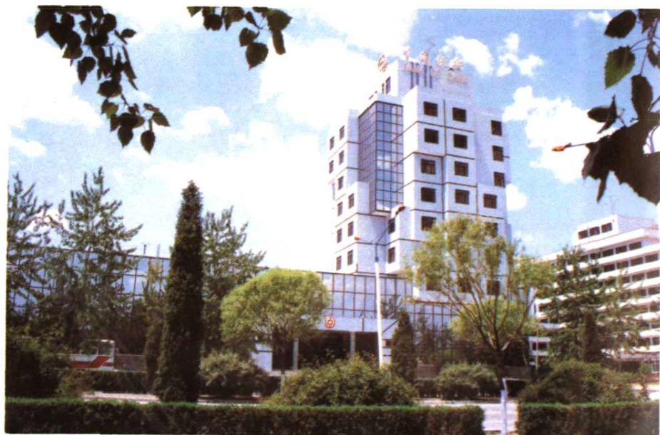
中国银行秦皇岛分行