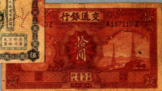
15.8 × 8.5 (cm)