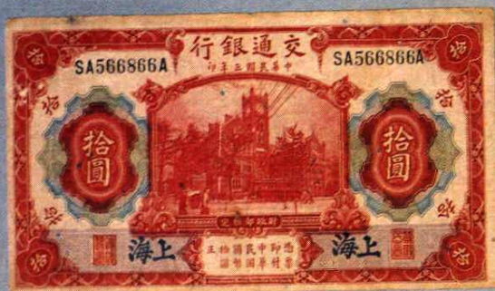
15.8 × 85 (cm)