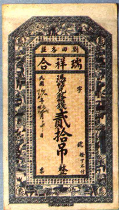
10.7 × 18.5 (cm)

民国成立以后，各省财政艰窘，筹措无着，均以发行纸币作为筹款的唯一办法。另外，地方的其它机构也都根据各自的需要发行钞票。民国十七年(1928年)直隶省改为河北省后，翌年三月，成立河北省銀行，该省金融机构先后曾发行过银两票、银元票、铜元票等。右图为卢龙县刘田各庄钱庄的钱票。