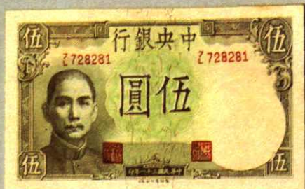
12.3 × 7.4 (cm)