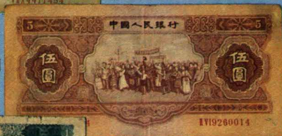
中国人民银行伍元 (1953年) 各族人民大团结图 16.5 × 7.5 (cm)