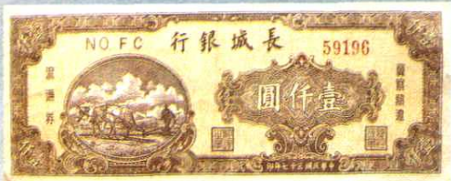
15.5 × 6.4 (cm)

1948年2月，东北行政委员会冀察热辽办事处为统一货币发行，决定设立“长城银行”为该解放区最高国家银行机关，负责发行和管理“长城券”，使之成为全区法定的货币。“长城券”发行后，该地区原来流通的“冀热辽边币”和“热河省银行币”不再继续发行，但“冀热辽边币”以五比一、“热河省银行券”以一比一的原规定比值继续流通。