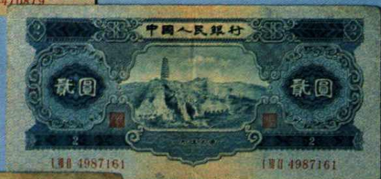
中国人民银行贰元 (1953年) 延安宝塔山图 15.5 × 7 (cm)