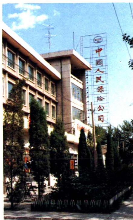
中国人民保险公司秦皇岛市中心支公司