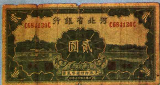
15.5 × 7.8 (cm)