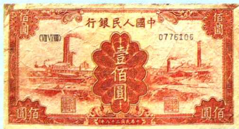
13.3 × 6.95 (cm)

在毛泽东为代表的中国共产党的正确领导下,解放战争迅速胜利发展。到1948年秋天,各个解放区多已连成一片,全国胜利在望。为适应新形势的要求,中国共产党于1948年12月1日,在“北海银行”、“华北银行”和“西北农民银行”的基础上,成立了统一的中国人民银行。中国人民银行当年发行人民币,并陆续收回各解放区的地方性货币,禁止一切外币、金银在市场上流通和买卖,并尽速清除了国民党政府发行的各种货币。中华人民共和国成立后,1951年4月中央人民政府政务院决定收回“东北银行”和“内蒙古人民银行”所发行的流通券,同年11月,又统一了新疆币。从此以后,人民币就成了新中国集中统一、唯一合法的货币。