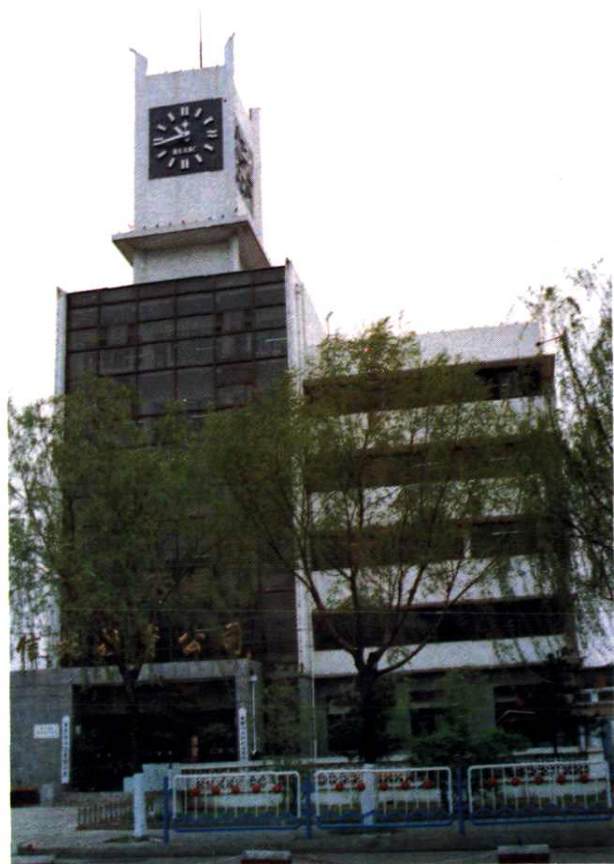
秦皇岛市信托投资公司