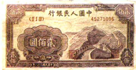
13.5 × 6.9 (cm)