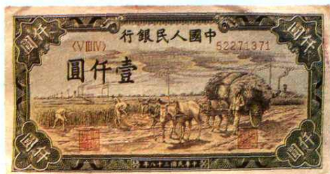
13.4 × 7 (cm)