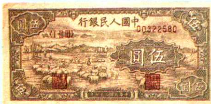
11.6 × 5.5 (cm)