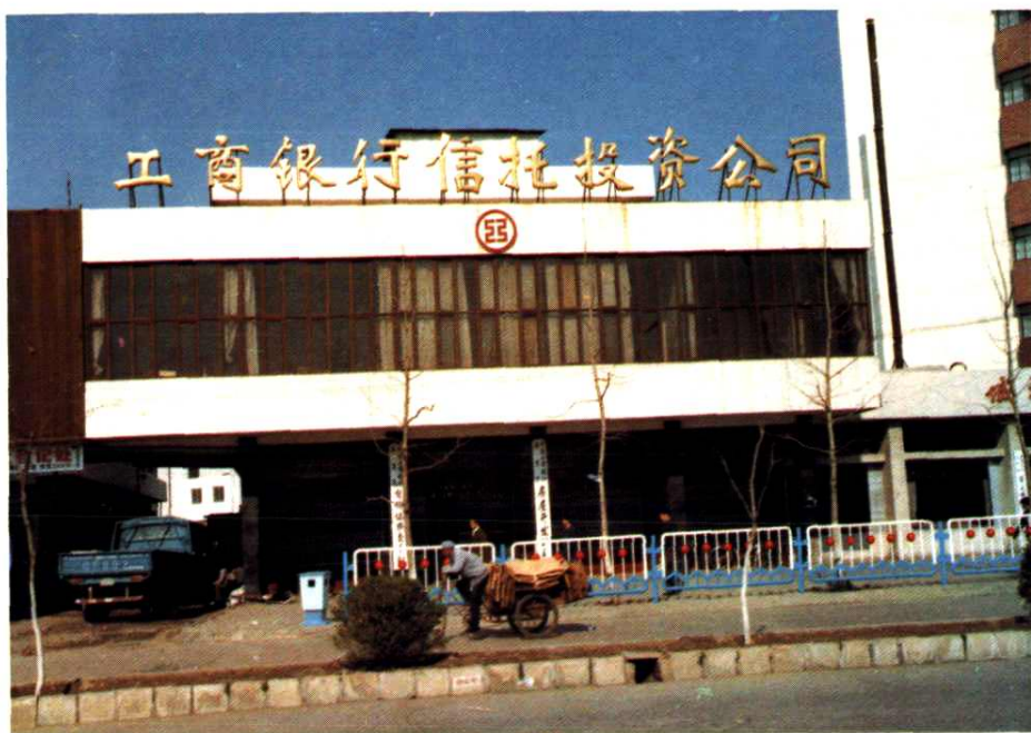
中国工商银行秦皇岛信托投资公司