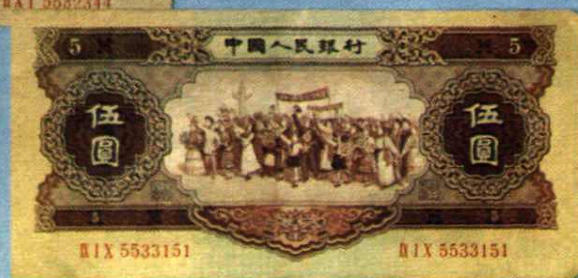
中国人民银行伍元 (1956年) 各族人民大团结图 16.5 × 7.5 (cm)