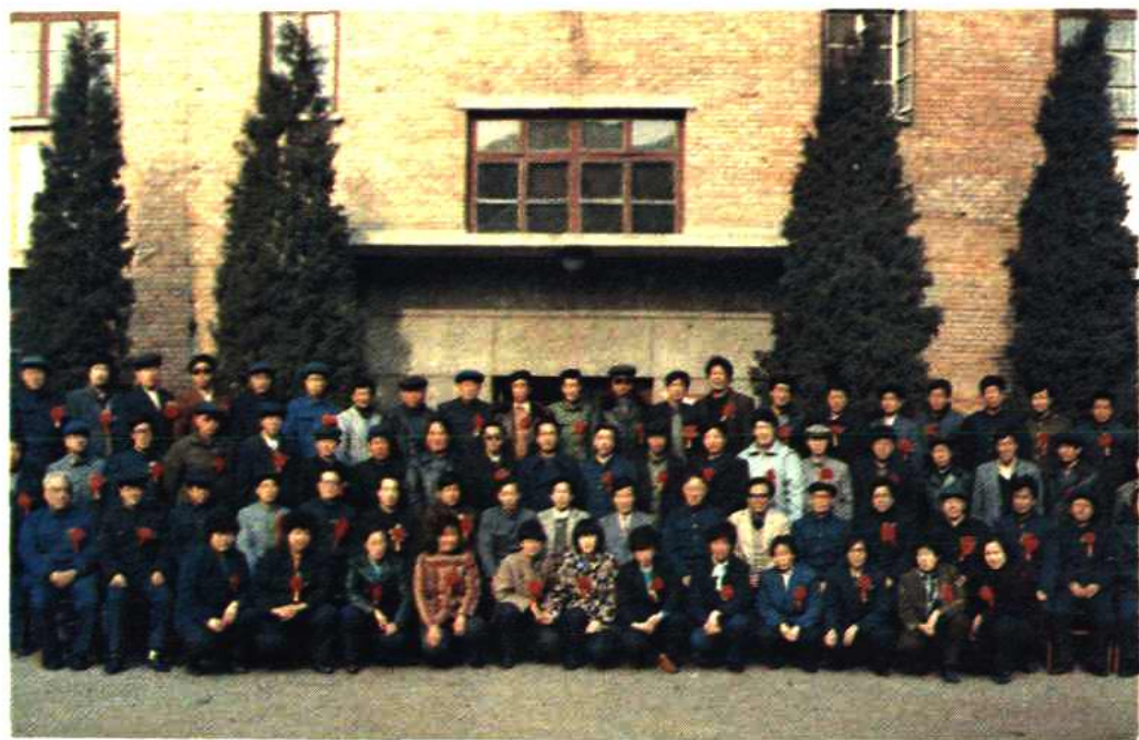
保定市物资系统1988年先进工作者和先进集体代表