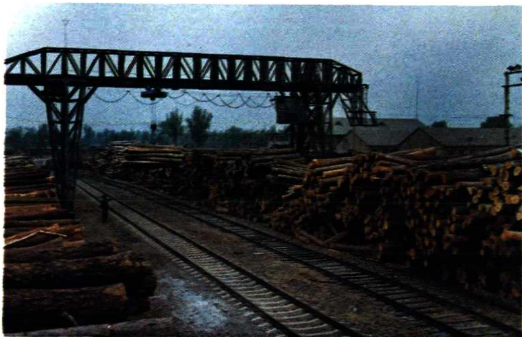
保定木横担厂木材仓库