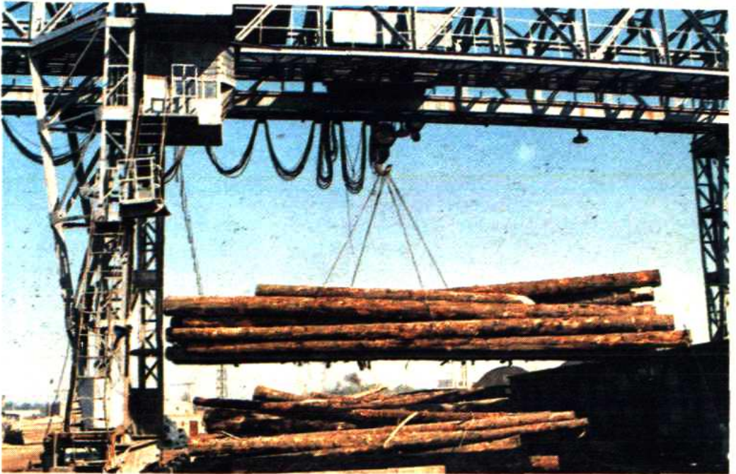
保定市木材公司仓库