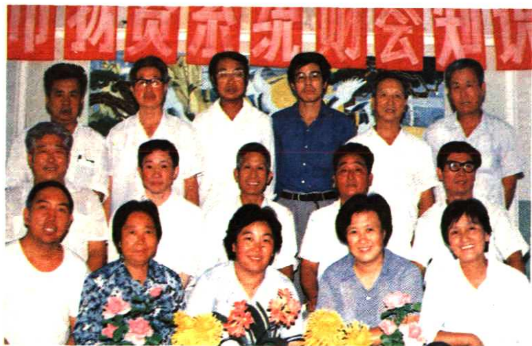
物资系统财会人员知识竞赛