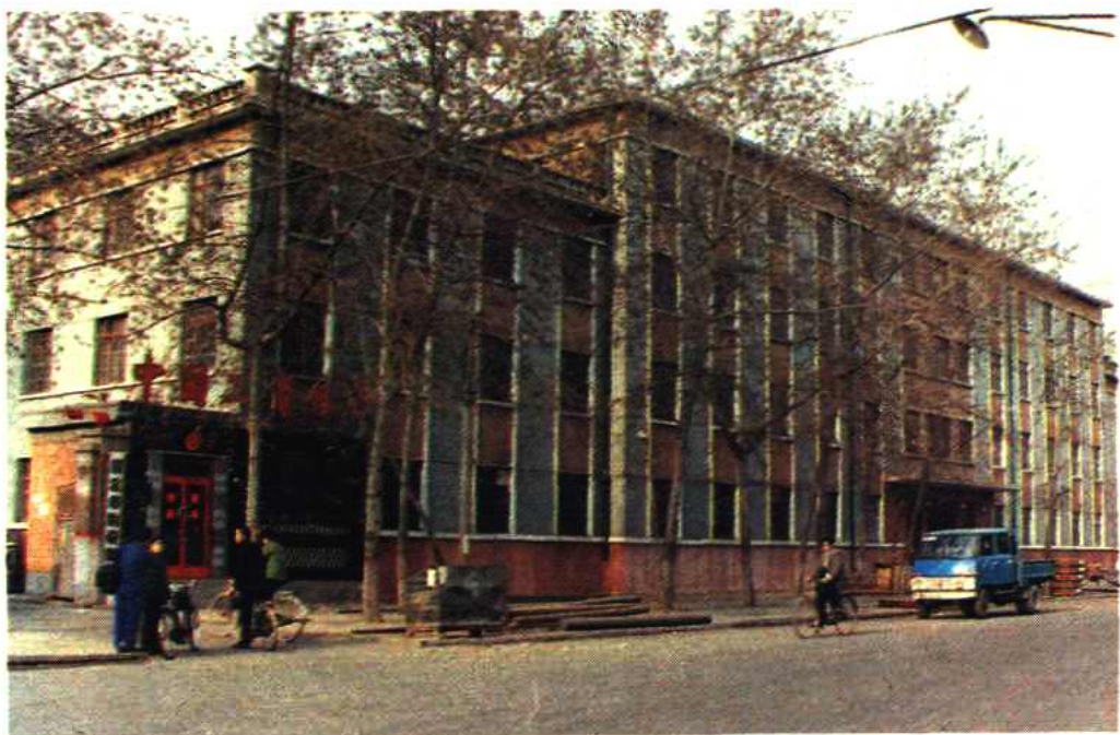
保定市物资局机关