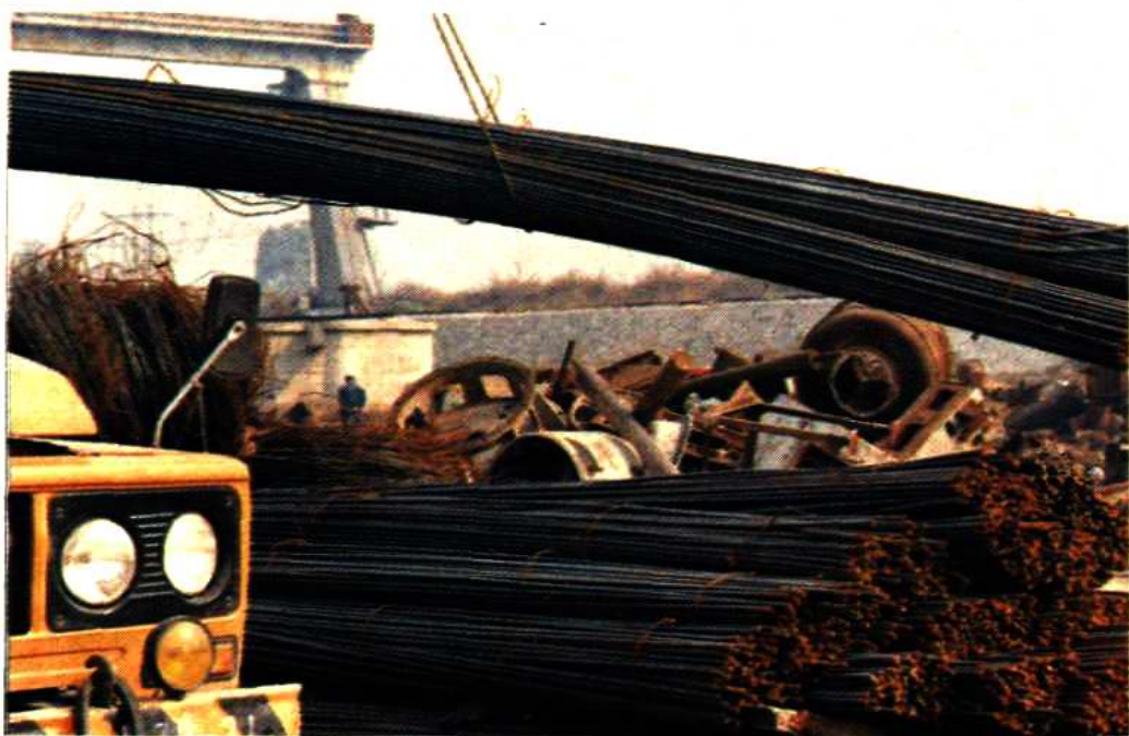
保定市金属回收公司仓库