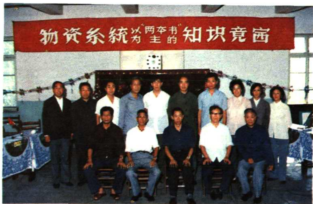
物资系统学习“两本书”知识竞赛