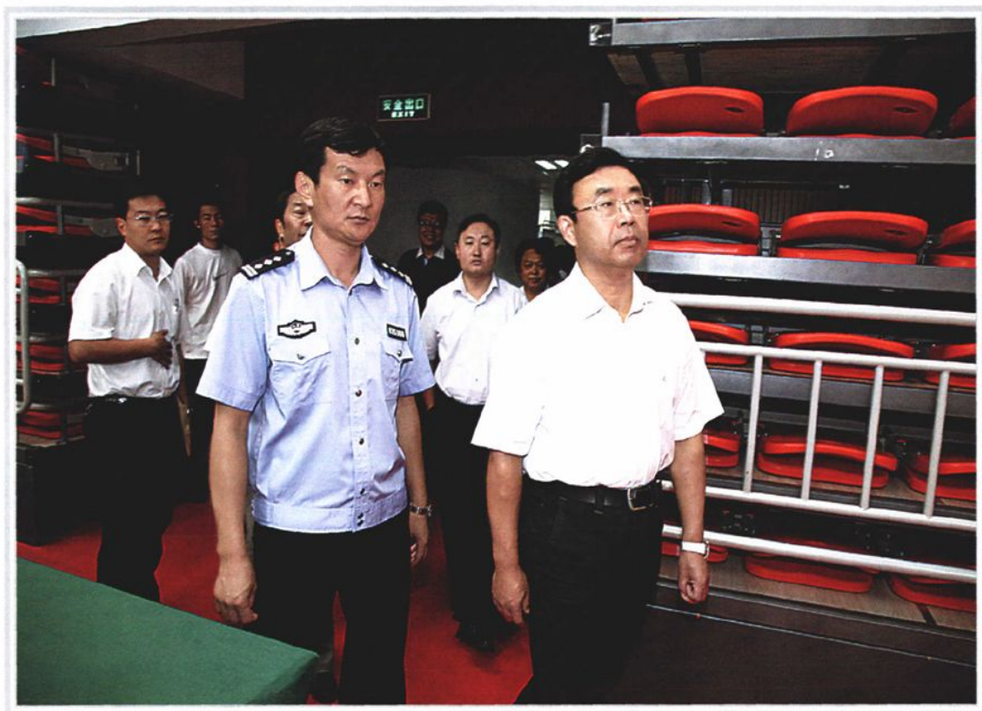
2009年9月1日，山东省副省长黄胜（右一）来滕州检查指导全国第十一届运动会安全保卫工作