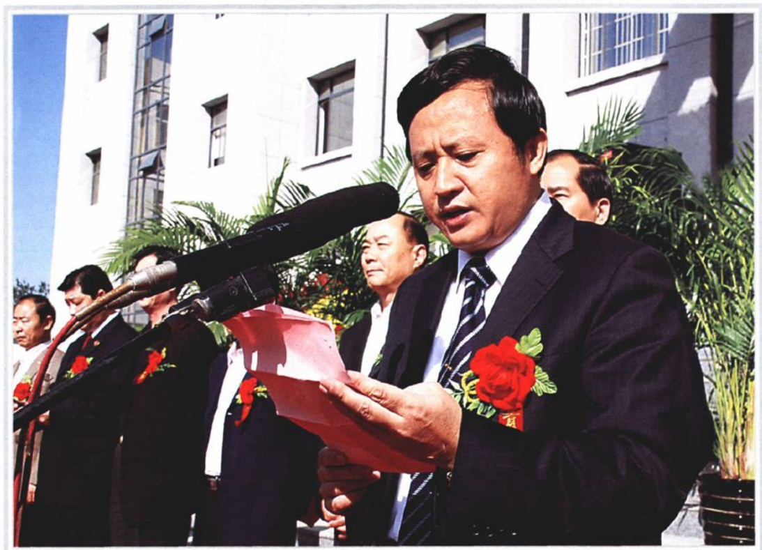
2008年10月23日，中共滕州市委副书记、滕州市人民政府市长王刚（右一）在全市预防职务犯罪警示教育基地、市人民检察院信息综合楼启用仪式上讲话