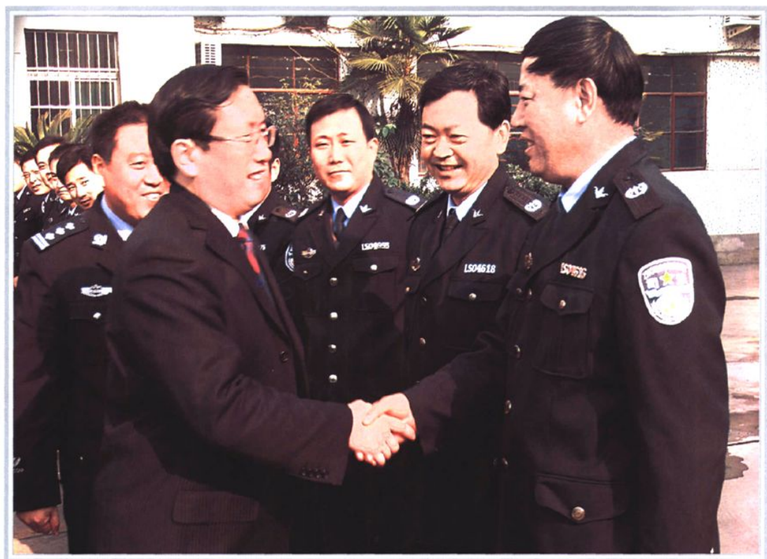
2006年12月19日，中共枣庄市委常委、滕州市委书记王忠林（左一）检查司法行政工作