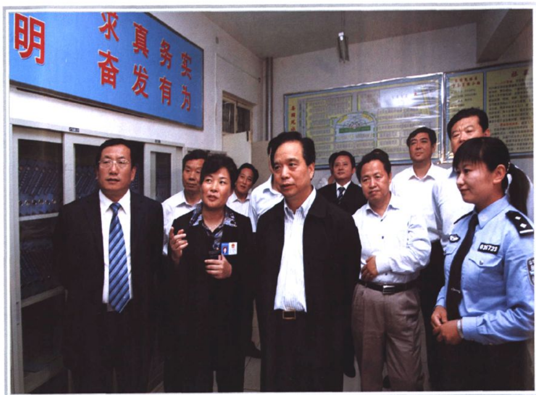
2007年5月13日，时任中共山东省委书记李建国（中）来滕检查指导政法工作