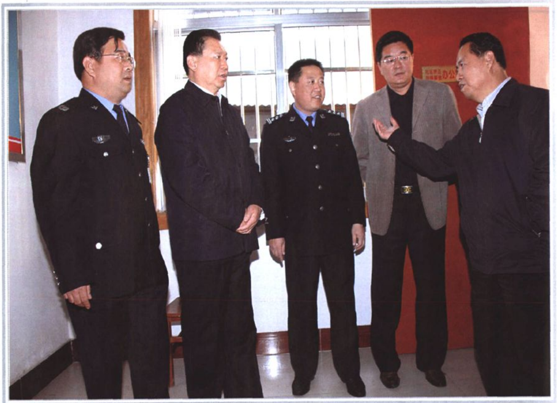
2008年11月11日，中共山东省常委、政法委书记柏继民（左二）来滕州检查指导司法行政工作