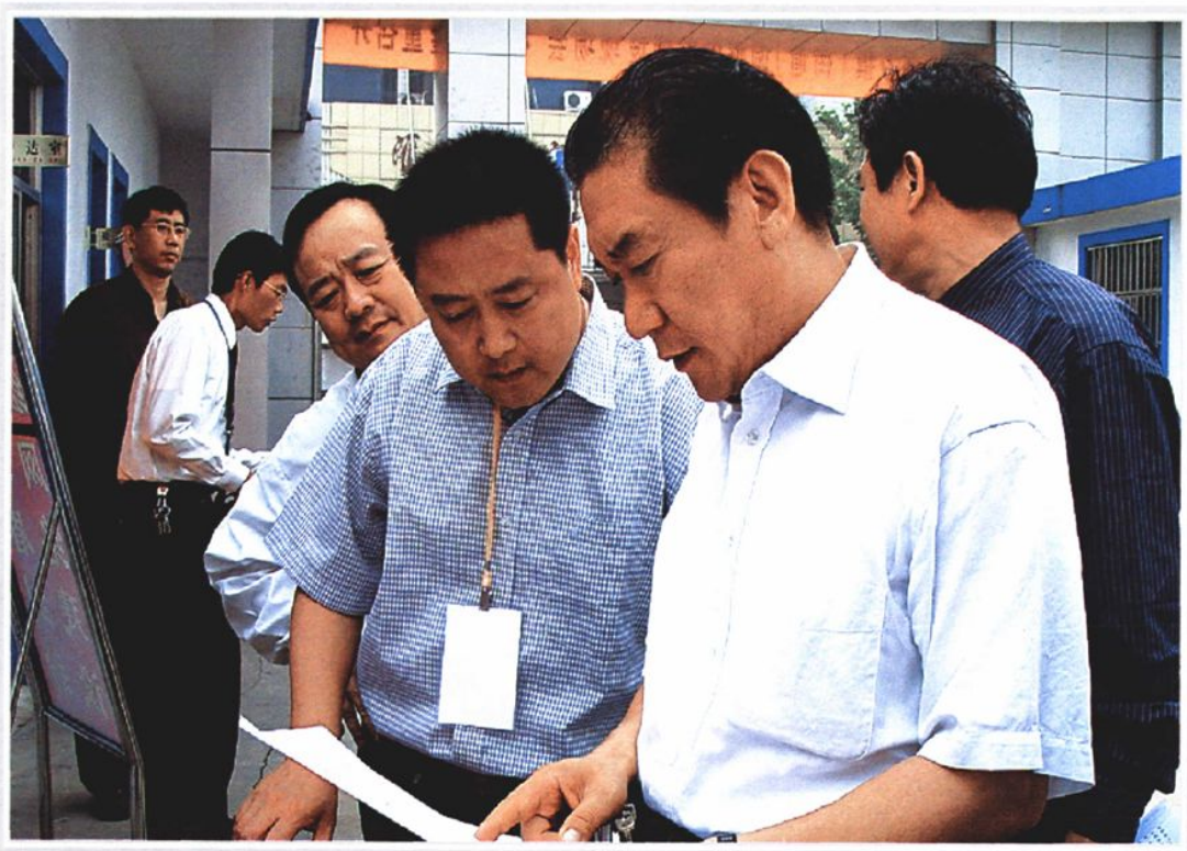
2004年9月27日，中共山东省委书记高新亭（右一）来滕州检查指导社会矛盾调处工作