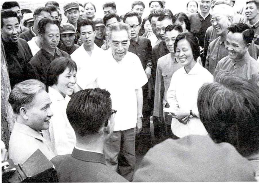
1973年6月9日，国务院总理周恩来视察延安， 在枣园与群众交谈，省公安、警卫干警现场警卫