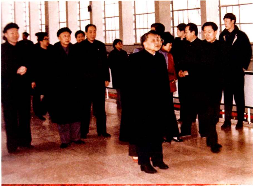
1986年2月16日，中央军委主席邓小平 视察宝鸡火车站，省公安、警卫干警现场警卫