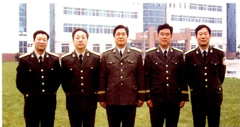
省公安厅警卫局现任领导班子集体合影