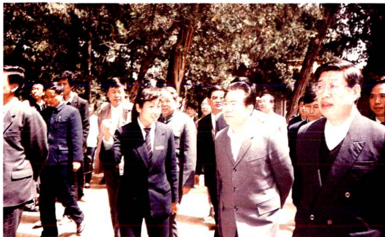
1990年4月13日，政协全国委员会主席李瑞环参观黄帝陵，省公安、警卫干警现场警卫