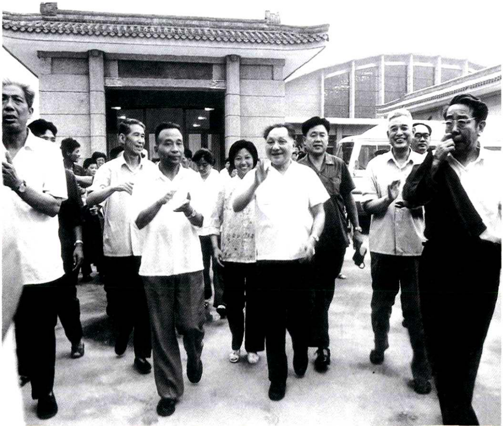
1980年7月1日，中共中央副主席邓小平参观秦兵马俑博物馆，省公安、警卫干警现场警卫