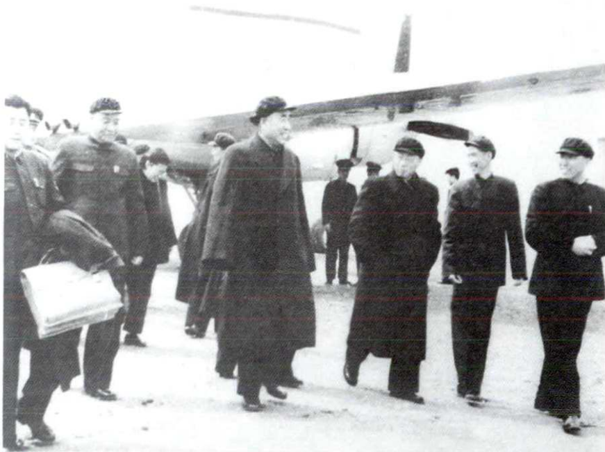
1957年3月21日，中共中央副主席朱德乘专机抵西安机场 步出停机坪，省公安、警卫干警现场警卫