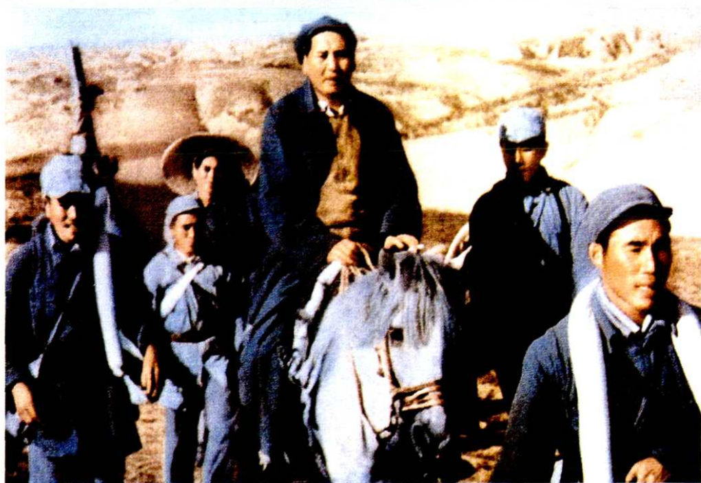
1947年春，中央警卫团战士护送中共中央主席毛泽东转战陕北