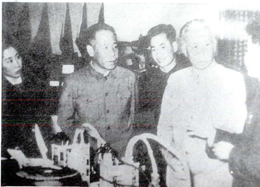
1960年4月28日，中华人民共和国主席刘少奇 视察长岭机器厂，省公安、警卫干警现场警卫