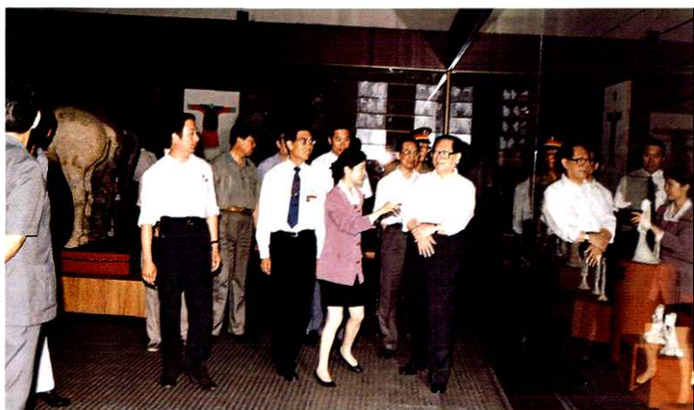
1993年6月13日，中共中央总书记、国家主席江泽民参观陕西省历史博物馆，省公安、警卫干警现场警卫

1999年6月18日，中共中央总书记、国家主席江泽民视察中国缝纫机集团有限公司，省公安、警卫干警现场警卫