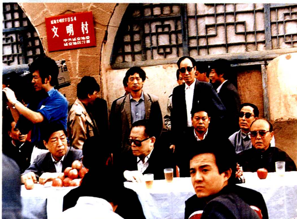
1989年9月11日，中共中央总书记江泽民视察延安南泥湾，省公安、警卫干警现场警卫