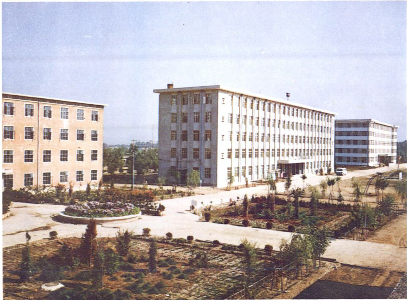
昭乌达蒙古族师范专科学校