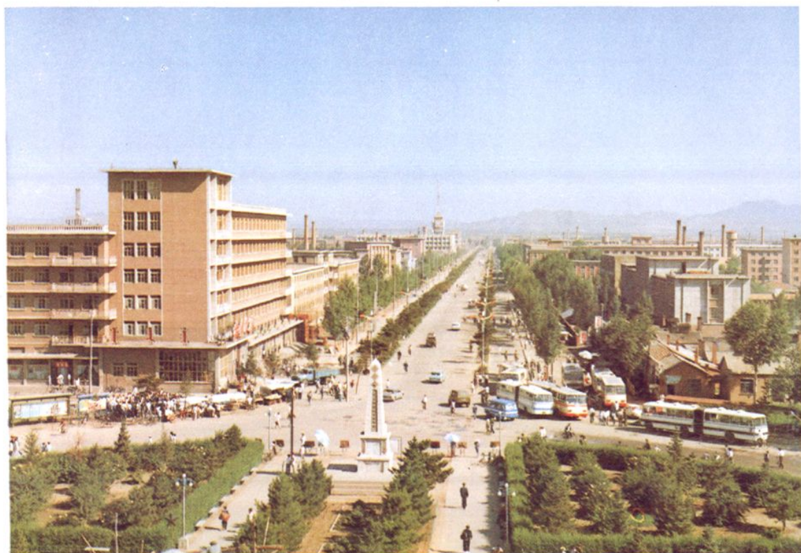
昭 乌 达 路