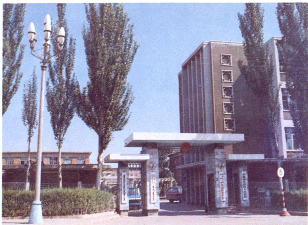
赤峰市红山区人民政府