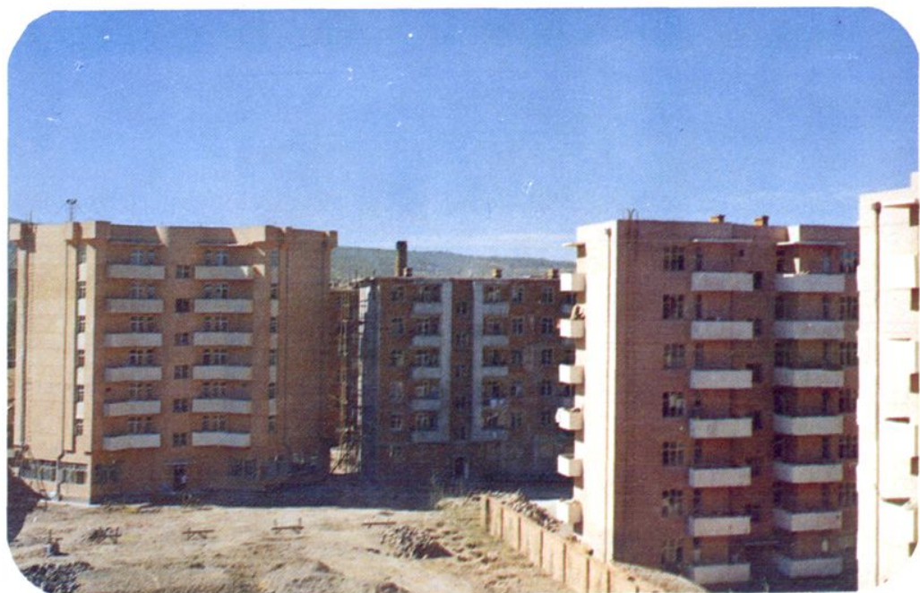
建设中的住宅小区