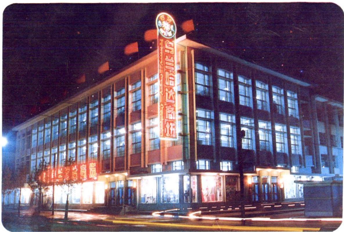
赤峰市人民防空办公室