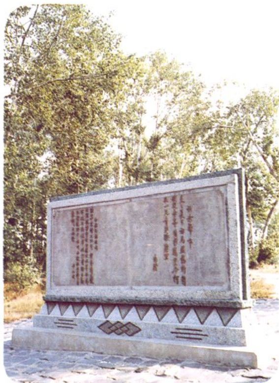
朱德、董必武视察赤峰纪念碑