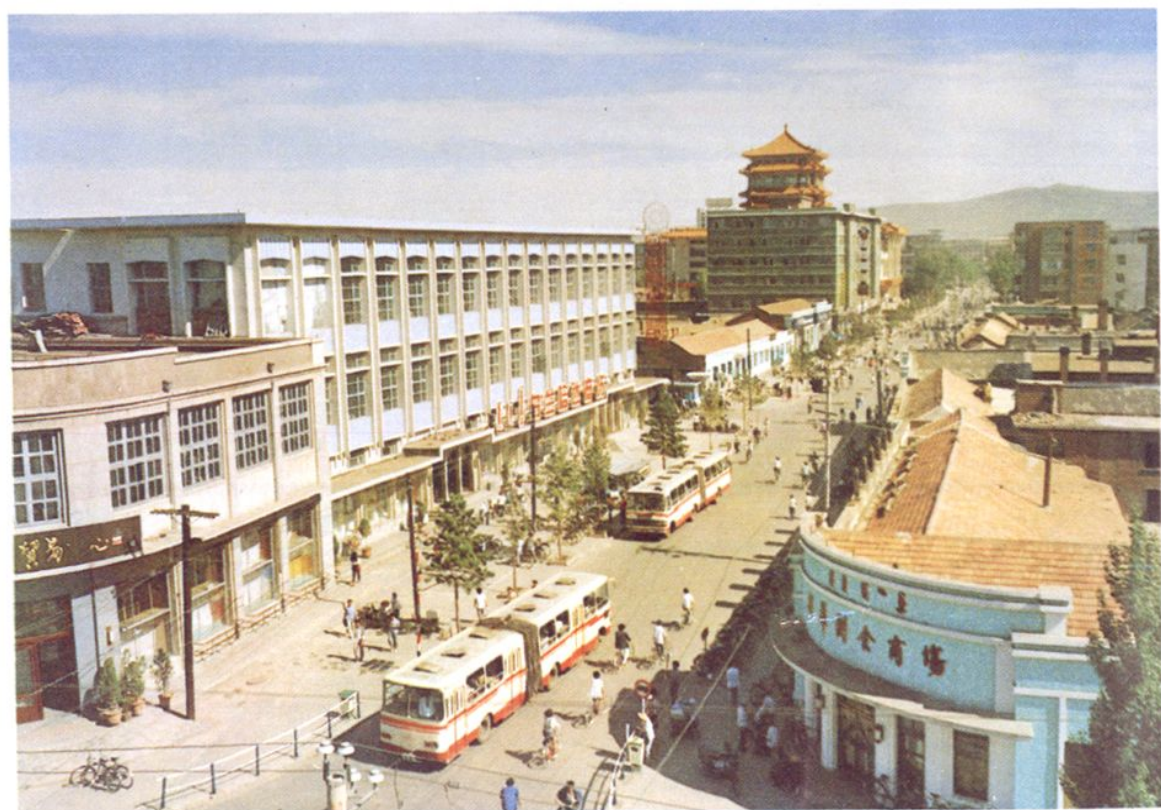
新 华 路