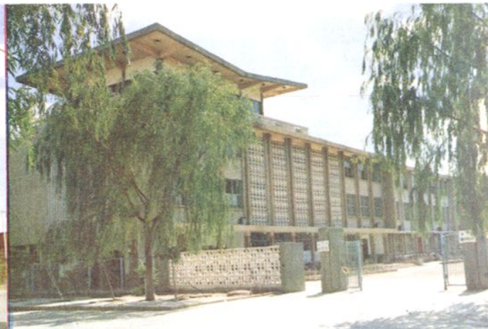
赤峰市回民实验小学