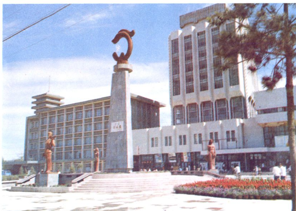
玉龙雕塑和工人文化宫