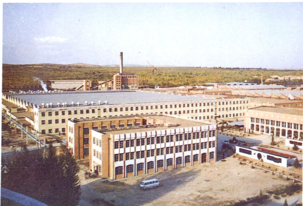
赤峰第二毛纺织厂厂区一角