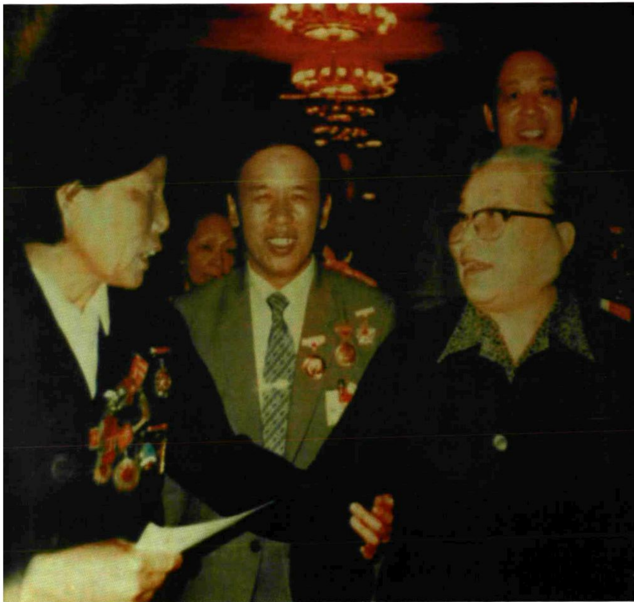
申纪兰同康克清一起参加1989年国庆宴会。