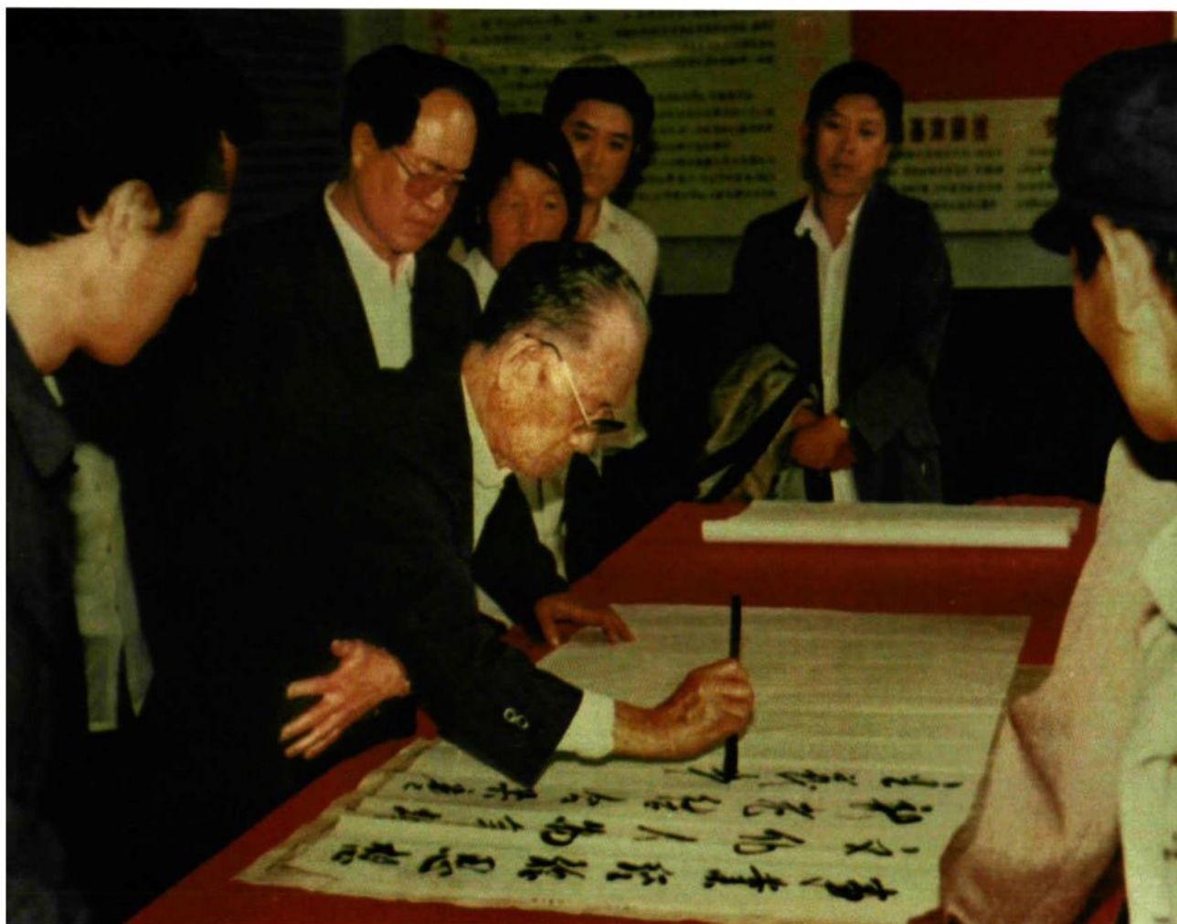
1996年6月，李雪峰再次视察平顺，图为他在参观西沟展览馆后题词