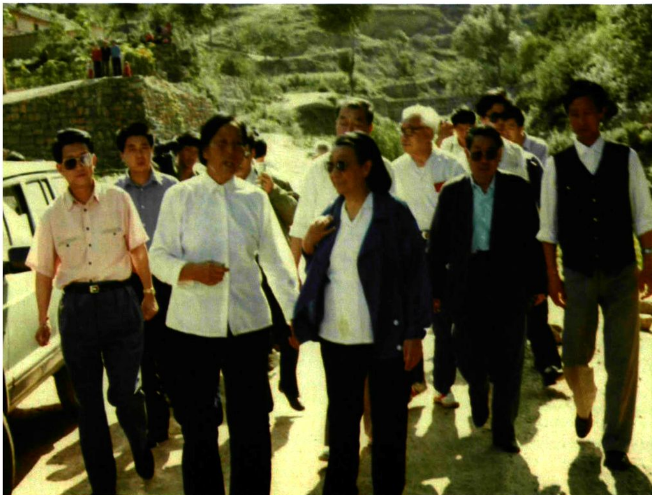
1996年6月，钱正英视察平顺。