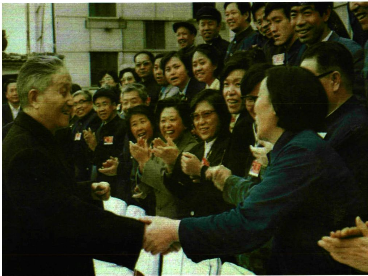
1988年4月，程子华接见出席全国人代会代表时，同申纪兰亲切握手。